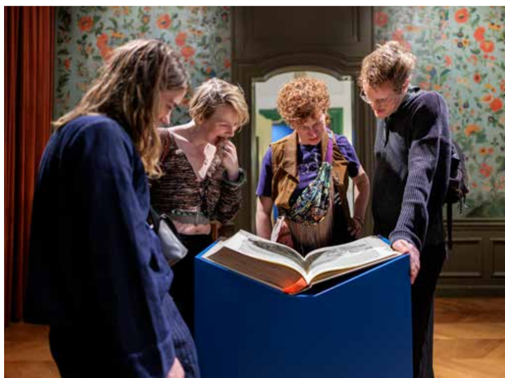
De wereldkroniek uit 1493 begint bij de schepping en eindigt bij de Apocalyps.

Door de eeuwen heen hebben mensen zich deze vragen gesteld en het gevoel gehad dat het einde der tijden nabij was. Hele boeken zijn erover geschreven, vaak prachtig versierd met kleurrijke, tot de verbeelding sprekende illustraties. Het museum bezit zulke boeken en stelt ze nu tentoon rond dat soms huiveringwekkende thema. In zorgvuldig verlichte zalen liggen de