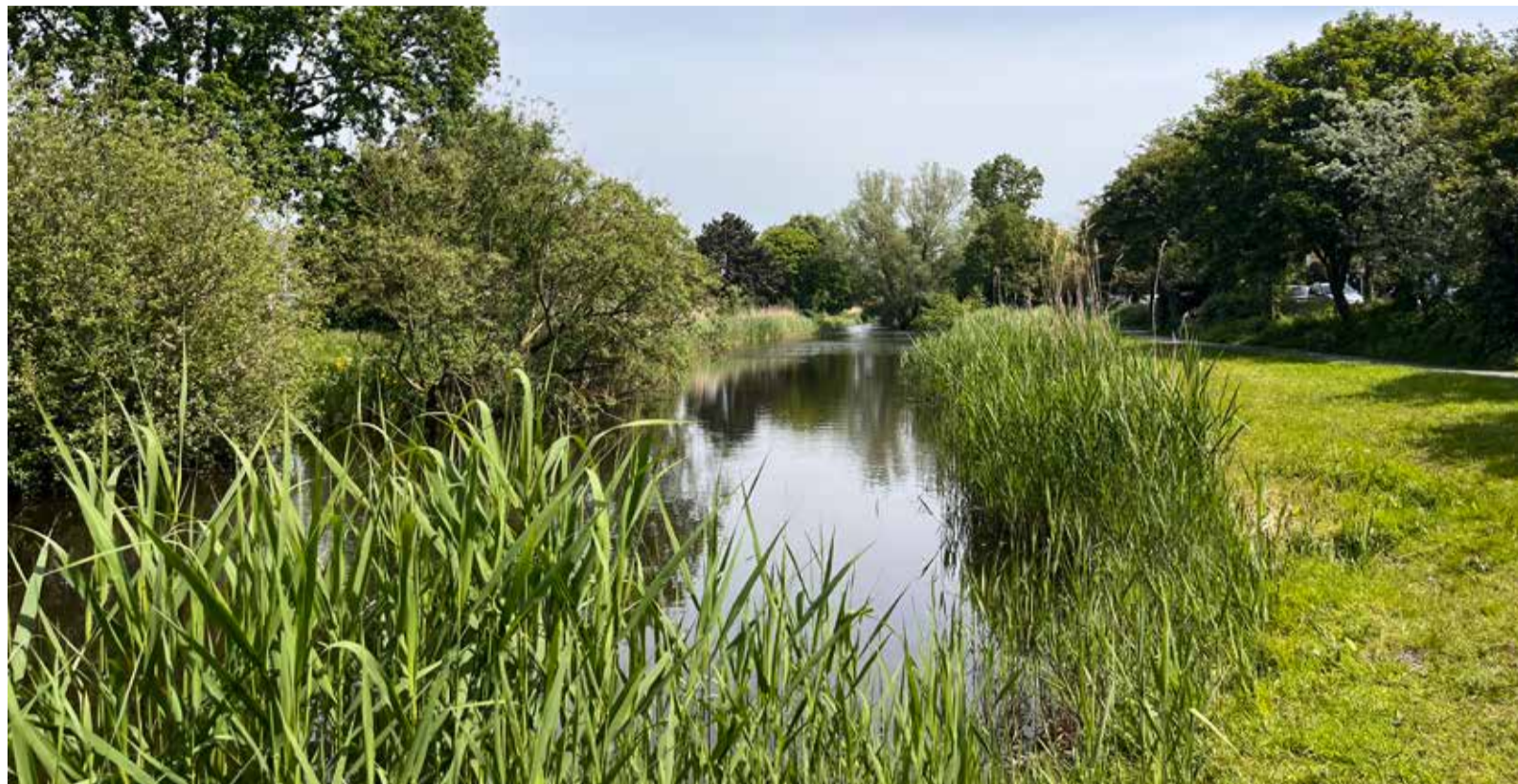
Langs de Balsemienlaan verbreedt de Haagse Beek zich tot een vijver.

Samen met mijn wandelvriendin pak ik de bus naar Kijkduin. De Beek ontspringt daar in het Schapenatjesduin. Na enig zoeken staan we ineens bij de bron: een kleine poel in een duinbosje, met gouden vlekjes waar de zon door het gebladerte breekt. Turend in het heldere water denken we terug aan eerdere wandelgesprekken. Welke verborgen bronnen dragen wij nog in ons? Wat mag er nog gaan stromen? We nemen de vraag mee en volgen het stroompje richting de binnenstad. Dat is niet zo eenvoudig als het lijkt: soms gaat de Beek even ondergronds en dreigt onder ons vandaan te kronkelen naar aantrekkelijke maar doodlopende zijarmen – het lijkt het echte leven wel. Met hulp van de kaartenapp op onze telefoon weten we de stroom steeds terug te vinden. De naam Haagse Beek suggereert een natuurlijke waterloop, maar de beek is wel degelijk gegraven. Waarschijnlijk