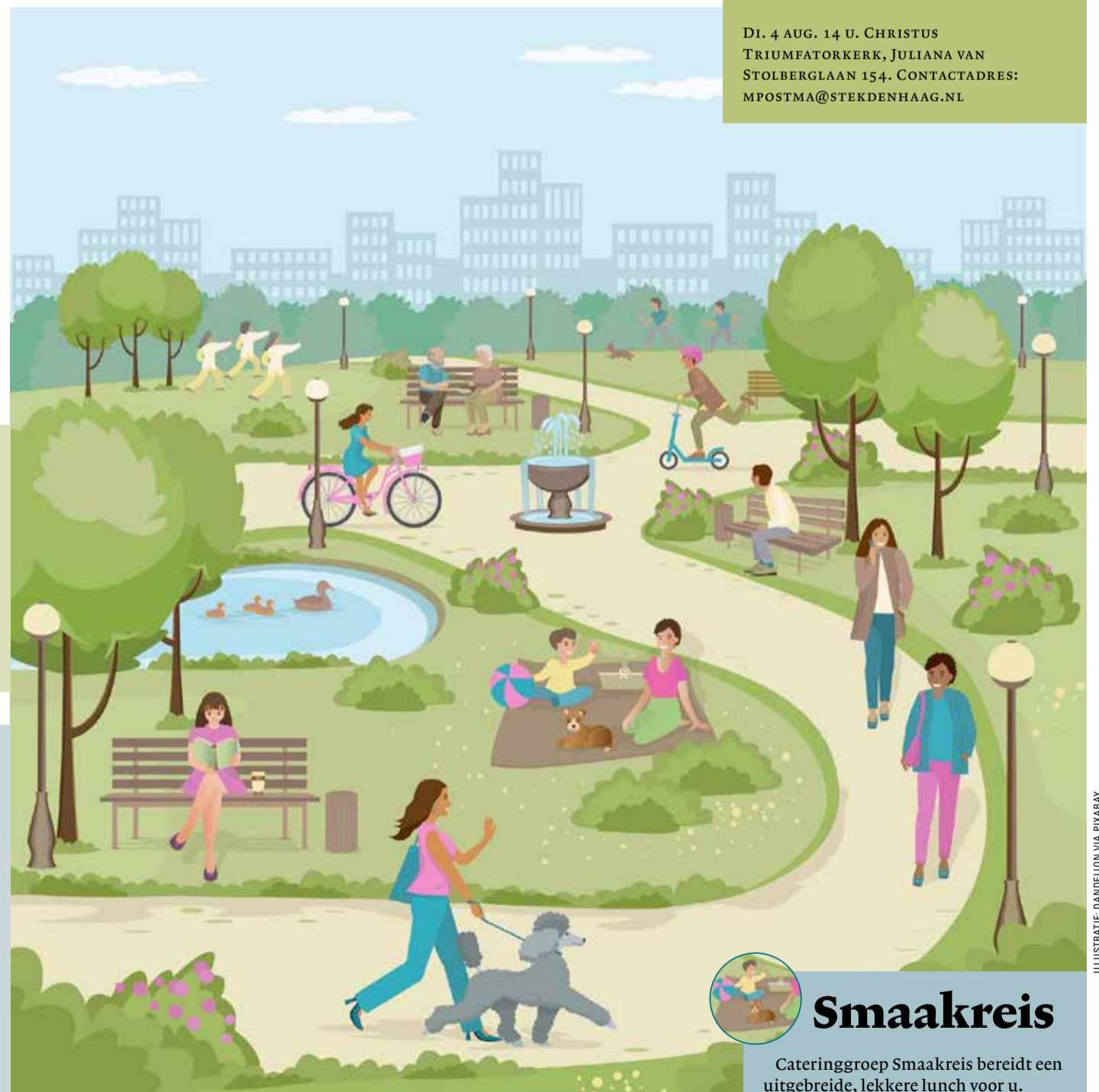
ILLUSTRATIE DANDELION VIA PIXABAY

DI. 21 JULI 14.30-16 U. DE OASE, VAN MEURSSTRAAT 1. AANMELDING: KERKINLAAK@GMAIL.COM