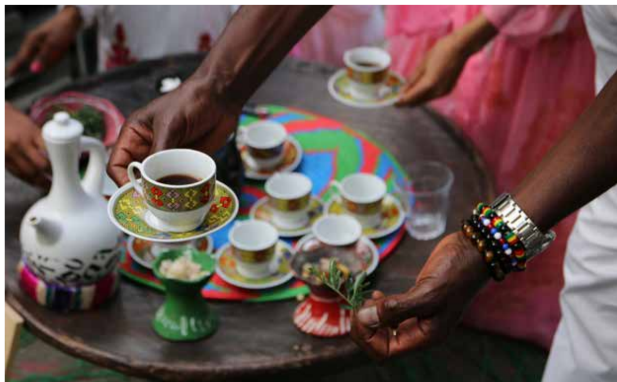
‘Koffie is uitgevonden in Ethiopië. Wij dronken al koffie in de negende eeuw.’

Terwijl buiten op de binnenplaats de koffiebonen al geroosterd worden en de lekkere geuren naar binnen waaien, vertelt Negate uitgebreid over de Ethiopische koffiecultuur. ‘Wij dronken al koffie in de negende eeuw. Koffie is uitgevonden in Ethiopië.