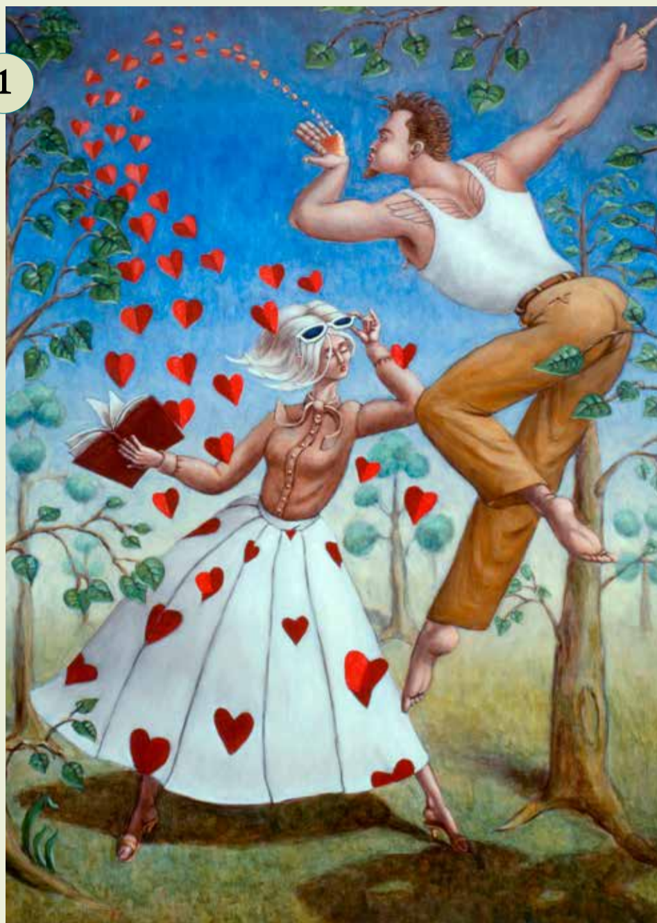
ANNUNCIATIE, FRANS FRANCISCUS, COLLECTIE MUSEUM CATHARIJNECONVENT