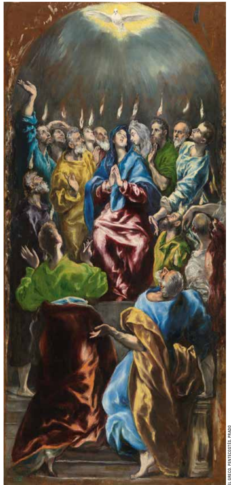
EL GRECO, PENTECOSTES, PRADO