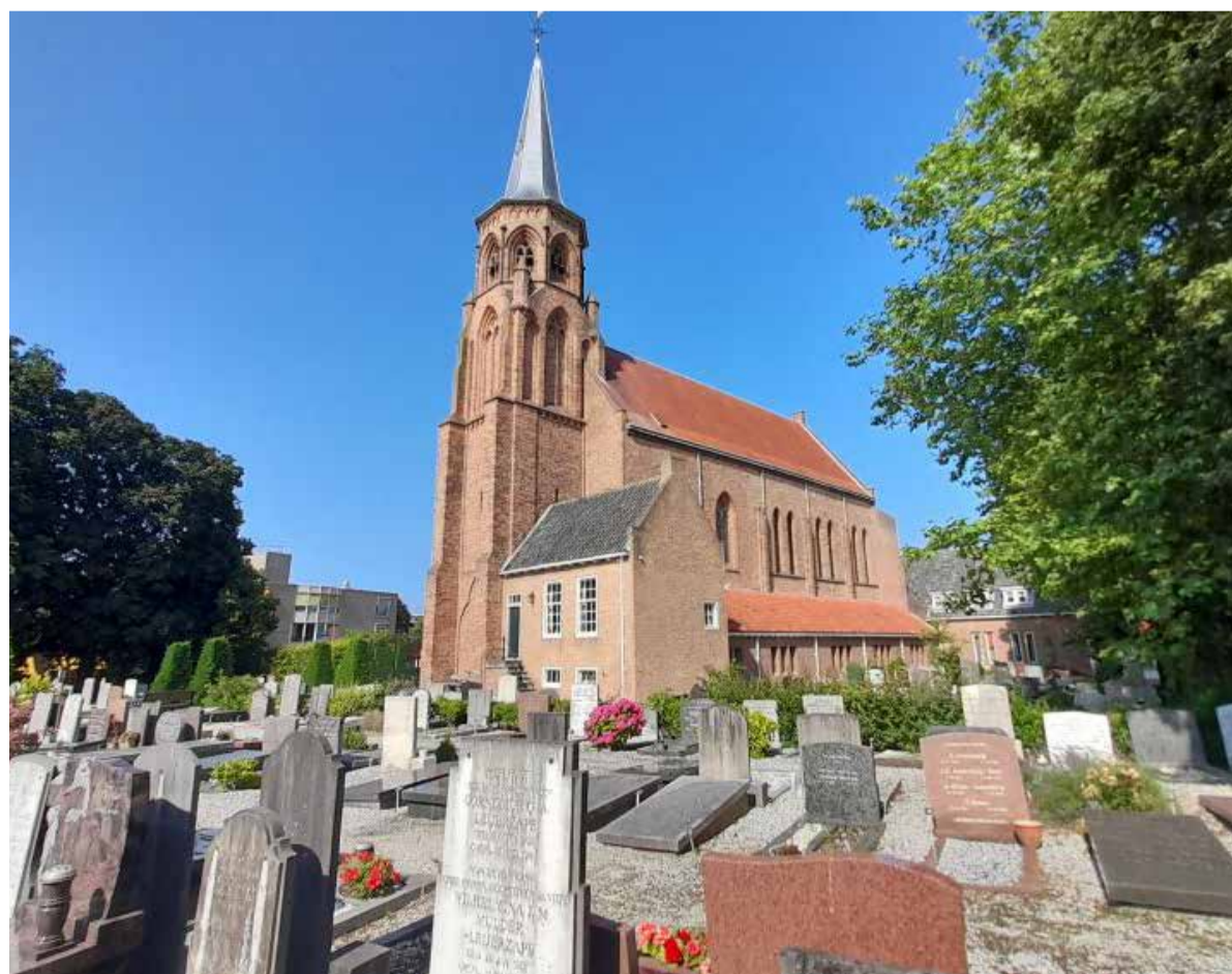
Het kerkhof van de Abdijkerk