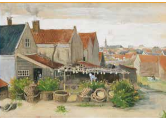
SCHARRENDROGERIJ TE SCHEVENINGEN.

DI. 12 MEI. 20-21.30 U. BERGKERK, DAAL EN BERGSELAAN 50A