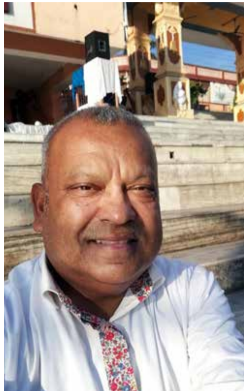
‘Dagelijkse offers brengen mij in balans’

Navrati (spreek uit: nauráti) betekent letterlijk ‘negen nachten’. Het is een hindoeïstisch feest dat dit jaar gevierd wordt van 26 september t/m 4 oktober. Vrome hindoes houden op één of op meer van deze dagen een offerdienst met mantra’s en gebeden, dit gebeurt meestal thuis. Centraal staat de verering van Durga, de hindoe-moedergodin met haar negen vormen van vrouwelijke energie en haar overwinning op het kwaad. De gelovigen streven een persoonlijke reflectie op hun handelen na: een lichamelijke, spirituele en mentale zuivering.