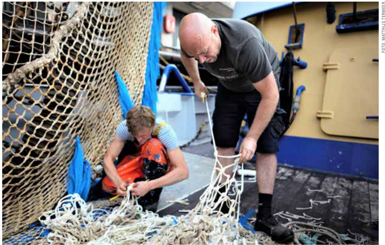
De bemanning van de Maarten-Jacob OD-1 herstelt de netten na een vierdaagse vistocht op de Noordzee.

Zo zijn er wel meer zaken waarover de vissers klagen. Windmolenparken op zee en natuurgebieden zorgen voor inkrimping van de visgronden, de Engelsen zijn sinds de Brexit minder scheutig met visserijrechten en ‘Europa’ doet de zaak al helemaal geen goed. Neem de pulsvisserij, een