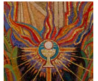
ABT IN SCHEVENINGEN. HILVERSUM: VERLOREN, 2022. ISBN 9789087049799, € 30,-

Disclaimer: Kerk in Den Haag heeft getracht alle rechthebbenden te achterhalen. Indien iemand desondanks meent rechten te kunnen doen gelden, dan kan hij of zij contact opnemen met de eindredacteur.