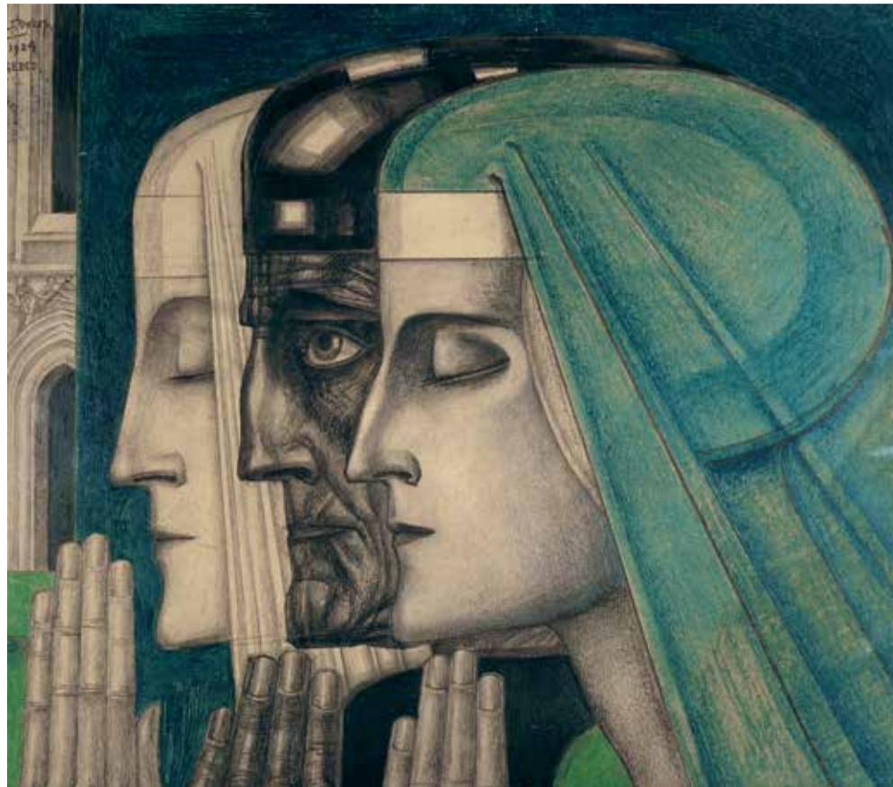
Jan Toorop, 'Bezonkenheid. Meditatie, Vuur', 1923

'De basis van iedere viering is de meditatie, de stilte en het contact met God. We zingen liederen uit de Taizébundel, korte liederen of mantra's die we een aantal keer herhalen. Door de herhaling gaan de liederen als het ware in jou zingen en ontstaat er een meditatieve sfeer. Wat het voor mij betekent? In de stilte en de eenvoud, zonder dominee of priester, kan ik in contact komen met iets dieps in mezelf, met God, de Eeuwige of het eeuwige. Ik vind het mooi om gewoon op de grond te zitten, gericht op een icoon, met een paar lichtjes. Om met elkaar in gebed en gezang te gaan en de band met elkaar en met de eeuwigheid te voelen. Daar raak je aan verslaafd. Ik zie het ook bij anderen. Mensen blijven komen en gaan de stilte omarmen.'