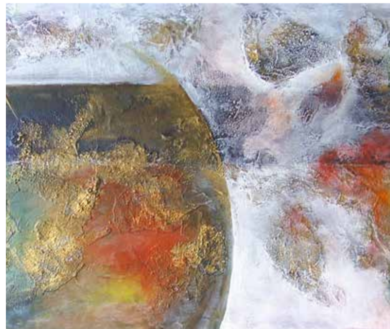
Nieuwe hemel en aarde 2