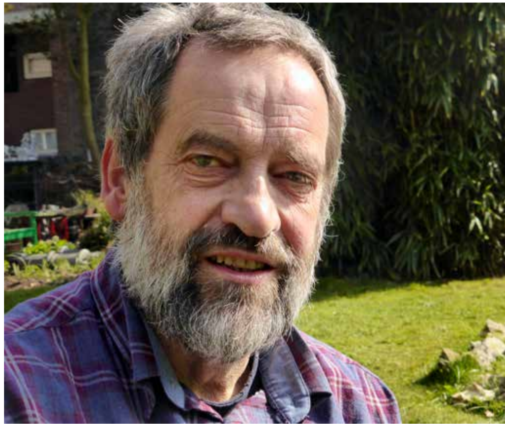
Het doorleefde gezicht van de straatpastor