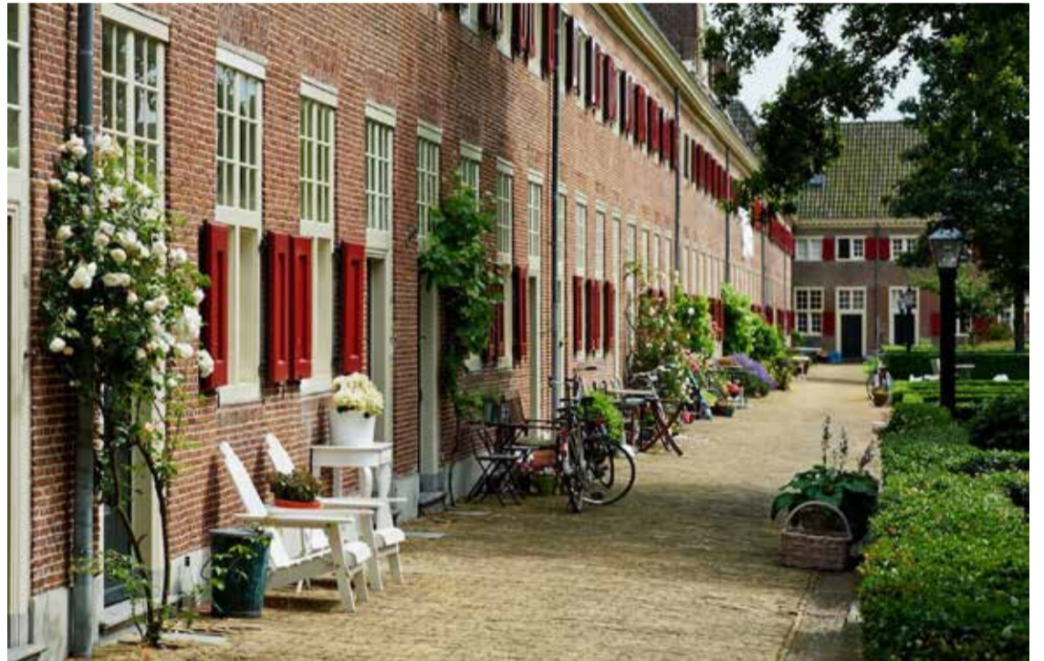
Het hofje van Nieuwkoop