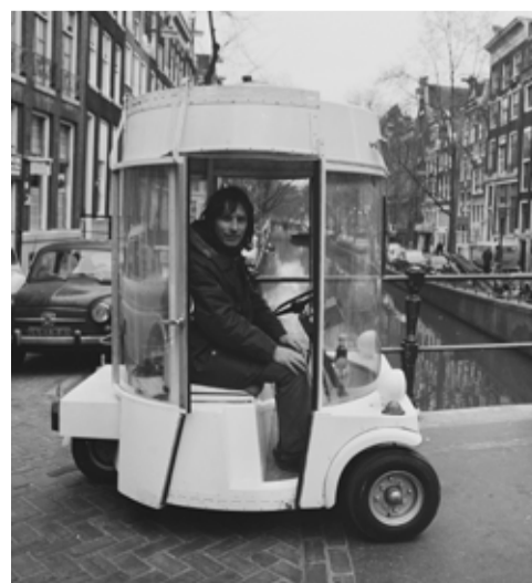
De witkar, 1974

achternicht is van de Zweed Svante Arrhenius. Die berekende eind negentiende eeuw al dat de aarde opwarmt door de uitstoot van broeikasgassen. De klimaatdiscussie in de westerse wereld zorgt voor spanningen met landen op het zuidelijk halfrond. Moeten zij de prijs betalen voor onze kaalslag van