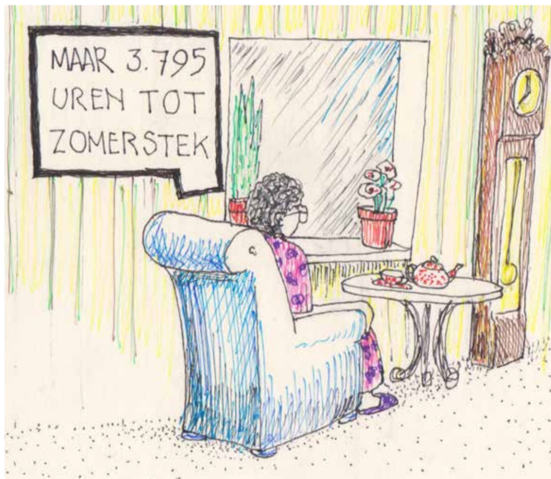
ILLUSTRATIE: RONALD VAN BOCHOVE

Organiseert u in de periode van 18 juli tot en met 26 augustus activiteiten die in dit programma passen of heeft u een geschikte ruimte? Neem dan voor 2 mei contact op met Anita del Monte, adelmontelyon@stekdenhaag.nl of 070-3181616.