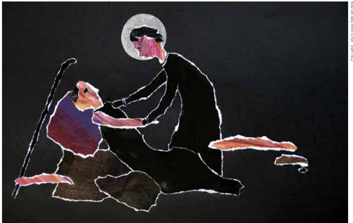
‘Al gaat mijn weg door een donker dal, ik vrees geen gevaar want u bent bij mij. Uw stok en uw staf, zij geven mij moed.’ (Psalm 23, NBV 2004)