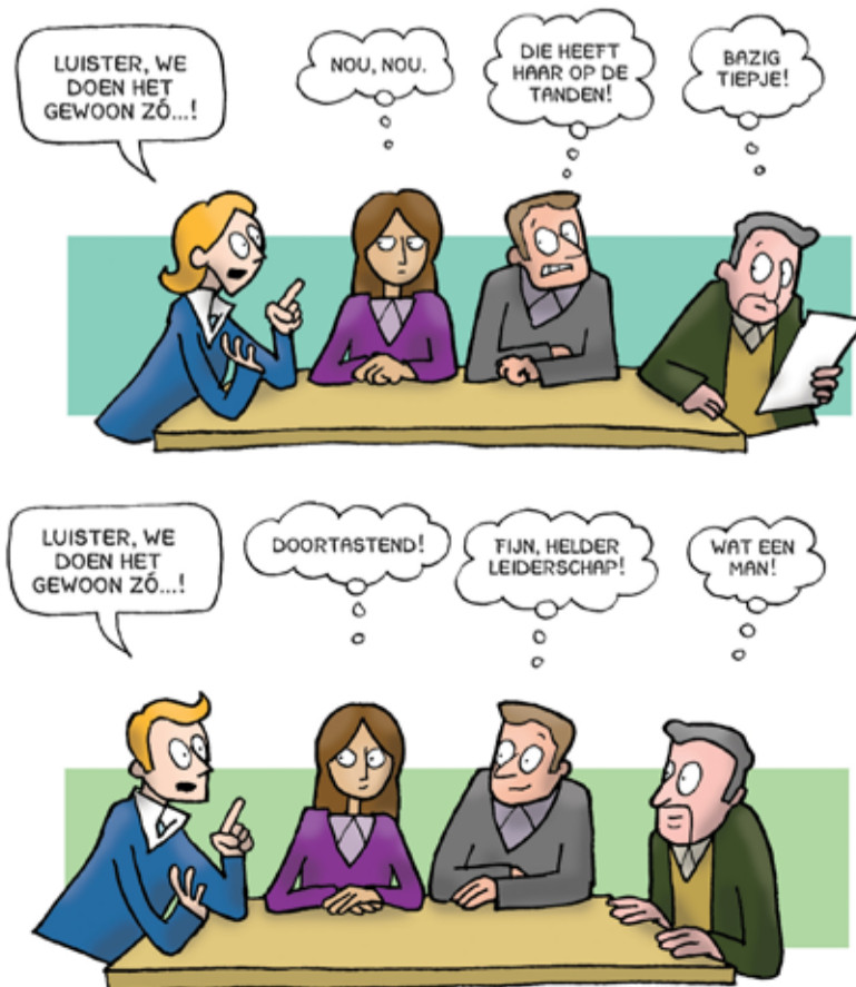
CARTOON: MARGREET DE HEER

BRONNEN: NEDERLANDS DAGBLAD, 11 JUNI 2021; TROUW, 12 JUNI 2021