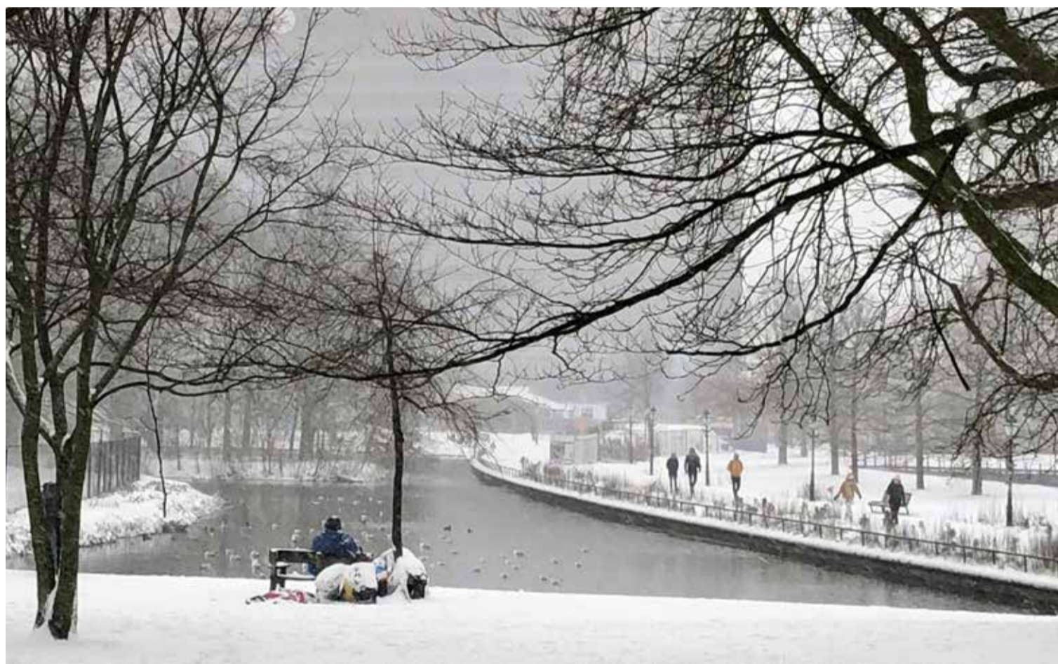
Chris van Dam: ‘We zijn allemaal twee of drie stappen verwijderd van zelf in de problemen komen.’

Van Dam heeft een grote droom: ‘We zouden in Den Haag een ambassade van kerkelijk