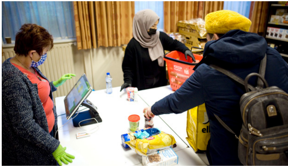
Kies! Voedselbankwinkel in bedrijf op een dinsdagmiddag

Den Haag-Zuidwest neemt bijna het hele stadsdeel