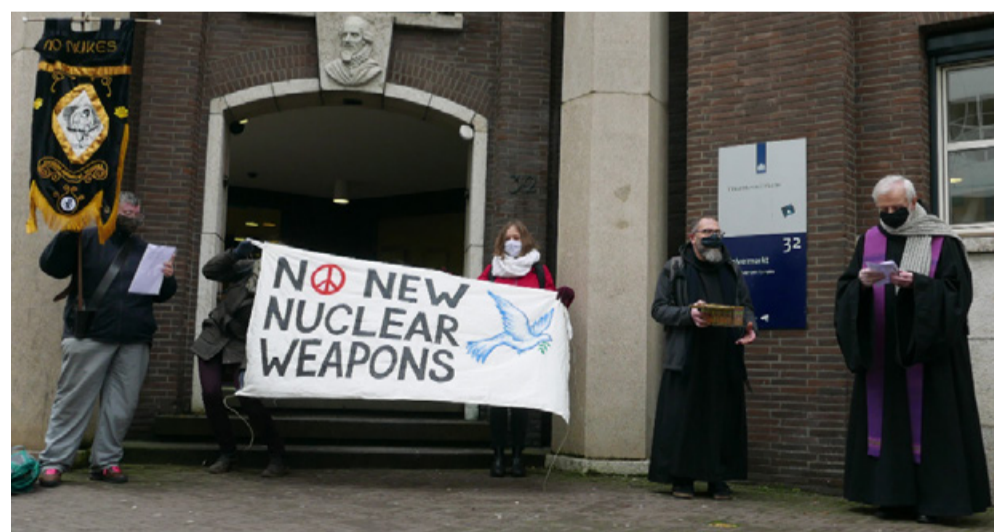
De demonstratie tegen kernwapens op Aswoensdag in Den Haag

Ze vertelt het met droge ogen en heeft geen spijt. ‘Het is niet per se goed om dit soort dingen te doen, want je overtreedt gewoon de wet, maar het is nog veel erger om het niet te doen’,