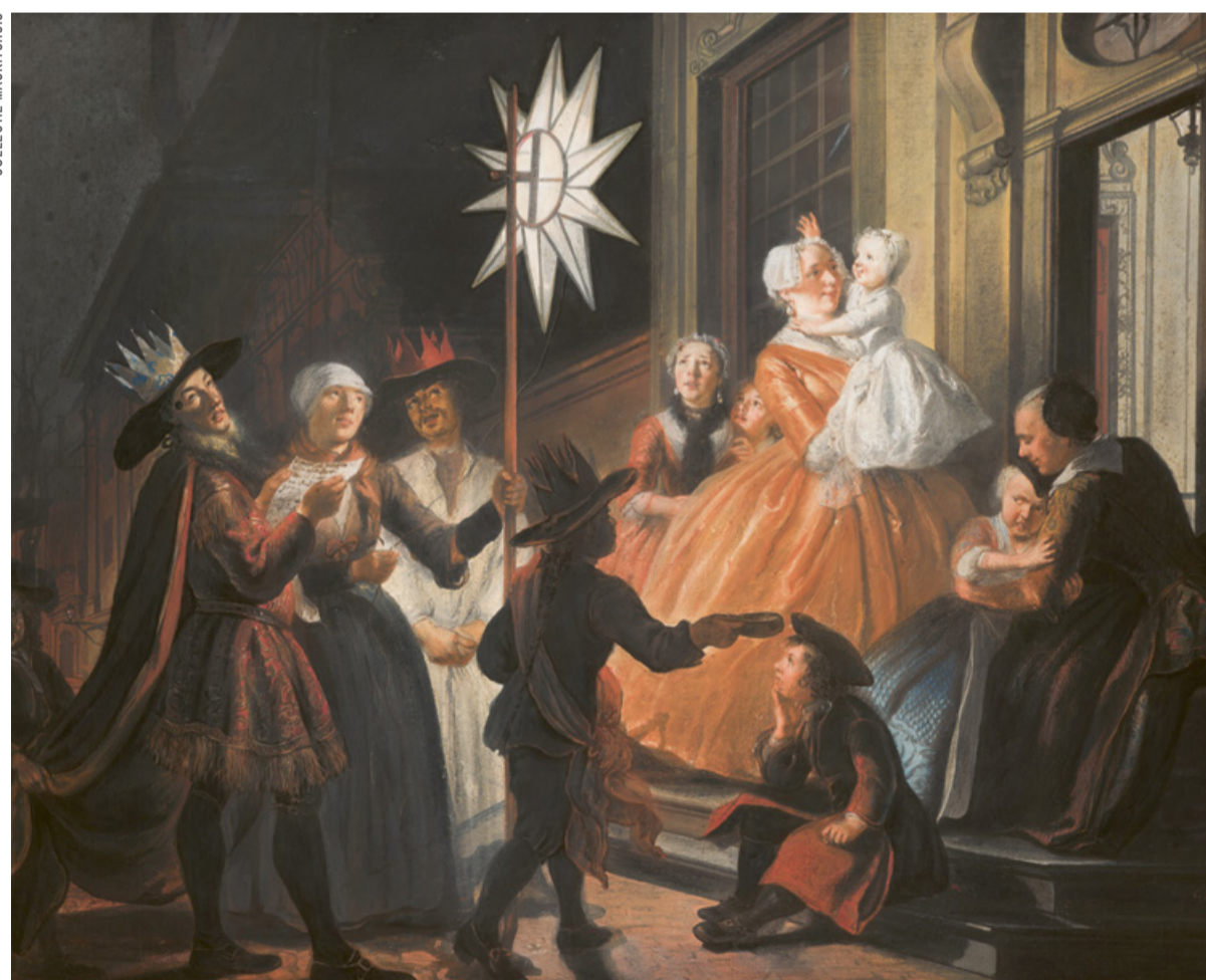
Cornelis Troost (1696 – 1750). Het zingen bij de ster op Driekoningen

Op 6 januari is het Driekoningen. In de collectie van het Mauritshuis bevindt zich het schilderij ‘Het zingen bij de ster op Driekoningen’ van Cornelis Troost. Hierop zien we een aantal kenmerkende en soms vergeten tradities rond dit vrolijke feest.