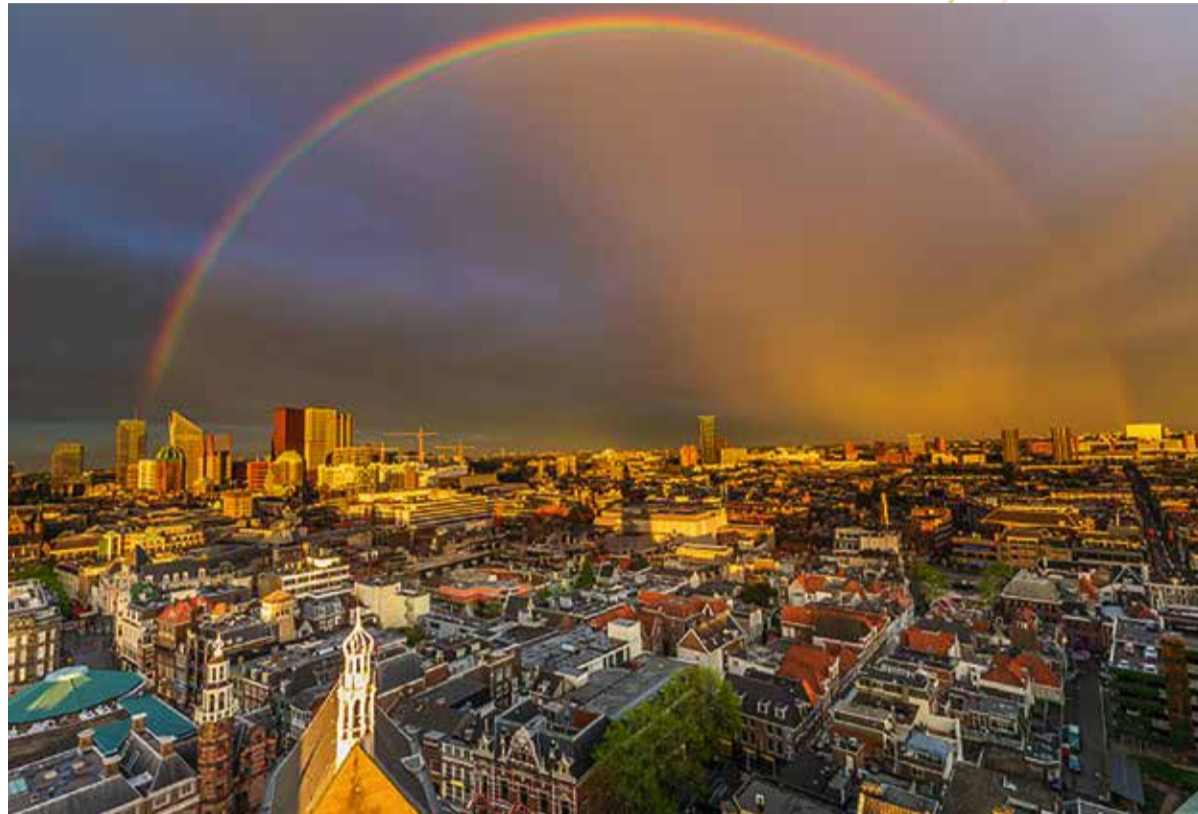
Een teken van hoop boven Den Haag

In Hulde aan de hoop sprak ze haar verbazing uit dat eindtijdverwachtingen in 1980 over het jaar 2000 verdacht veel leken op de eindtijdverwachtingen die men rond het jaar 1000 had. 'Waar onze maatschappij totaal verschilt van