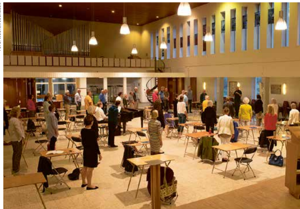
Het Haags Barokgezelschap repeteert op afstand in de Bergkerk voor het Requiem van Mozart.