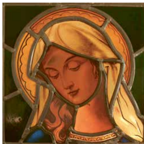
Glas-in-loodraam in de pastorie van de Antonius Abtkerk.

Niet alleen over Maria's moeder-zijn valt het nodige te zeggen. Het tweede deel van het boek gaat over Maria als vrouw. Zij was een Joods meisje. De Bijbel legt daarop grote nadruk en met name de evangelist Mattheüs, die specifiek voor een Joods publiek schreef. In de kerkelijke en theologische traditie is helaas Maria's maagdelijkheid veel sterker benadrukt dan haar Joodse identiteit. Dat heeft grote schade gedaan, met antisemitische effecten tot de dag van vandaag. Ook het beeld van Maria als tweede Eva heeft schadelijke effecten gehad. Hoewel de Bijbel daartoe geen aanleiding geeft, werd Eva in de loop van de geschiedenis steeds meer het model van de vrouw die de zonde in de wereld heeft gebracht. Vrouwen zouden extra vatbaar zijn voor zonde en mannen in verleiding brengen. Daartegenover stond Maria dan als onbereikbaar ideaal van vrouw-zijn: geen