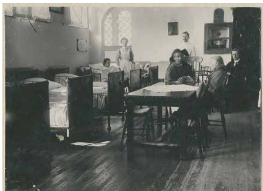
De ziekenzaal voor vrouwen in het Dolhuys aan het Slijkeinde in Den Haag, rond 1910.

CORRY VAN STRATEN, VAN KAPEL TOT DOLHUY: HAAGSE GEESTEZORG VANAF DE MIDDELEEUWEN TOT 1700. DE NIEUWE HAAGSCHE, 2021. ISBN 9789460101021; 312 PAGINA'S; € 22,95.