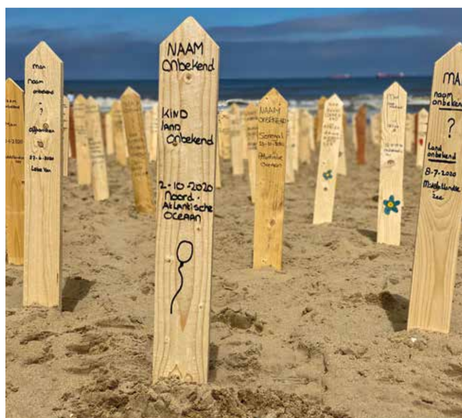
De gedenktekens op het Scheveningse strand