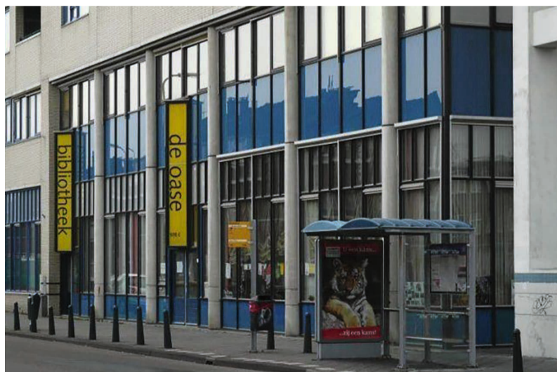
De Oase, de 'bezielde huiskamer' van Laak, is onlangs gesloten.

In buurt- en kerkhuis de Oase is geschiedenis geschreven: het Vadercentrum en de kringloop begonnen er. Dankbaarheid en ontroering gaan hand in hand bij het afscheid van de voorziening. Na 27 jaar is de Oase definitief gesloten.