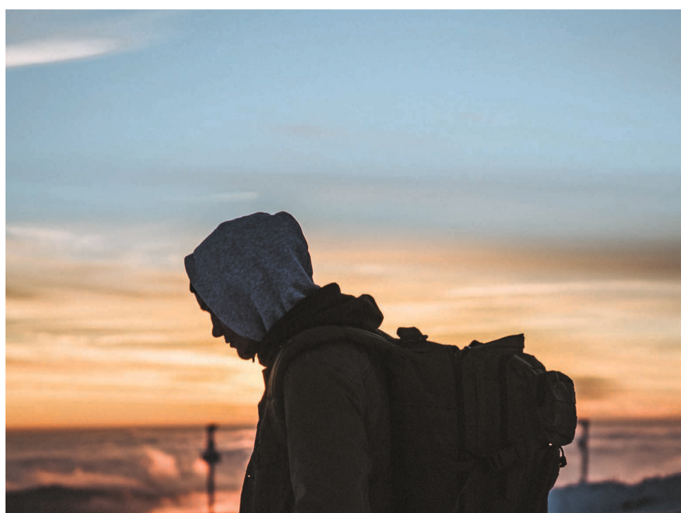
De afgelopen tien jaar is het aantal daklozen in Nederland verdubbeld naar circa 40.000. Zo’n 12.000 hiervan zijn jongeren.

Van Es: ‘De informatie die ze krijgen over waar ze terecht kunnen is belangrijk én dat er iemand naast ze staat, maar uiteindelijk is een jongere het meest geholpen met een eigen plek waar hij tot rust kan komen. De noodopvang is meestal vol, dus er is vaak een wachttijd, maar als je er zit, zou dat eigenlijk maximaal drie maanden moeten duren. In die tijd kan bepaald worden welke stappen er moeten worden gezet. Maar door een tekort aan betaalbare woningen zitten jongeren nu wel één tot twee jaar in een nachtopvang met tien anderen op een slaapzaal. Dat is veel te lang, er is geen privacy, je komt niet tot rust doordat er om je heen constant iets gebeurt. Na een maand of vier, vijf komt er vaak een breekpunt. Je zit