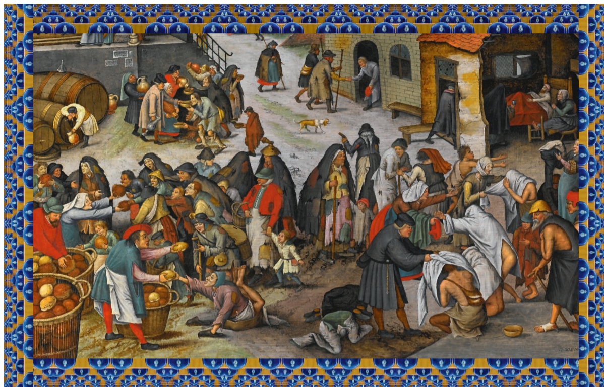
Pieter Bruegel, De Zeven Werken van Barmhartigheid . Rijksmuseum Twenthe, na 1616.

Er is één partij waar de middeleeuwse uitgangspunten bijna letterlijk in het verkiezingsprogramma staan. In het hoofdstuk over ontwikkelings-samenwerking schrijft de SGP: 'De