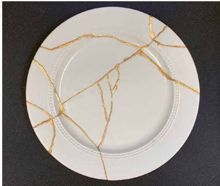
Kintsugi is een Japanse kunstvorm om scherven van aardewerk met goud te lijmen. Barsten worden niet onzichtbaar weggewerkt, maar juist geaccentueerd, waardoor de schoonheid van imperfectie zichtbaar is.

Het probleem is dat de kerk traditioneel veel zonde en schuld aanwezig achtte, of het je anders wel inpeperde. Als jongen zat ik met een kwaad geweten in de bioscoop. Zelfs in het donker zag God mij daar. Mijn verkering raakte bijna uit omdat ik op zondag een ijsje voor haar kocht. Maar wie gelooft er nu nog dat God bioscoopbezoek turft of ons een ijsje misgunt? Moeten we van zulke 'zonden' gered worden? Of zijn 'echte zondaren' de geweldplegers, corrupte ambtenaren, kinderverkrachters? Gelukkig zijn die in de minderheid, de meeste mensen deugen. En toch schrijft de evangelist Lucas dat Jezus het volk kwam redden door hun de zonden te vergeven. Om dat te begrijpen moeten we de aangeprate zonde en schuld maar even vergeten. Want, gelovig of niet, iedereen beseft wel dat wij mensen brokkenmakers zijn. We bedoelen iets goed, maar het pakt verkeerd uit. Een niet nagekomen belofte verwoest een vriendschap. En dan komt daar nog eens bij dat anderen ons soms met de brokken laten zitten. Onrecht op de werkplek en thuis krijgt de hond een schop. We leven ook in een wereld die onoverzichtelijk is geworden, waarin je moet kiezen tussen kwaad en minder kwaad. Mensen zitten 'in een bubbel', wantrouwen wie anders denkt, voelen zich aangevallen of gediscrimineerd.