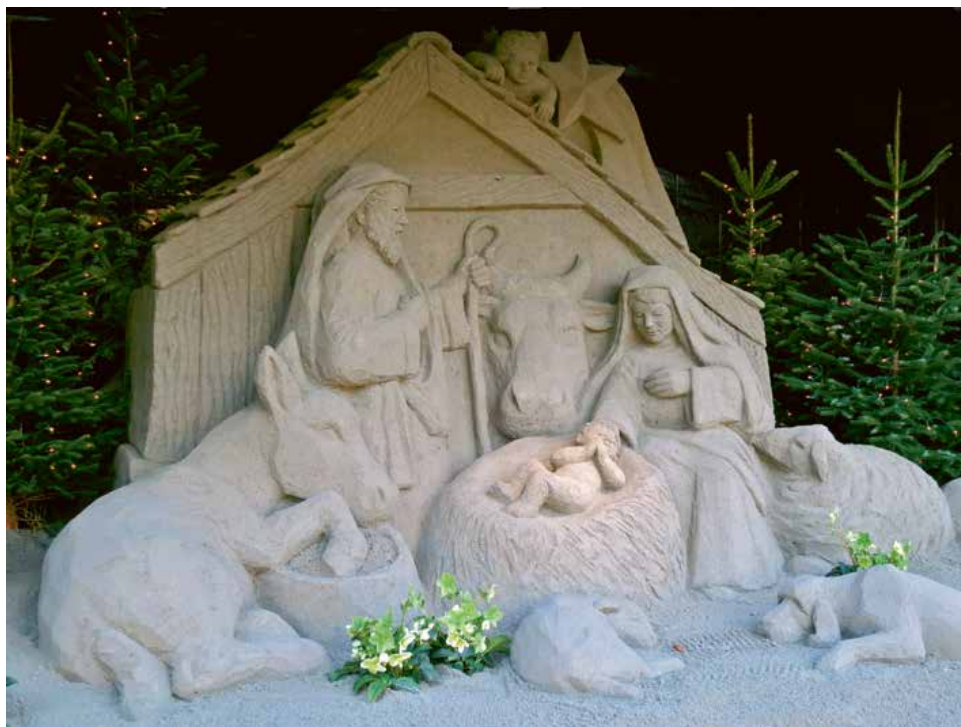
Kerststal van olivijnzand aan het Lange Voorhout, 2012

VERDER: Als je één mens redt, red je de hele mensheid ■ Den Haag heeft engelen in overvloed ■ Kerken kloppen op poorten van de macht ■ Het leven is tof zonder drugs