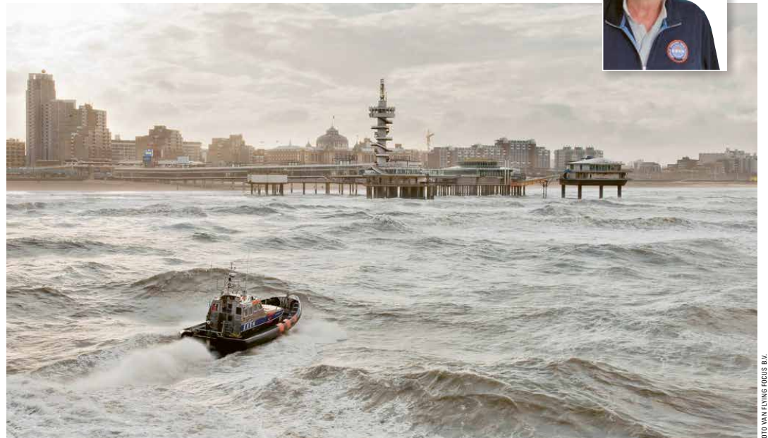
De Koninklijke Nederlandse Reddingsmaatschappij rukt voor een reddingsactie uit voor de kust van Scheveningen.

'We hebben de meest gemotiveerde vrijwilligers die je maar kunt bedenken. Ze zijn heel verschillend: glazenwasser, directeur, trambestuurder. Maar we zijn één team en we hebben één doel. We zijn er voor elkaar, hebben aandacht voor elkaar. Als organisatie moeten we onze eigen broek ophouden. Dat gebeurt met giften, legaten