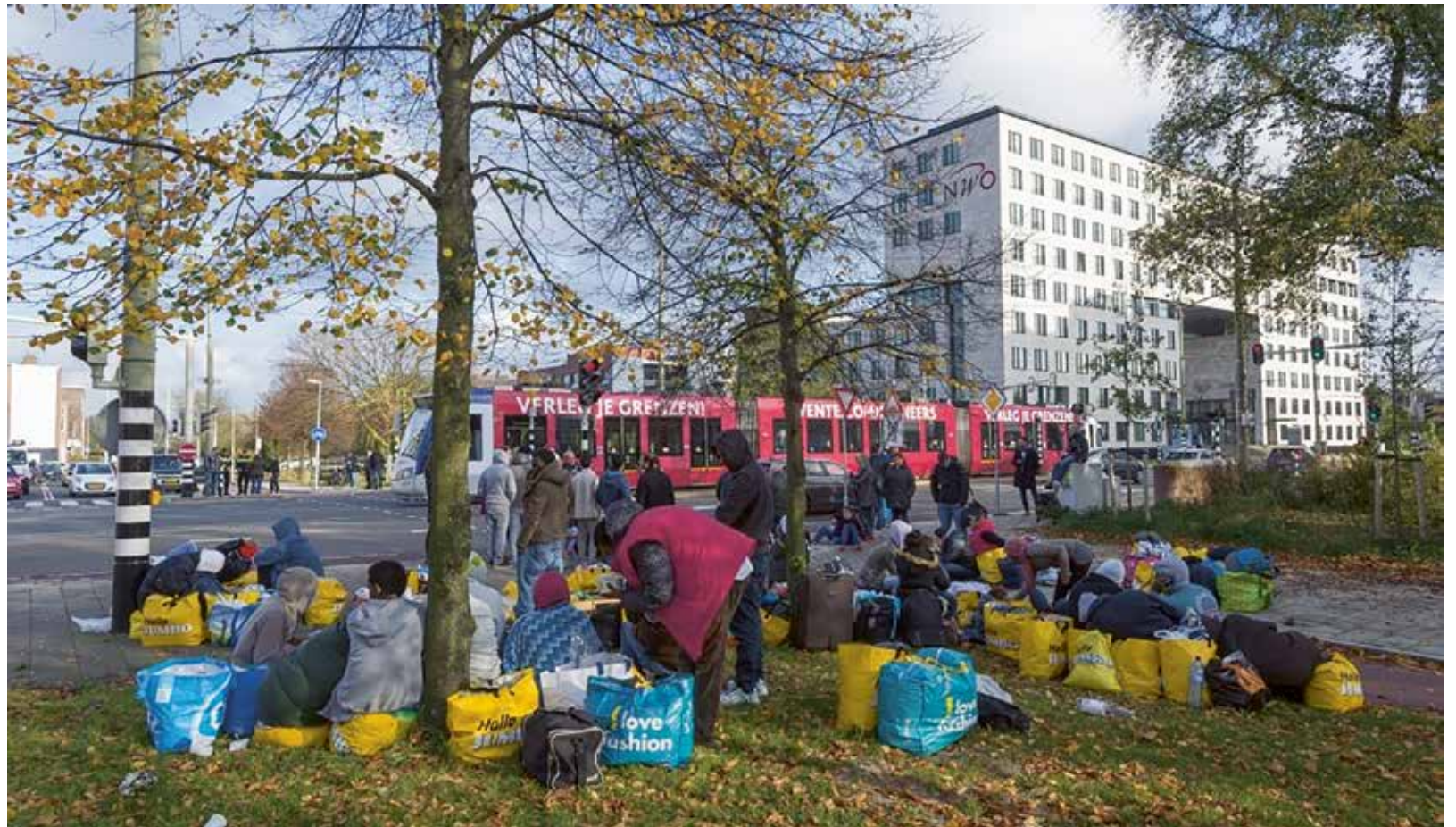
Bivakkeren op een plantsoen bij het NWO-kantoor. Op de voorbijrijdende tram staat de reclamekreet ‘Verleg je grenzen’.

Bij noodhulp gaat het om een eenmalig maximumbedrag van 250 euro. Wanneer er meer nodig is, kan een aanvraag ingediend worden bij de Commissie Bijstandszaken (CBZ). Deze commissie valt onder de Diaconie van de Protestantse Kerk Den Haag, waarvan Stek de uitvoeringsorganisatie is. De commissie bestaat uit vijf personen met ieder hun eigen expertisegebied, zoals onderwijs, geestelijke gezondheidszorg en