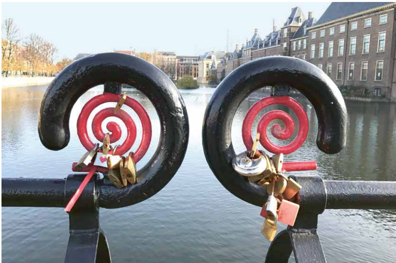
Liefdesparen hebben deze slotjes ooit aan de leuning bij de Hofvijver vastgemaakt en de sleutels in het water geworpen.