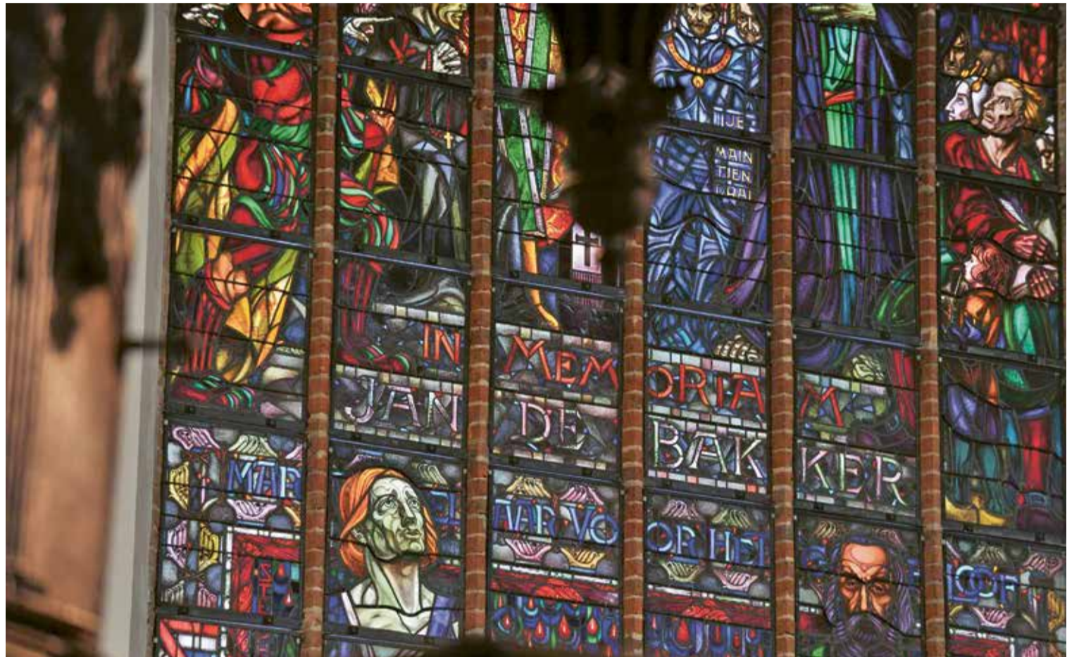
Het glas-in-loodraam gewijd aan Jan de Bakker: een krachtig vermaan om de godsdienstvrijheid te bewaken.