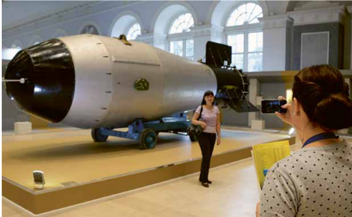
Bezoekers fotograferen elkaar lachend voor een kernraket in het Nucleaire Wapenmuseum in Sarov, Rusland.

In een verklaring, die aan het kabinet geadresseerd is, uit de Raad van Kerken zijn zorgen over de ‘vergaande plannen tot ‘modernisering’ van de kernwapens tot een investering van 1 triljoen dollar in de komende tien jaar (...)’. De Raad stelt enkele vragen aan de orde: beseft men wel dat een onbedoeld incident het aardse leven in één klap kan vernietigen? Kan het