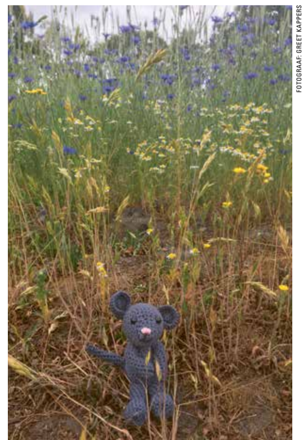
De meest creatieve knutselknuffelaar wacht een mooie prijs.