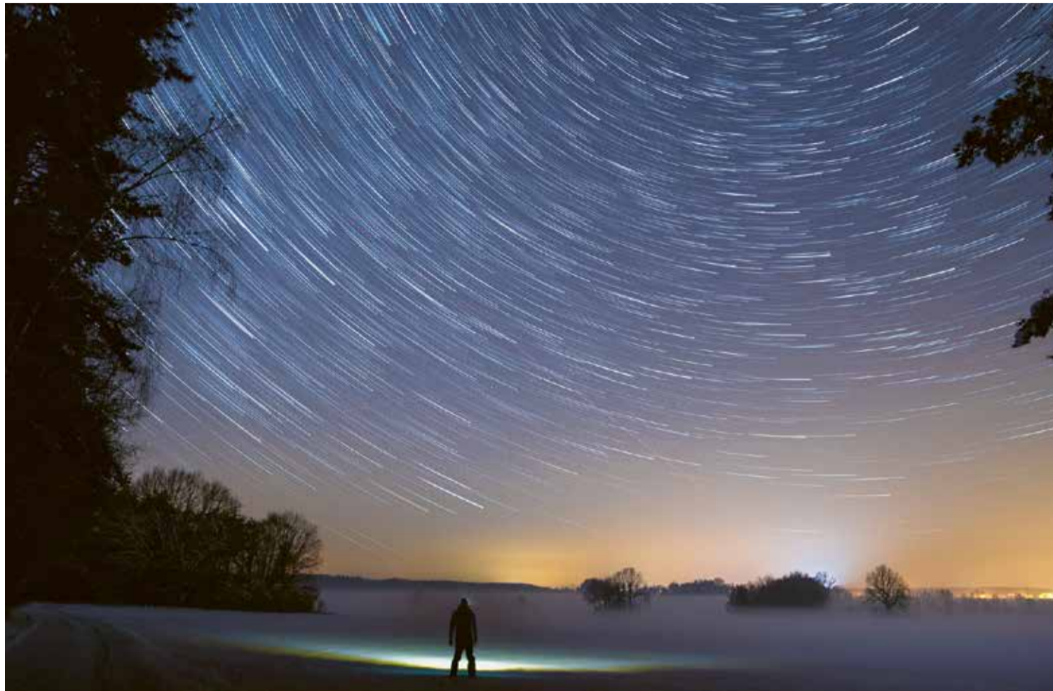
Sterren bewegen. Onze zon legt twintig kilometer per seconde af. Daarmee trekt ze andere sterren in het zonnestelsel aan.

THEOLOGIE Al eeuwenlang kijken mensen naar de sterren. Maar astronomen, kunstenaars, geliefden – ze zien niet allemaal hetzelfde. Ook vanuit de theologie is er in de loop van de eeuwen op heel verschillende manieren naar de sterren gekeken.