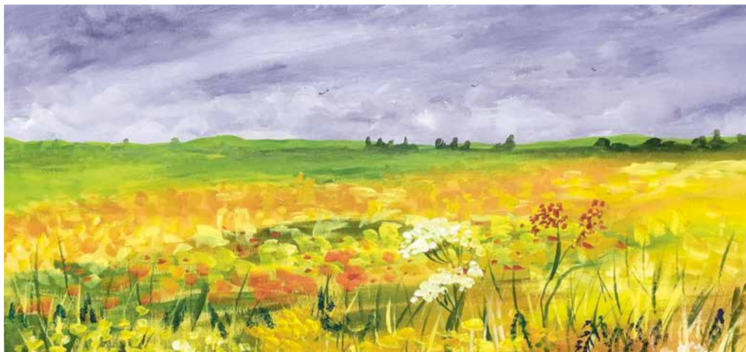
Bijna overal op aarde ontspannen mensen zich het liefst bij een groot, rustiek landschap aan de muur.

van de prehistorische grot. Het kunstenaarsduo Komar en Melamid vroeg aan mensen uit elf landen, welke elementen en kleuren zulke schilderijen het liefst moesten bevatten, en welke juist niet. Tot in detail kon je op formulieren je voorkeuren aankruisen. Het resultaat was een vermakelijk