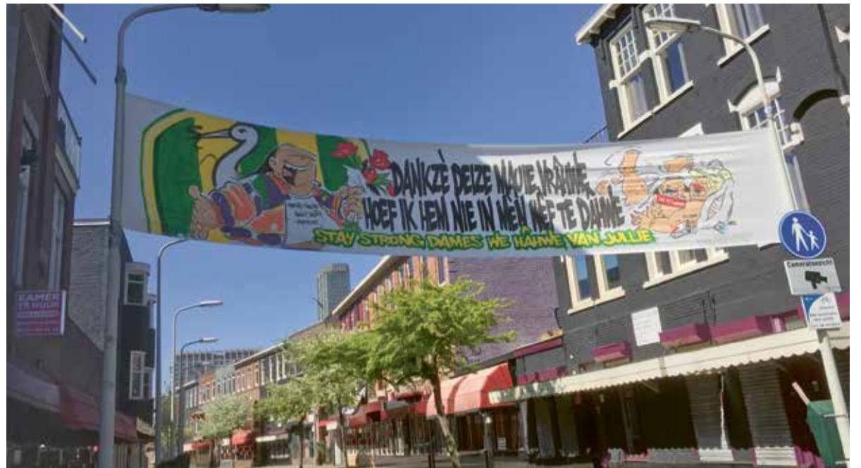
Voetbalsupporters van de Haagse club ADO hingen in de (lege) Geleenstraat een spandoek op. Er staat: ‘Dankzè deze mauje vràhwe, hoef ik hem nie in mèn wèf te dáhwe.’