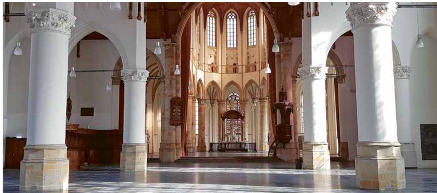
Grote Kerk, centrum. Bezoekers nemen graag in alle rust het lege kerkelijke 'landschap' in zich op. De leegte voedt het brein.

Zo beschouwd kan de anderhalvemeterkerk winst opleveren. Goed, niet iedereen heeft misschien de behoefte van de oermens om in afzondering inspiratie op te doen met uitzicht op lege velden. Uitgerekend Nederland was een uitzondering in het kunstproject People's Choice van Komar en Melamid. Nederlanders prefereren in hun onderzoek geen landschap aan de wand, maar een fleurig abstract schilderij. Maar nu, dertig jaar later, is deze naoorlogse geforceerd-gecultiveerde weerzin tegen realistische kunst wellicht verdwenen. Zodat ook Hollanders nu eindelijk durven toegeven aan hun diepste gevoelens en – opnieuw of voor het eerst – een kerk binnen durven lopen. Om vanuit de afzondering deel te krijgen aan een hernieuwd uitzicht.