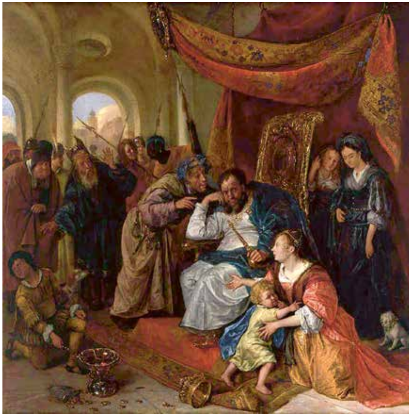
'Mozes en de kroon van de farao' (Jan Steen, Mauritshuis).

We zien op het schilderij de huilende Mozes, die getroost wordt door de prinses die verwijtend naar haar norske vader kijkt. Op de achtergrond heeft Jan Steen er ook nog een verbaasde Joodse priester en een ingekeerde 'oudste' als getuigen bij geschilderd. Om het verhaal als betrouwbaar kracht bij te zetten?