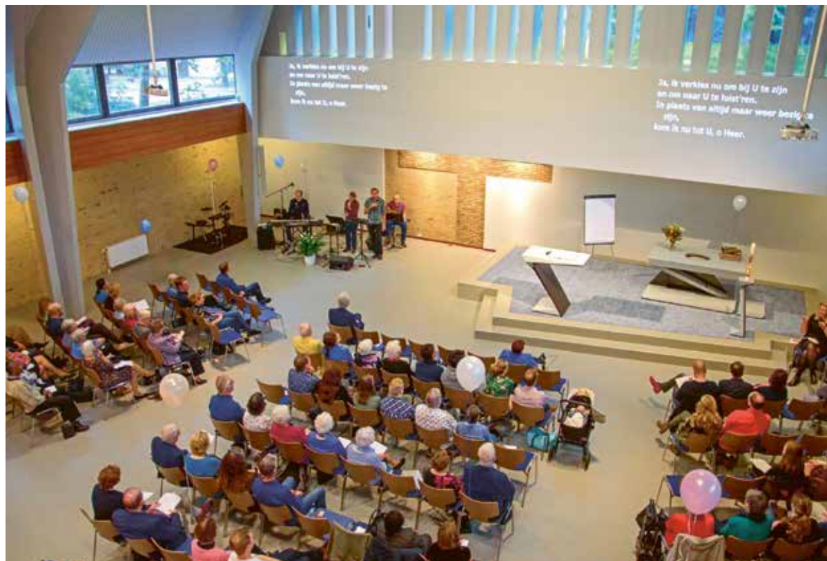
'Visuele rust om in godgerichtheid te komen', dat is wat een bezoeker van de herbouwde Pax Christikerk moet ervaren.