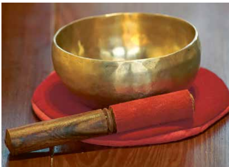
Een slag tegen de klankschaal luidt het begin in van de Haagse Dominicus-dienst.

REPORTAGE Tien jaar geleden werd naar het voorbeeld van de Dominicus in Amsterdam de Haagse variant opgericht. Wie vooral Huub Oosterhuis-liederen wil zingen, kan hier terecht. De actualiteit neemt een onmisbare plaats in tijdens de vieringen en de gemeenschap kenmerkt zich verder door de platte structuur.