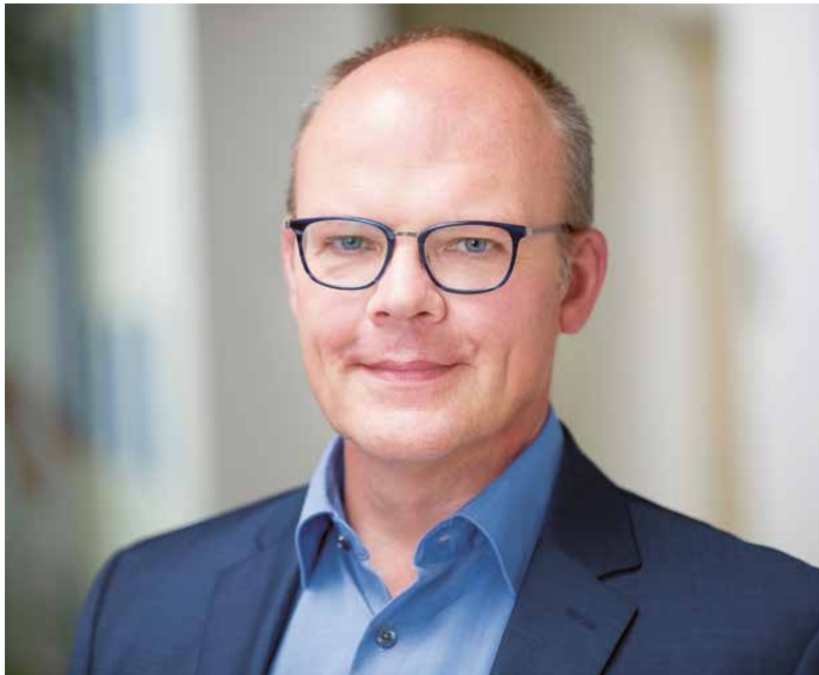
‘Veel mensen zijn engelen voor mij geweest’

Stek is ook een brug, dat zit al in onze naam: Stad En Kerk. We slaan bruggen tussen verschillende bevolkingsgroepen en tussen verschillende delen van de stad. Zo gaven we afgelopen weken in het kader van ons project School van Barmhartigheid les op het Sorghvliet Gymnasium over ongedocumenteerd-zijn. We hebben gesprekken gearrangeerd met ongedocumenteerden. Leerlingen lieten na die ontmoetingen blijken dat hun beeld veranderd was. Je brengt mensen met elkaar in aanraking en in dat persoonlijke contact wordt de ander van