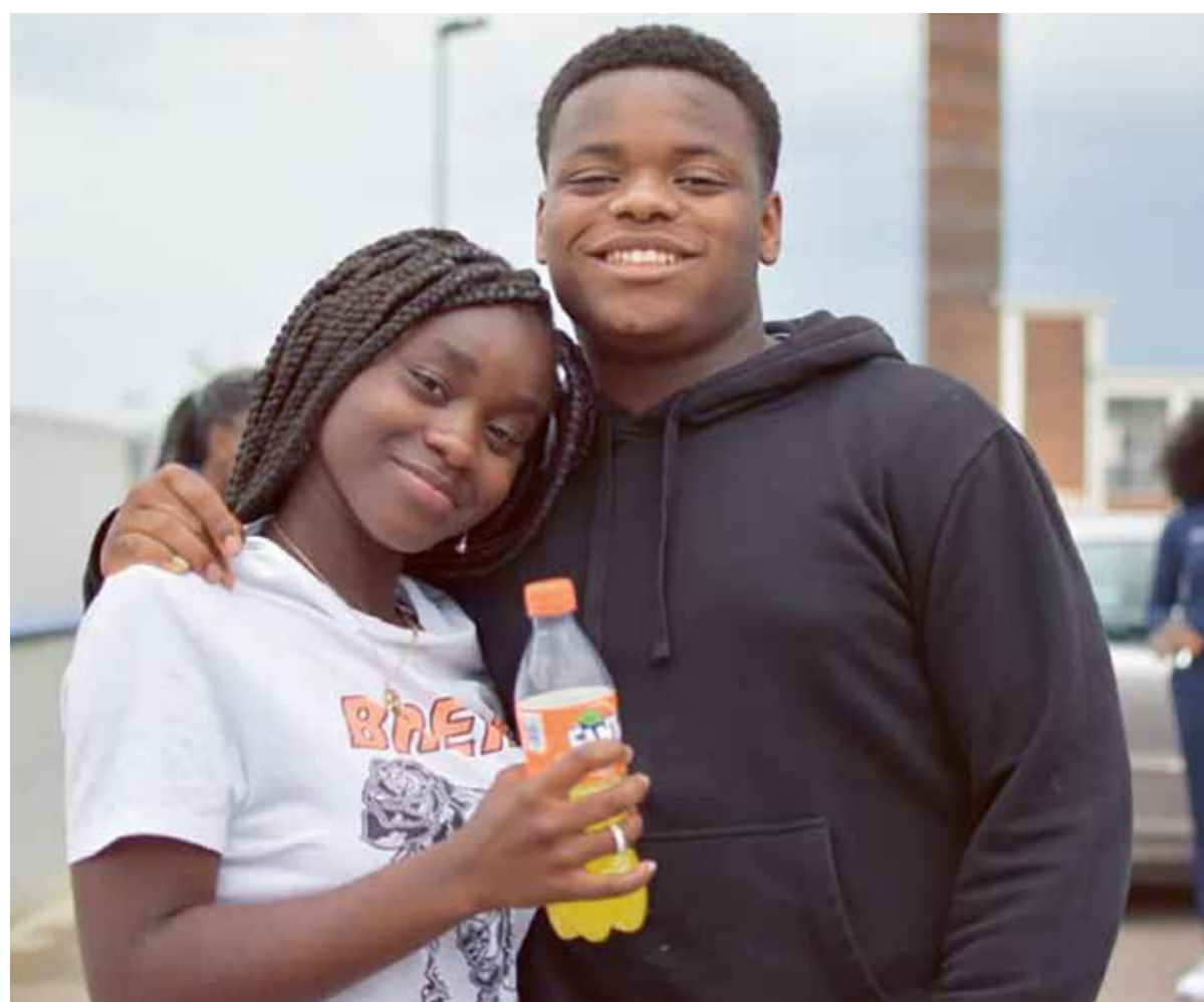
Nieuwe Hagenaars vinden in Shepherd's Place vrienden en een thuis.

REPORTAGE Een kerk die door expats bezocht wordt, geeft praktische tips voor in het dagelijks leven. Op vrijdagavond praten de jongeren over van alles, bijvoorbeeld over verliefdheid en sextortion – chantage met naaktbeelden.