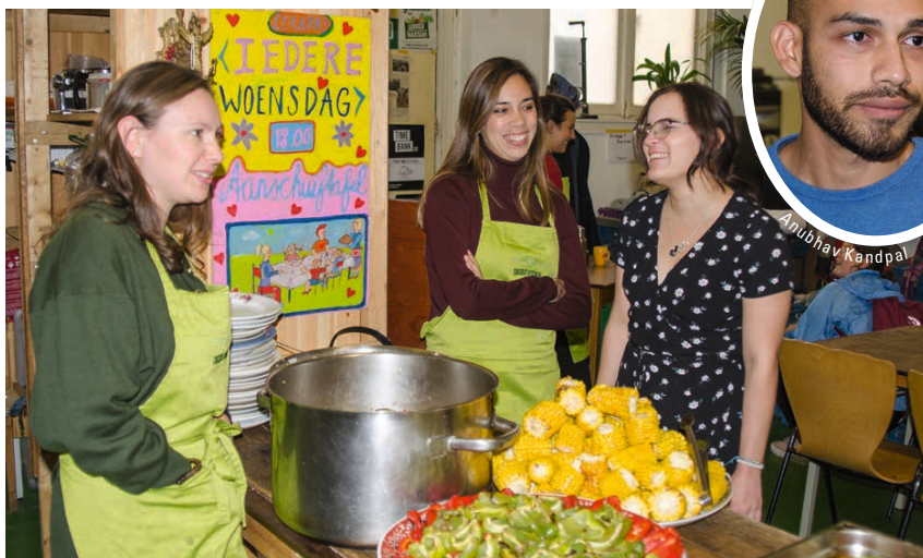
In de keuken krioelt het van de groene schorten.

OP DE MUUR HANGT EEN PLATTEGRONDJE met de opstelling van de tafels, zodat de vrijwilligers van Conscious Kitchen iedere donderdag weten hoe ze de eetzaal moeten inrichten. De eetzaal is een oud gymlokaal, de sportbelijning staat nog op de vloer. Het plattengrondje is tekenend voor dit bewuste voeding-initiatief: de boel is uitstekend georganiseerd, maar de invulling doet rebels alternatief aan. De tafels in deze vaste opstelling zijn er namelijk in alle soorten en maten, het is een gezellig samengeraapt geheel. Medewerkers van Conscious Kitchen gaan op donderdag naar de Haagse Markt, waar ze groente die anders wordt weggegooid gratis meekrijgen. Aan de hand van de buit wordt onder leiding van een professionele kok een driegangenu samengesteld. In een hoek van het gymlokaal is een keuken. Als ik er binnenkom, krioelt het er van de groene schorten.