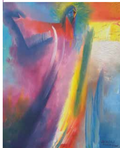
'The Glory of Christ, Easter Day 2008' van Stephen B. Whatley.

Voorafgaand aan Pasen zet de veertig dagen durende vastenperiode aan tot nadenken over lijden en doodgaan. Je kunt de dood misschien ver bij je vandaan willen houden, maar in Jezus' lijden en sterven word je er toch bij bepaald. Het Paasverhaal vertelt dat de dood niet het einde is: Jezus staat op uit de dood. Dat kan inspireren om in je eigen leven tot vernieuwing te komen. Deze editie bevat, naast een uitleg over de betekenis van Pasen, verhalen van mensen die in hun leven, werk, geloofsovertuiging en kerk nieuwe inspiratie hebben gevonden. Zie ook: kerkindenhaag.nl.