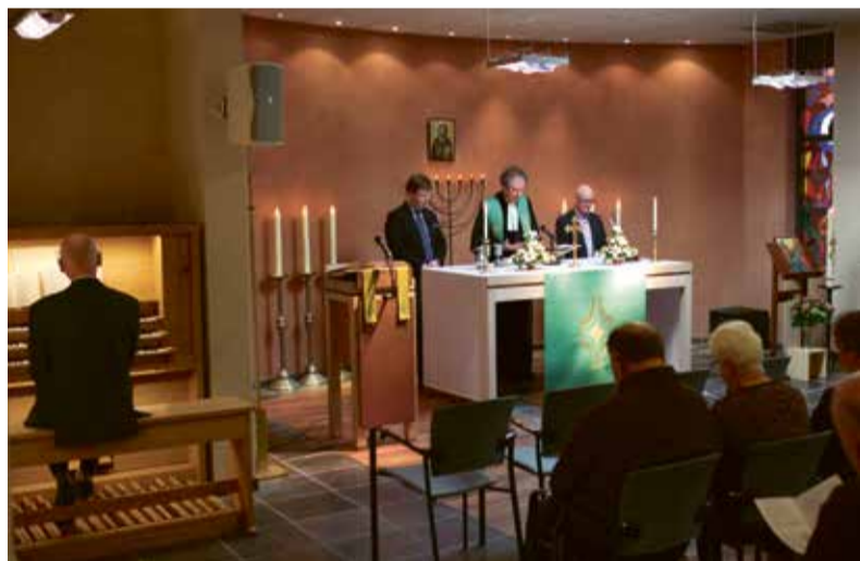
Viering van de Kruispuntgemeenschap.

REPORTAGE De doorstart van de Kruispuntgemeente is gerust wonderbaarlijk te noemen. Met tegenzin sloot de gemeente aan de Diamanthor in 2014 de deuren van de Kruispuntkerk, om vrijwel meteen de draad weer op te pakken op een nieuwe locatie. Met succes.