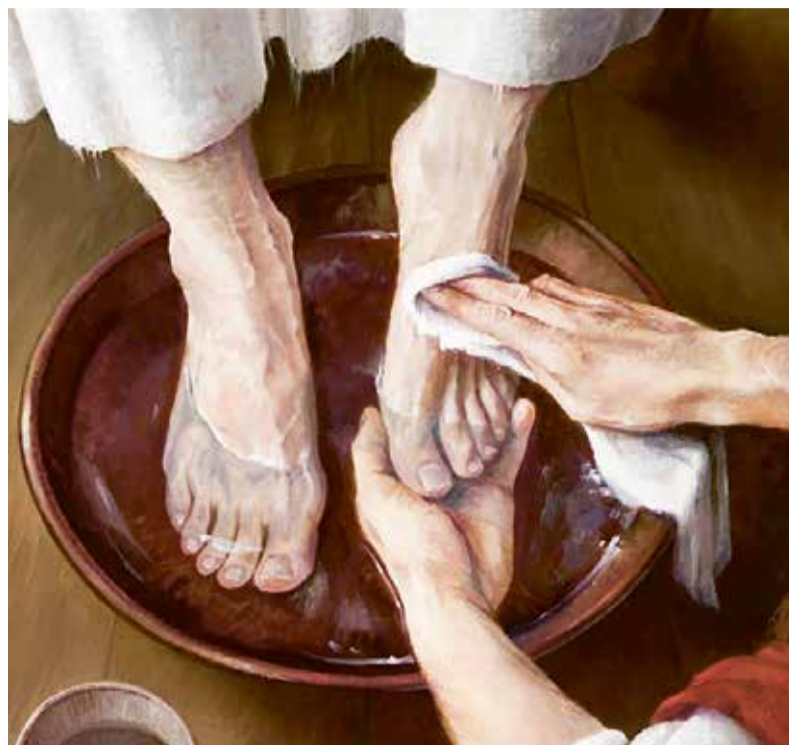
'Voetwassing' van Laurie Lisonbee. Een liefdesuiting op Witte Donderdag.

De naam van deze dag verwijst naar de traditie in sommige kerken om kruisen en andere beelden met een wit kleed te bedekken. Witte Donderdag is een