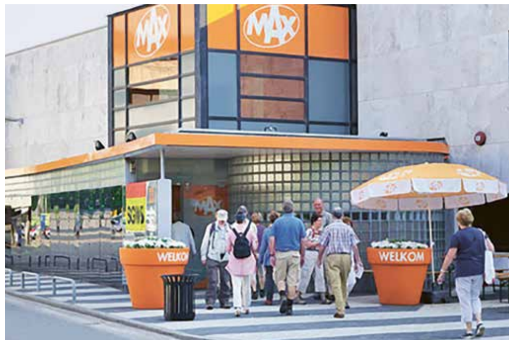
Drukke gang naar de 'Max-kerk'.

Als senior hikte ik er lang tegenaan naar de sport-schoon te gaan. Fitness samen met die fanatieke gezondheidsmaniakken en getatoeëerde kleerkasten? Tot ik een advertentie zag waarin 55+ mannen uitgedaagd werden om twee maanden