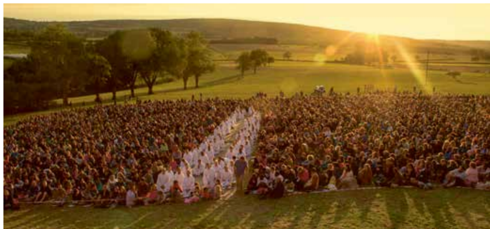
Mediteren in Taizé, waar meerdere (jongeren)groepen uit Den Haag ieder jaar aan meedoen.

A XEL WICKE: 'VELEN WETEN HET NIET, maar er bestaat een ander soort christendom naast wat je op zondagochtend in de kerkelijke erediensten tegenkomt. In een gebruikelijke eredienst luister je samen naar een preek die je (vooral) intellectueel, rationeel, met woorden en gedachten, wil inspireren. Inmiddels ben ik met overgave onderdeel en tegenwoordiger van dit kerkelijke christendom.'