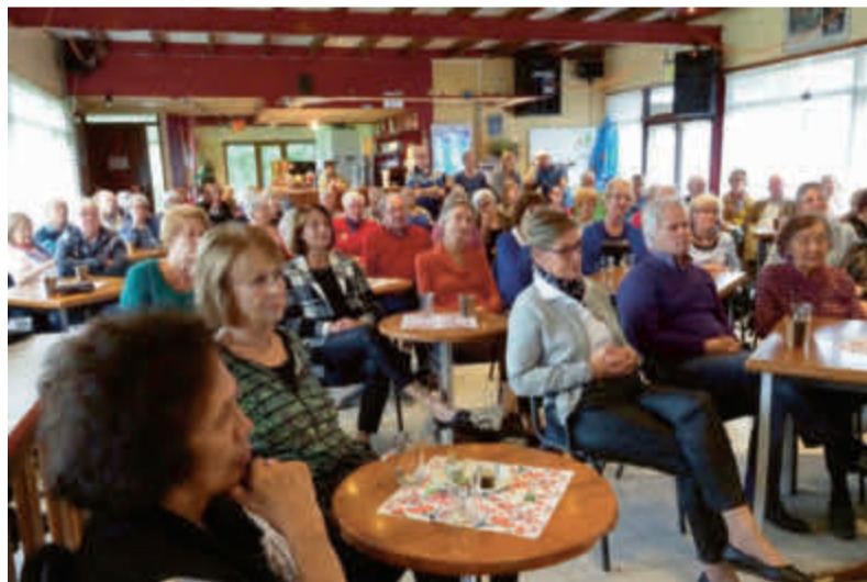
In 'Amadeus' is het gezellig druk, vaak van vroeg tot laat.

REPORTAGE Het nieuwe buurtcentrum Amadeus in een aanbouw van de oude Bethelkerk voorziet nu al in een behoefte. Bewoners hebben de 'huiskamer voor de wijk' gevonden, om er te eten, dansen, kaarten of te kletsen. Het succes verrast zelfs de initiatiefnemers.