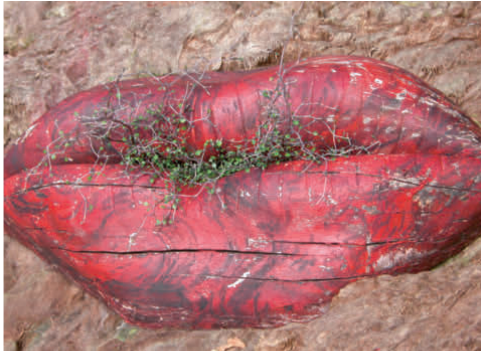
‘Iets minder mening kan geen kwaad’.

Ik herken in haar woorden iets van een oproep. Het hoeft niet altijd, een mening hebben. Je kunt ook eens passen in het gesprek over voors en tegens, over wat wel moet of niet hoort. Toch is dat niet zo eenvoudig. Door de veelheid aan meningen die je tegenkomt op Twitter, Facebook, in columns en opiniepagina's, aan de borreltafel van elke Late Night Show, ligt de vraag al gauw voor