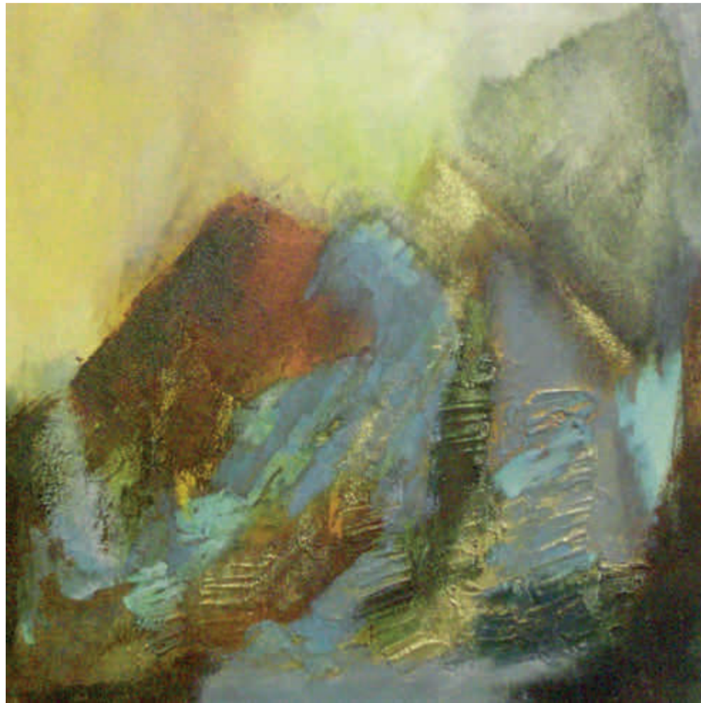
De vogel (Phoenix) rijst op uit eigen as. Schilderij van Marjolijn Esser.

Een wettelijk anker heeft het kerkasiel dus mogelijk gemaakt. Voorspelling: het wachten is op een politieke partij die deze bevoordeling van kerkelijke gebruiken ter discussie stelt. Dat is eerder met meer of minder succes gebeurd met andere restanten van traditionele publieke bescherming voor godsdienstige uitingen (zon-