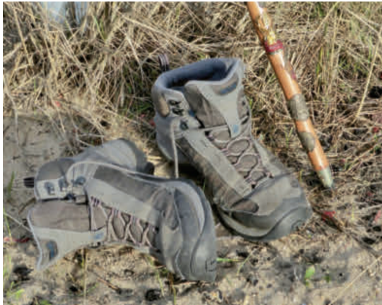
Wie gaat mee op stap in de vastentijd?

er voor het eerst een uitnodiging naar de protestantse kerken gegaan om aan de wandelingen deel te nemen. De wandelingen starten zes woensdagen lang 's ochtends om 9.30 uur, steeds bij een andere kerk, en duren ongeveer een uur. Iedere keer loopt een ander lid van het pastoraal team van de parochie mee. Na de wandeling is er een spiritueel moment ter afronding –