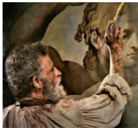
Michelangelo schildert zijn geliefde Tommaso.