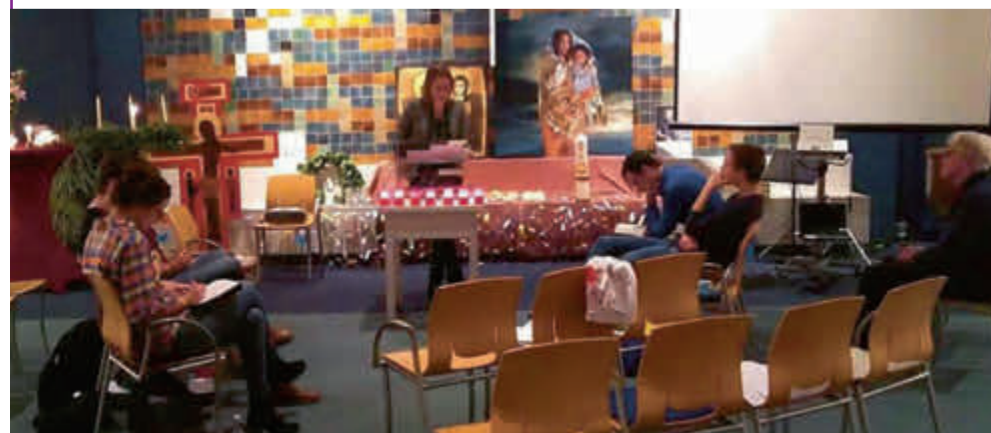
Kerkasiel in buurt-en-kerkhuis Bethel.