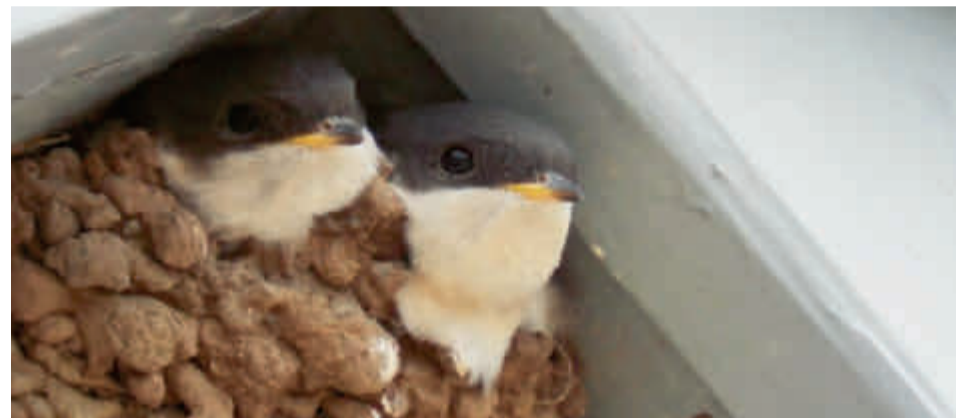
'HouseMartin' betekent huiszwaluw. De vogel broedt vaak in menselijke bouwwerken en leeft in groepen.

Er kan bij daklozen een onderscheid gemaakt tussen personen met een opstapeling van problemen en zij die dat niet hebben. Voor de eerste groep zijn er instanties die zorg verlenen, zoals de Kessler Stichting, het Leger des Heils of Parnassia. Voor personen uit de tweede groep is, wanneer ze ziek zijn, in Den Haag geen voorziening. Met ThuisHuis HouseMartin willen we daar verandering in brengen.