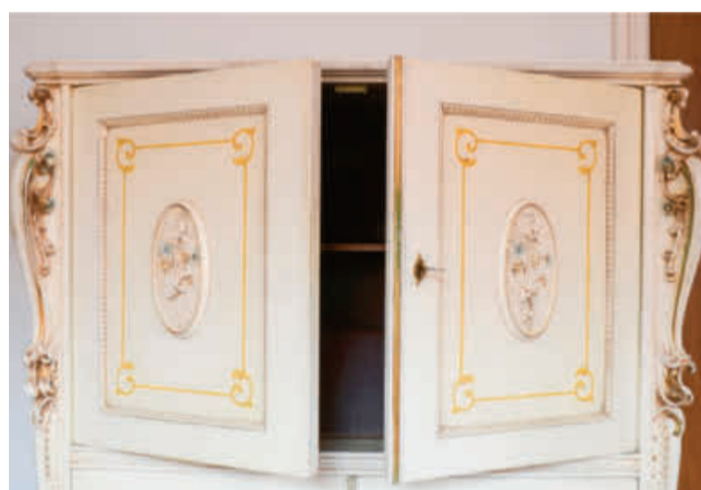
Uit de kast?

Tot 2012 organiseerde ik in de Bethelkappel Open Kerk en daar werd ik regel-