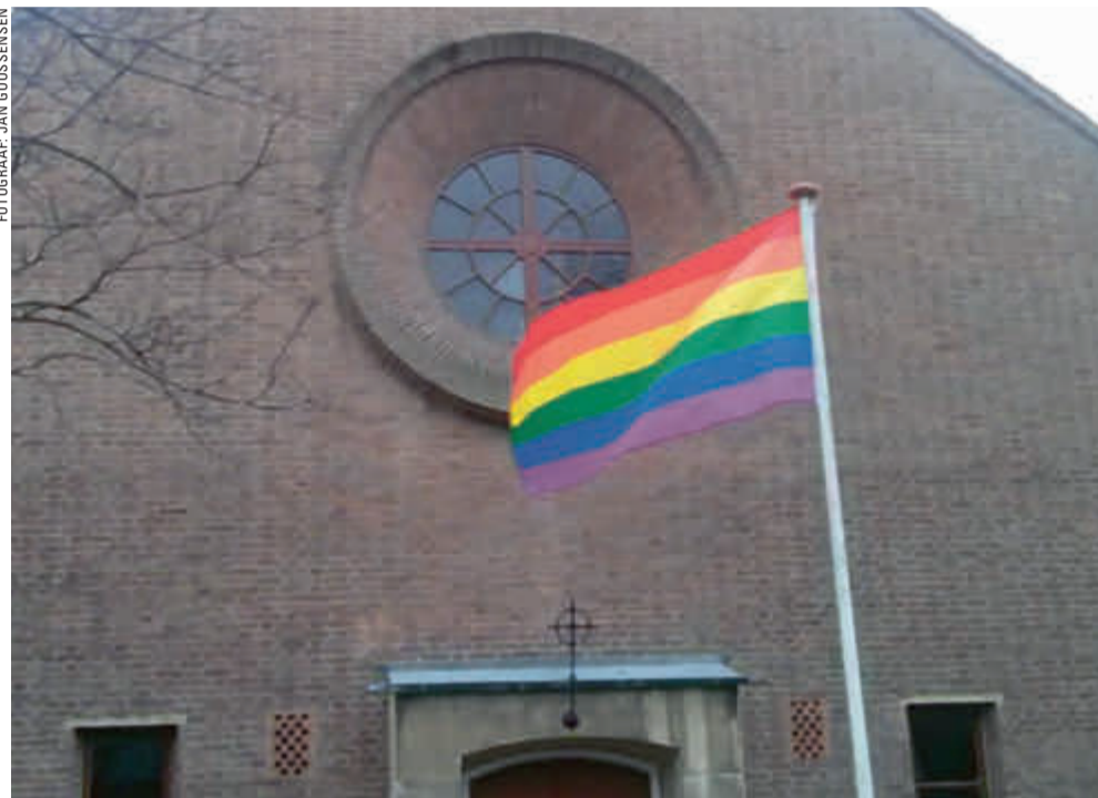
Meerdere Haagse kerken, waaronder de Maranathakerk, hebben de regenboogvlag gehesen.

K om lekker bij ons liggen in het alfabetje. De kleren kunnen uit, wat let je. Voor iedereen die L, H, B, T, I of wat dan ook is, het bed is warm en groot, en wat nog meer is, we kijken niet naar afkomst, kleur of stand, het bed moet vol, tot aan de rand.