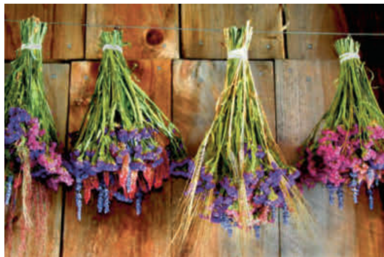
In de bloei van het leven maar levenloos: depressiviteit vraagt om aandacht.

REPORTAGE Gelovigen die worstelen met zichzelf, kunnen zich in hun kerk eenzaam en verlaten voelen. Op een avond voor leden van buitenlandse kerken werd dit probleem besproken. 'We moeten kwetsbaarheid erkennen.'