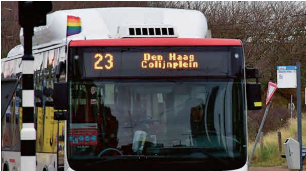
Aan de bus wappert de regenboogvlag.

ACHTERGROND De Nashville-verklaring doet denken aan een eerdere onbesuisde Amerikaanse actie, veertig jaar geleden. Die gaf de kerkelijke homo-emancipatiebeweging in Nederland een onstuimige start. Gaat het met 'Nashville' dezelfde kant op? De nationale deugden zijn nu in het geding.