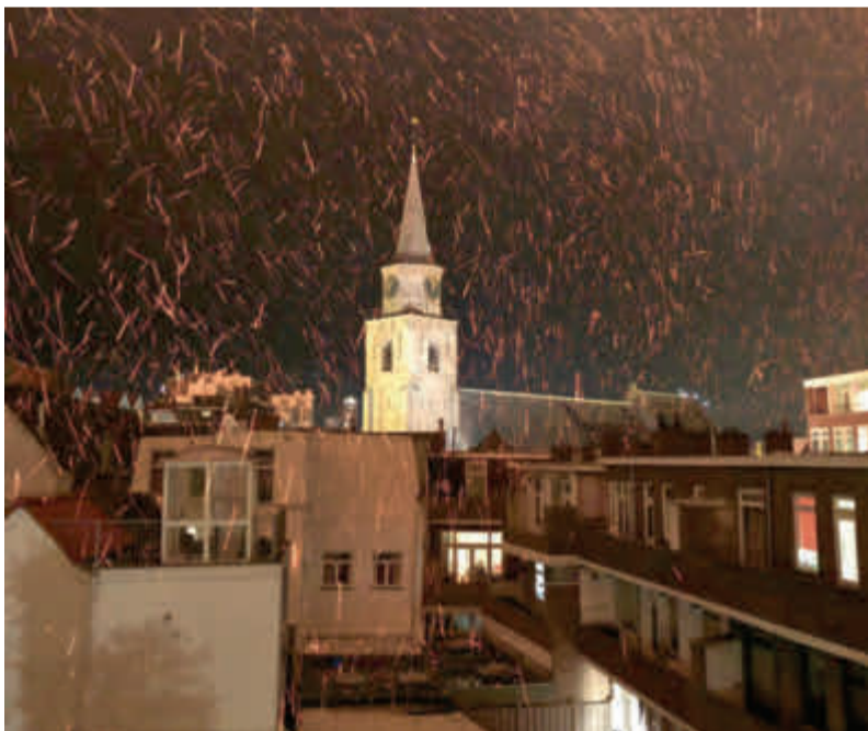
Vuurregen aan de achterkant van Greet Kappers' woning.