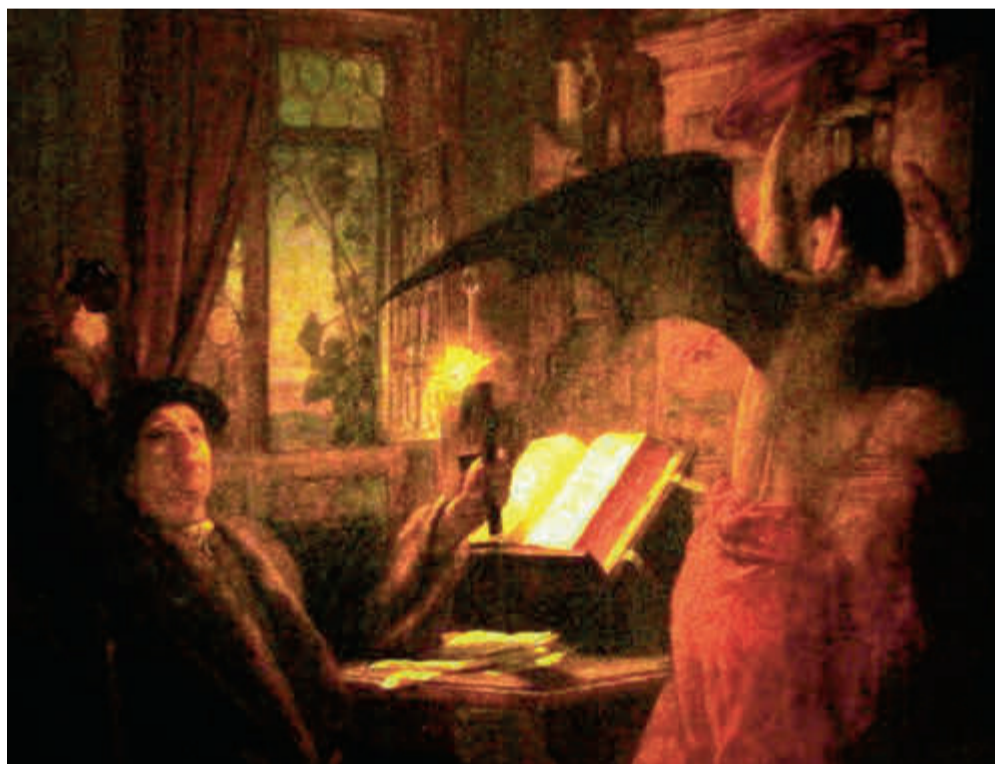
Luther zou de duivel met inkt verjaagd hebben.

ACHTERGROND Hoe gaat de protestantse kerk om met mensen die zich door kwade machten gekweld of 'bezeten' voelen? Over bevrijdingspastoraat is een handreiking geschreven. 'Verlos ons van het kwaad.'