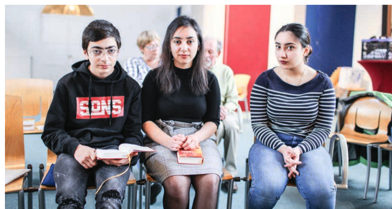
De kinderen van het gezin Tamrazyan.

Karl van Klaveren, predikant van de Houtrustkerk, is deze weken ook regel-