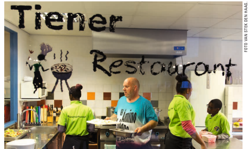
Kokkerellen in het tienerrestaurant van de Kinderwinkel.

Twee betaalde krachten en ruim veertig vrijwilligers draaien mee. Sommigen nog van het eerste uur, vanuit de Marcuskerk. Verder een mix van jong en oud, vaders en moeders uit heel Den