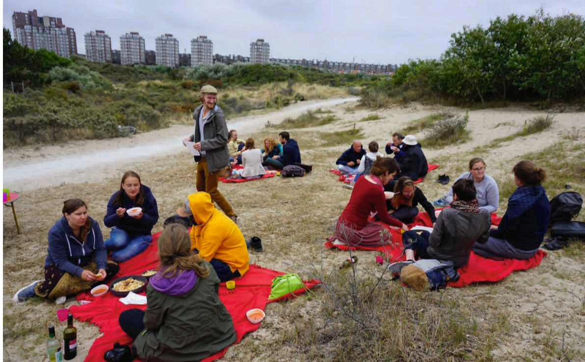
Tafel van de Hoop in de Scheveningse duinen.