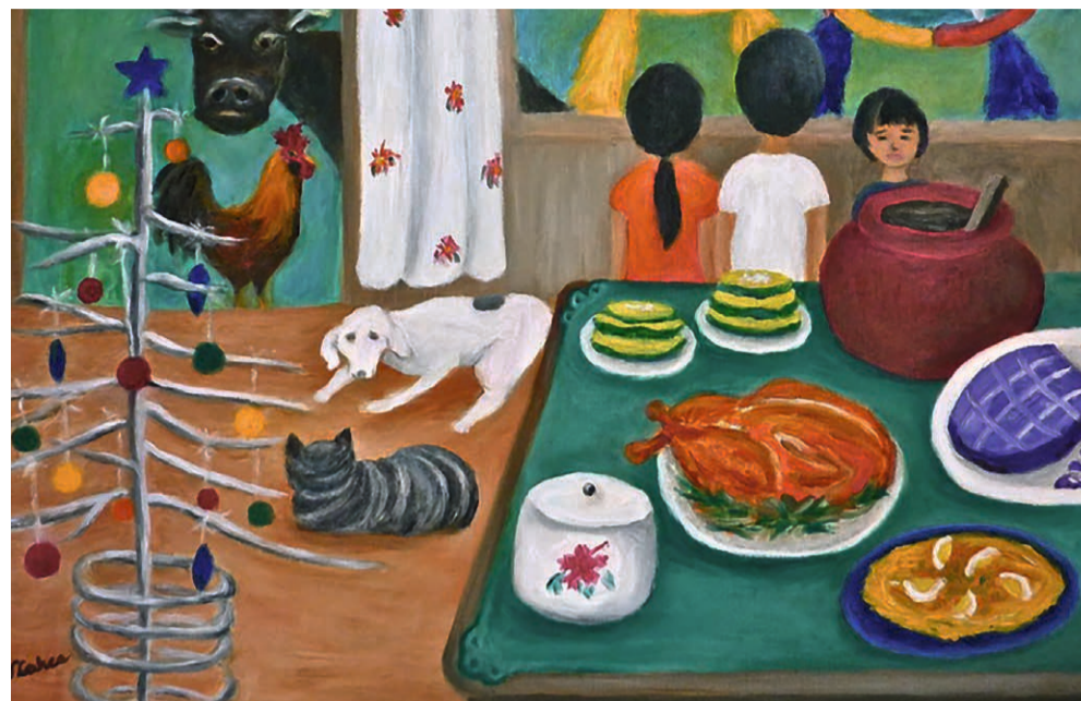
Buenanoche op de Filippijnen.

REPORTAGE Hoe vier je Kerst als je ver van je geboorteland woont? In drie portretjes vertellen een Filippijnse, een Chinees en een Ghanees erover. In Den Haag zetten ze hun eigen traditie rond Kerst voort. De grootste gemene deler is: ‘samen’.