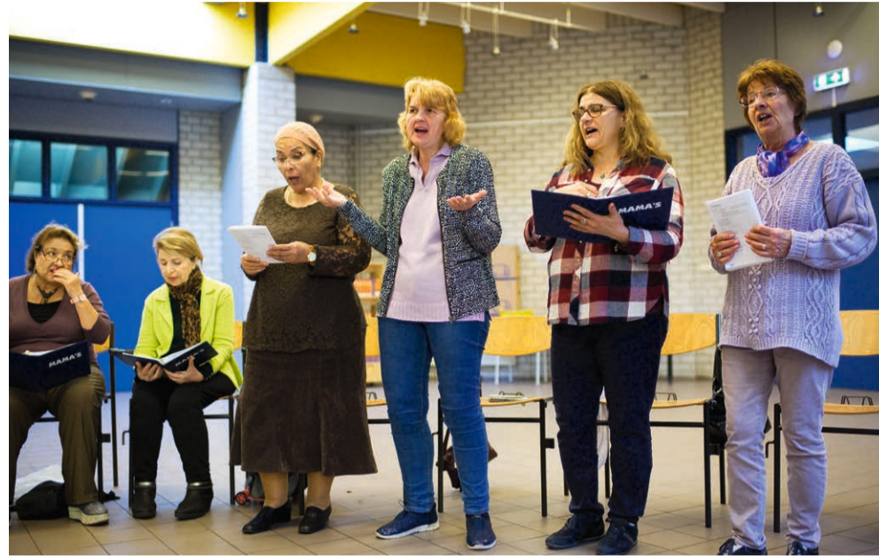
'Er is geen gêne' bij het Mama Verhalen Koor.

REPORTAGE Al tien jaar maakt het Mama Verhalen Koor uit het leven gegrepen liedjes over de eigen ervaringen van de leden: vrouwen uit alle lagen van de Haagse samenleving. 'Ze zingen hun eigen levenslied.'