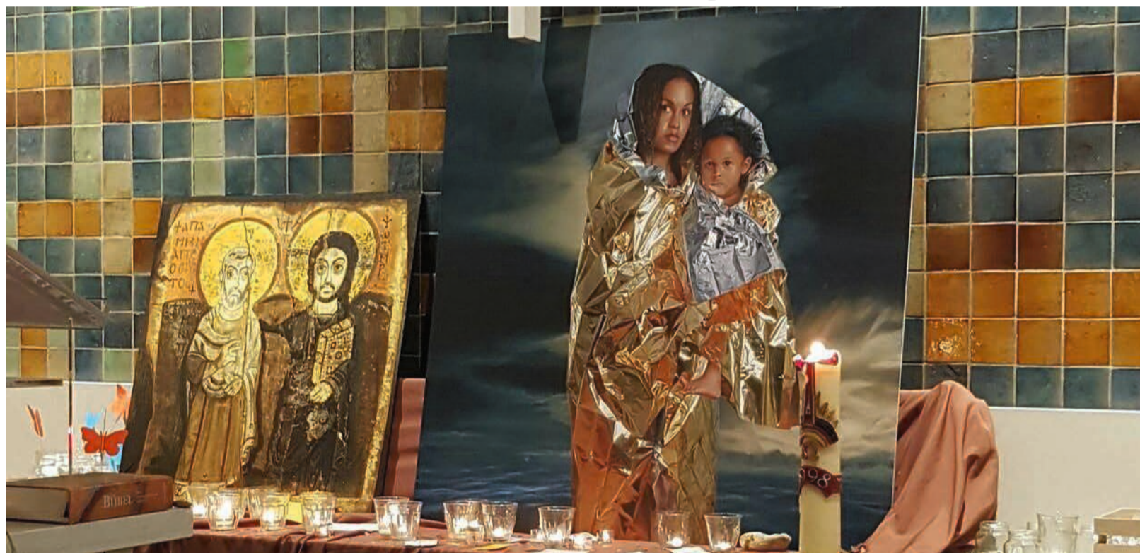
De Haagse Parochie Noord schonk aan kerkhuis Bethel de moderne icoon 'Madonna del Mare Nostrum'.

REPORTAGE Is er ook goed nieuws te ontdekken in het vraagstuk rond de vierhonderd uitgeprocedeerde kinderen die Nederland zouden moeten verlaten? Dat het Haagse kerkhuis Bethel kerkasiel verleent aan een Armeens gezin, roept veel op. Ook nieuw elan.