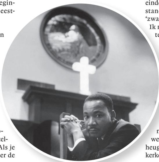
Dexter Avenue Baptist Church. M.L. King schreef hier beroemde speeches.