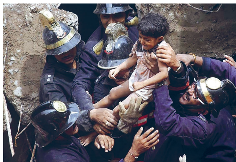
Kostbare bevrijding van een gedwongen werker uit een goudmijn.

SYMPOSIUM: MAANDAG 25 MEI, 13:30 UUR. DOOPSGEZINDE KERK. ORG. HVI. VIERING OVER DE AFSCHAFFING VAN SLAVERNIJ: ZONDAG 1 JULI, 19 UUR. EMMAUSKERK. ORG. HGK.