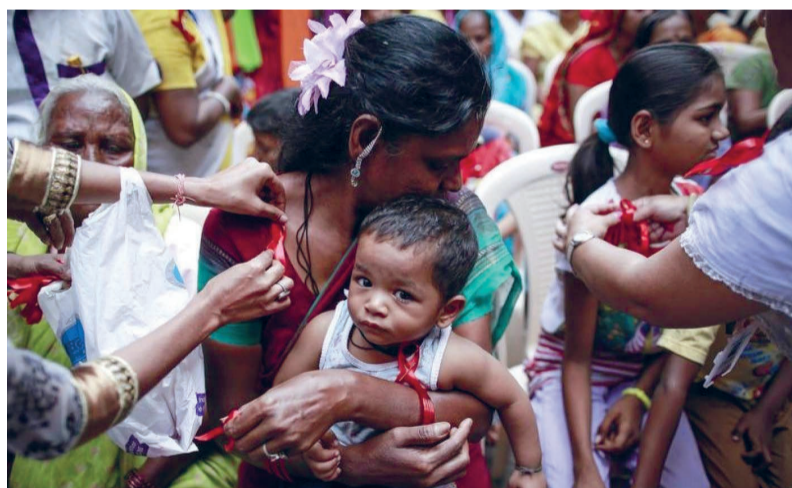
Markt waar Angolezen gewaarmerkt en verhandeld worden voor smokkel en handel in Europa.

REPORTAGE Slachtoffers van allerlei soorten van uitbuiting kunnen een maatje krijgen via de protestantse kerkenorganisatie Stek. Zo iemand staat hen bij om uit hun sociale isolement te komen. De maatjes zijn er ook voor wie met huiselijk geweld te maken had.