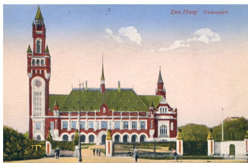
Vredespaleis. Ansichtkaart uit 1930.

De Haagse Gemeenschap van Kerken (HGK) is op dit moment bezig met een visiedocument, dat de moderne slavernij onder de aandacht wil brengen van de gemeentepolitiek. Juist in een stad die zich profileert als internationale stad van vrede en recht horen dergelijke praktijken niet thuis, zo stelt de HGK. Ook wijst de Haagse kerkengemeenschap op het feit dat het slavernijverleden nog steeds doorwerkt bij een deel