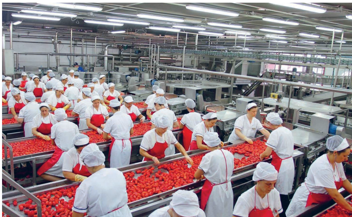
Vol ijver 'overleven' Oost-Europeanen in de tomatenindustrie. Deze arbeiders zijn beter af.

Na drie weken viel ik van ellende op de werkvloer in elkaar. Een collega snelde naar mijn werkgever, die hem erop wees dat een bezoek aan de dokter mij € 250 zou kosten. De werkgever zou gezegd hebben: "Ze is toch geen kapot apparaat dat niet meer aan de praat te krijgen is?" Per direct nam ik ontslag en vertrok ik naar Polen. Daarmee hoefde de werkgever niet op vragen van een kritische arts te rekenen. Ieder jaar verschijnen bedrijven en uitzendbureaus immers voor de rechter omdat ze neppe contracten laten ondertekenen of simpelweg niet uitbetalen. Zo is het dit bedrijf ook vergaan. Volgens vakbond FNV zijn er misstanden in de bouw, distributiecentra, scheepsbouw, transport en de vleesverwerking. In de twee laatstgenoemde is uitbuiting van Oost-Europese