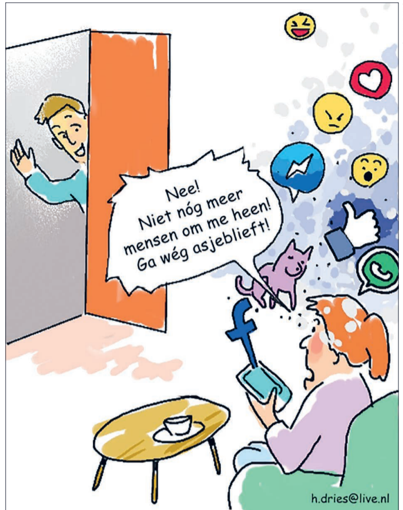
TEKENING ERIK DRIES

Ik scrolde eens door de afgelopen facebookdagen heen. Wat of wie zou ik missen? Tja, ik zou niet meer weten hoe de levens van oud-collega's en oud-studiegenoten verlopen. Maar er zijn