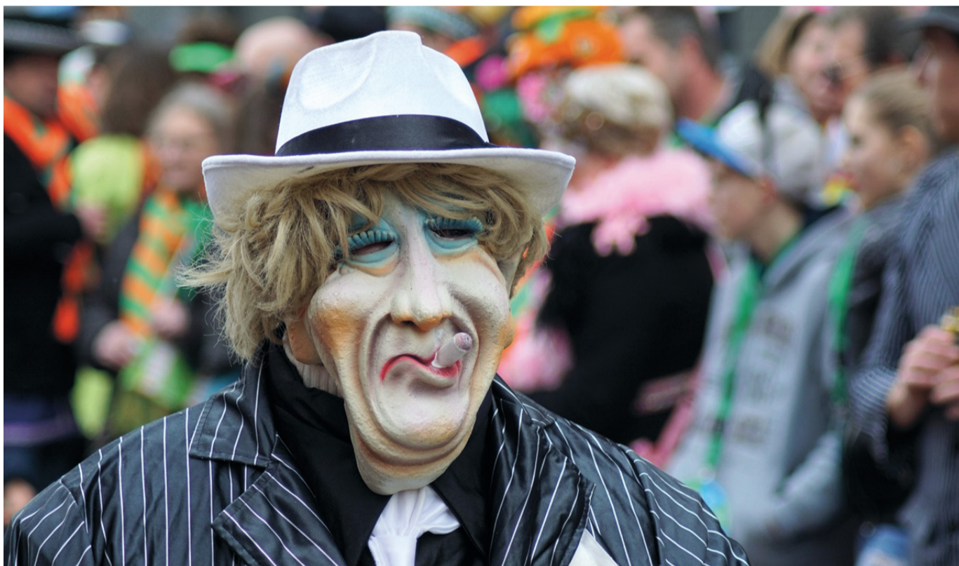
Masker tijdens carnaval, Kruikenstad.