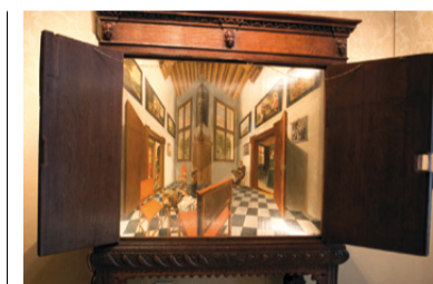
Zeventiende-eeuwse perspectieffkast. Museum Bredius.