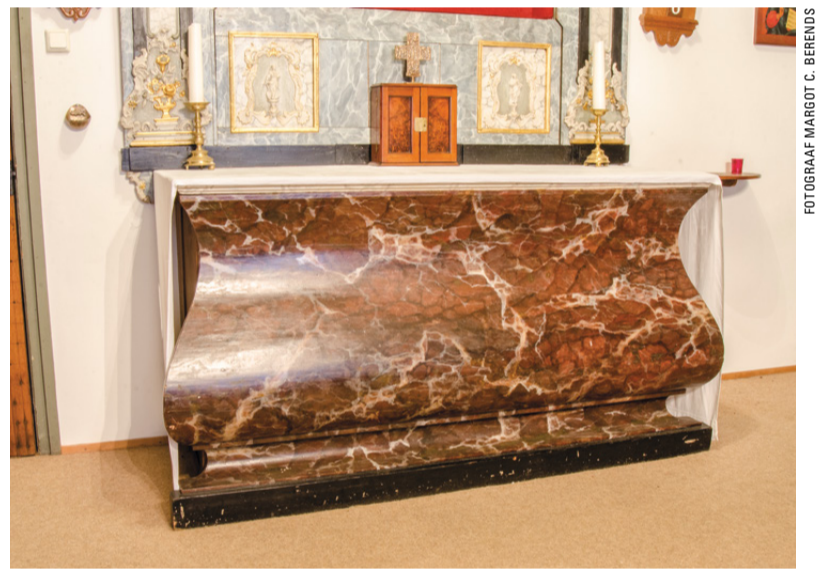
Nep-marmeren altaar in de zolderkapel van de oud-katholieke kerk.