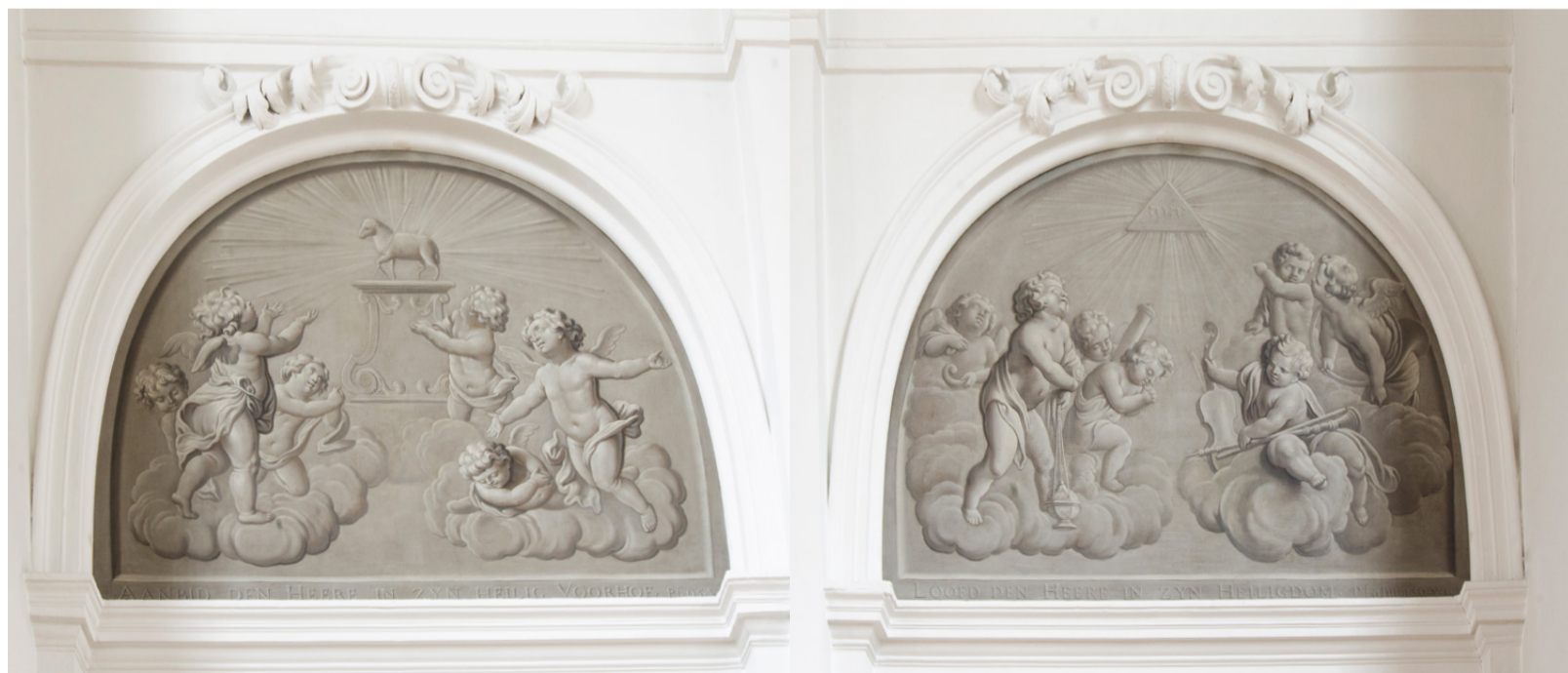
Witjes boven de deuren van de kerkzaal van de oud-katholieke kerk.

De eerste vier pagina's van dit Kerk in Den Haag -nummer laten zien dat je niet altijd ziet wat je ziet.