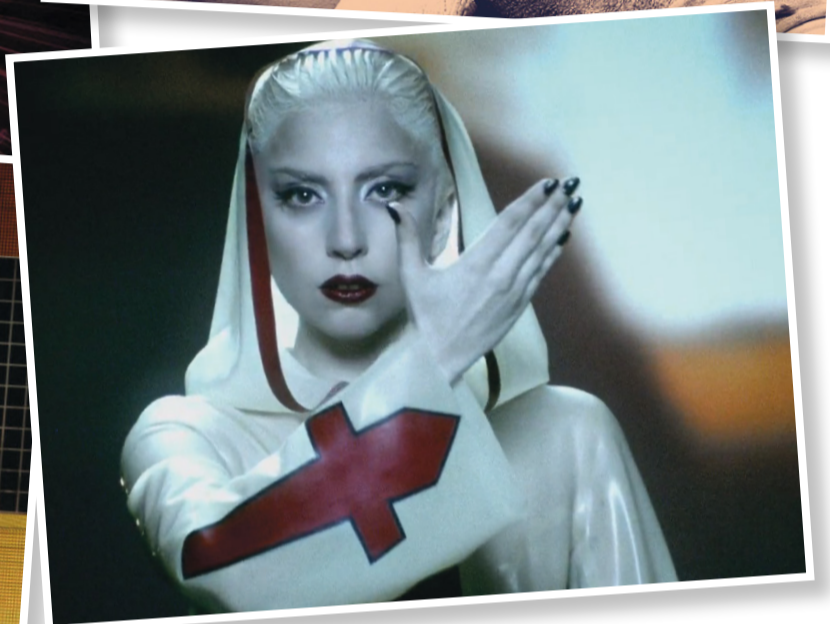
De zangers Madonna, JeBroer en Lady Gaga confronteren hun publiek met christelijke symboliek.

'Natuurlijk ook wel om te shockeren, maar waarschijnlijk vooral omdat de symbolen zo sterk en veelzeggend zijn. Het is met de videoclips net als bij speelfilms als Star Wars , waarin we ook christelijke thema's zien. Ze zijn een belangrijk onderdeel van onze samenleving en traditie.'