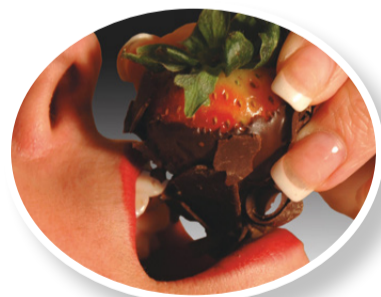
Goed voor vasten: je buik laten knorren.

luxue leven of onnodig afzien maar geneoegen nemen met wat er is. Het boeddhisme kent geen strikte regels. Wel zijn er richtlijnen voor een zo ethisch mogelijk leven, een soort 'trainingsregels' om (jezelf) dagelijks te onderzoeken en oefenen. Die geven mij houvast. De Boeddha zag dat ons lijden of