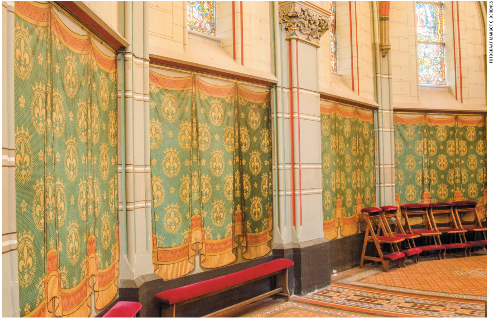
'Gordijn' en pilasters met 'steenblokken' in de Elandstraatkerk.