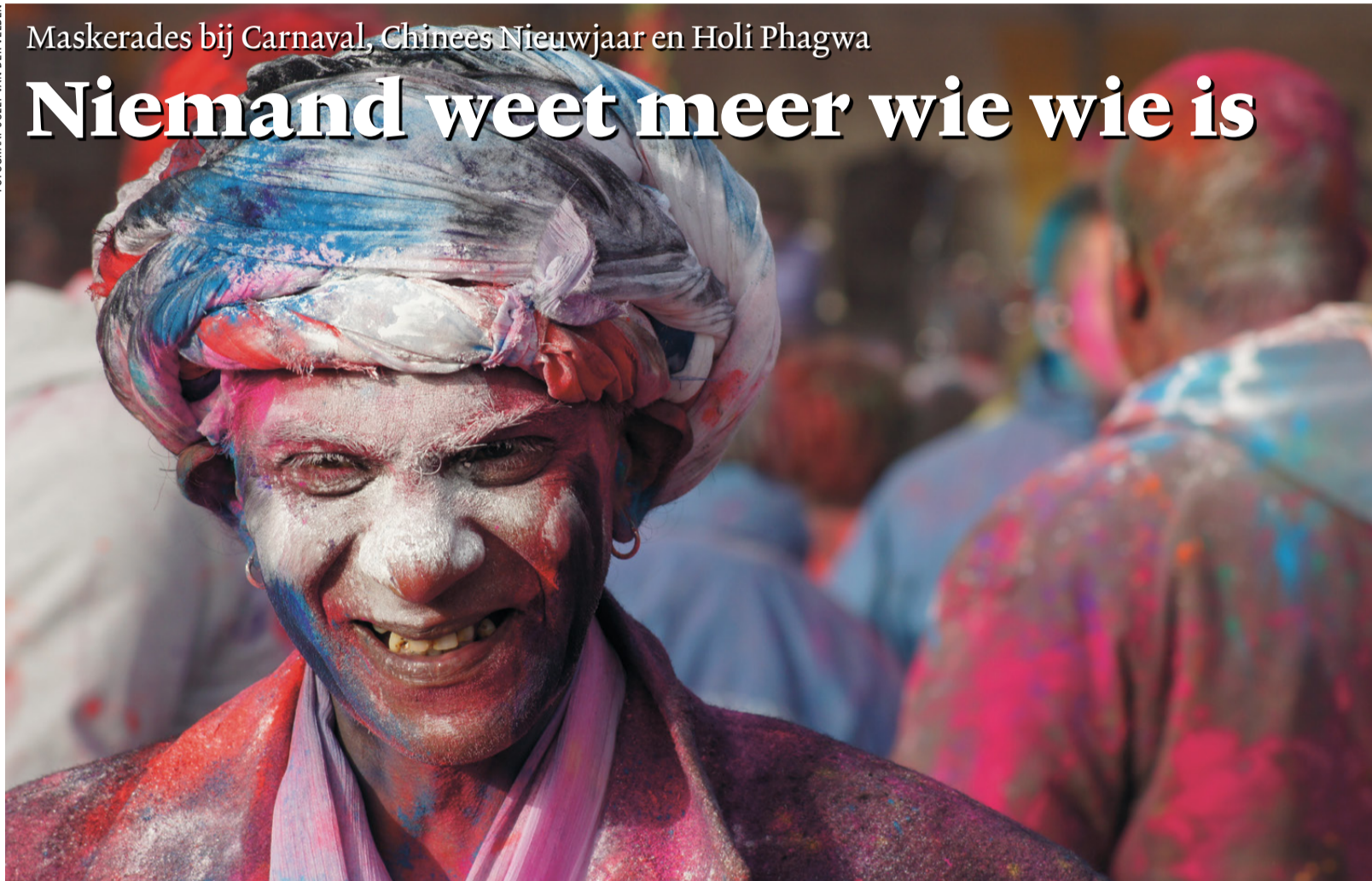
Bezoeker van het lentefeest Holi Phagwa in Den Haag.

ACHTERGROND Hageenaars zijn niet zulke carnavalsvierders. Maar half februari dansen er wel draken en leeuwen door de Haagse straten, bij het Chinese Nieuwjaarsfeest. En op 1 maart zien we hoe hindoeïsten er gekleurd op staan tijdens het lentefeest Holi Phagwa.