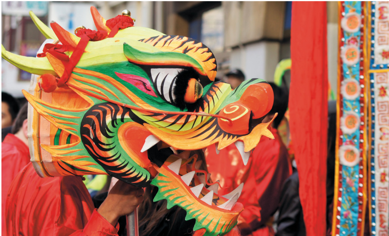
Chinees Nieuwjaar in Den Haag.