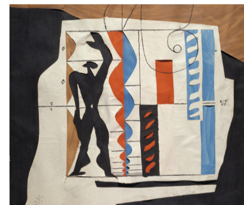
De Modulor van Le Corbusier.

Van Eyck heeft zich ongetwijfeld laten leiden door Le Corbusier (1887-1965). Deze Franse archi-