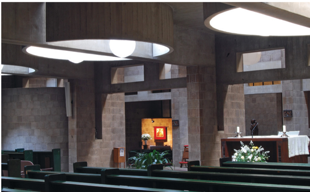
De Pastoor van Arskerk.