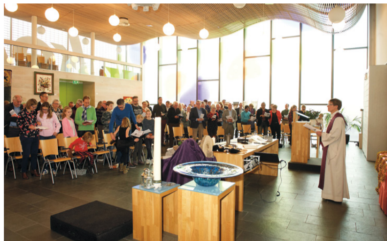
De Toevlucht bestaat dit jaar tien jaar.

Vanavond zijn zo'n 25 bezoekers naar De Toevlucht gekomen voor een gesprek over de toekomst van de kerk. In de kerkzaal brandt de paaskaars. Sake