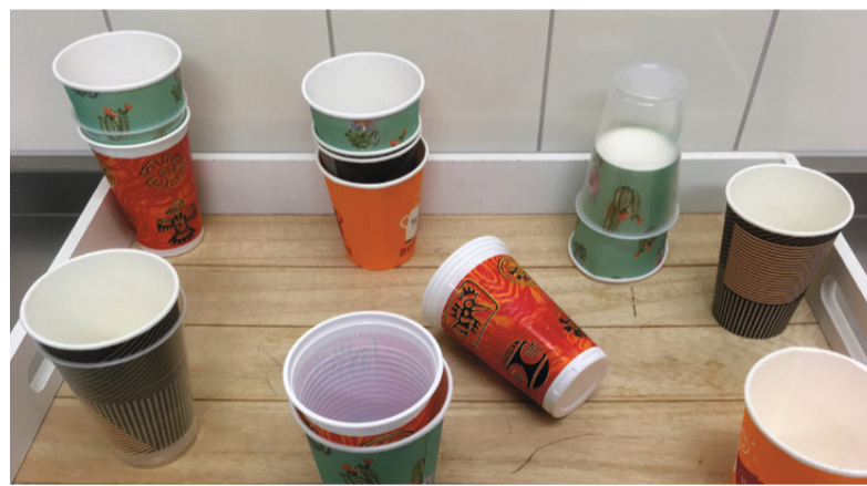
Een bonte verzameling (plastic) bekertjes. Voor koffie en thee.