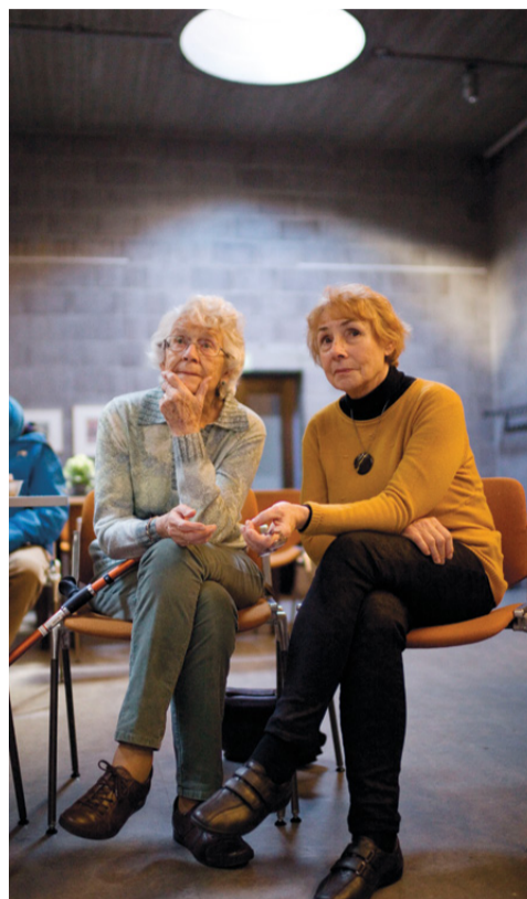
Een van de bezoekers kwam vandaag voor het eerst weer buiten.

Inderdaad hebben de verwickelingen in het doldwaze spektakel weinig raakvlakken met het dagelijks leven van de meeste aanwezigen. De dame die na de film zegt 'en ze leefden nog lang en gelukkig, haha', heeft zeven kilometer gelopen vanuit haar woonplaats Rijswijk. Vanaf de Leyweg nam ze bus 23, de lijn die het langste traject