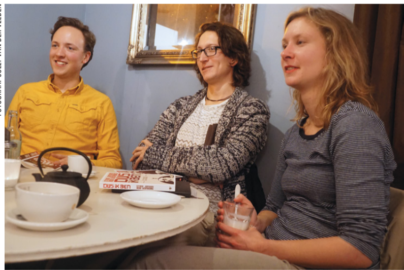
Hardop nadenken over: wat of wie maakt wie we zijn?

REPORTAGE Leesclub 'Leeszin' las het boek Dus ik ben en praatte een avond lang over 'identiteit' . De jongeren hebben elkaar gevonden dankzij het zinzoekersproject van Stek. Vier stellingen kwamen langs: ik voel, ik werk, ik heb lief, ik consumeer, dus ik ben.