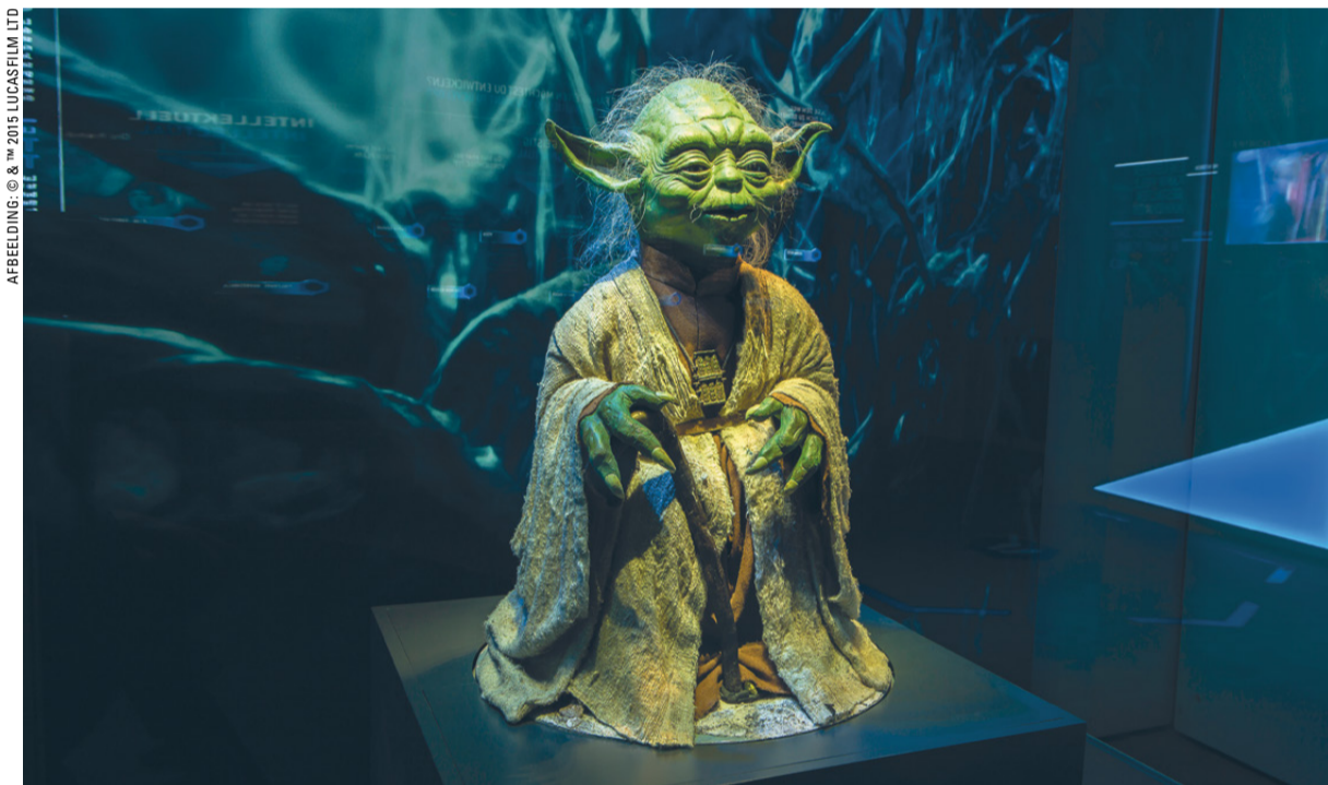
Leermeester Yoda, 'een soort profeet'. Expositie Utrecht.

ACHTERGROND Er is een nieuwe Star Wars-film uit. De films horen langzamerhand tot de 'grote verhaal'-verhalen. Daarin gaat het over goed en kwaad en andere religieuze oer-thema's. 'May the Force be with you', zo klinkt de Star Wars-zegenwens. Een fan vertelt over zijn fascinatie.