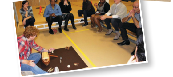
Bezoekers van de Kliederkerk kunnen met hun creativiteit alle kanten op.