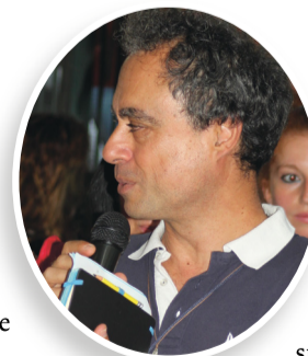
Pastoor uit Portici.