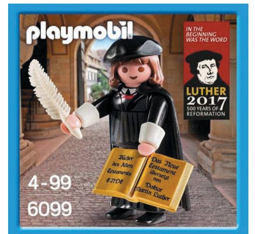
Luther is het meest verkochte Playmobil-poppetje ooit.

Over zulke mensen raasde nu een mediastorm heen. Plotseling deden koortsige verhalen de ronde, over wat écht, letterlijk, in de volkstaal in de Bijbel stond. Om de haverklap werden op de pleinen en markten pamfletten voorgelezen, zowel over omwentelingen in kerk en politiek elders als ook over veranderingen in de theologie. Ineens hingen brutale, oneerbiedige en soms ronduit kwetsende spotprenten over kerkelijke leiders aan de muren en vlogen gedrukte plaatjes over uitspattingen in Rome, bijbelverhalen en het hiernamaals van hand tot hand. Binnen korte tijd veranderden ook de diensten op zondag: ze waren voor gewone mensen te verstaan en die maakten via de nieuwe gemeentezang – het nieuwe medium ‘kerk lied’ – er deel van uit. Ook zin-