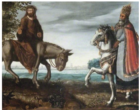
Spotprent. De koninklijke pracht en praal van de paus op een paard vloekt met Jezus' sombere nederigheid op een ezel. Museum Catharijneconvent.

VOORDRACHT MET BEELDEN OVER SPOTPRENTEN VAN DE REFORMATIE, WOENSDAG 22 NOVEMBER, 14.30 UUR, MARANATHAKERK.