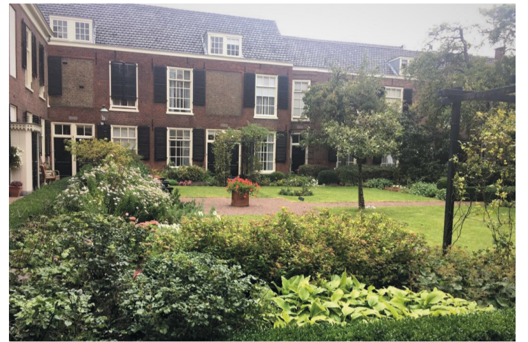
Rusthof, stille getuige van de Reformatie.

REPORTAGE Vrijwilligersorganisatie Het Gilde heeft met de Houtrustkerk een 'onthullende' wandeling uitgezet door het centrum, in het spoor van Martin Luther. De gids voert je langs vergeten hofjes, verstopte muren en laat je in de Grote Kerk een geuzenlied zingen.