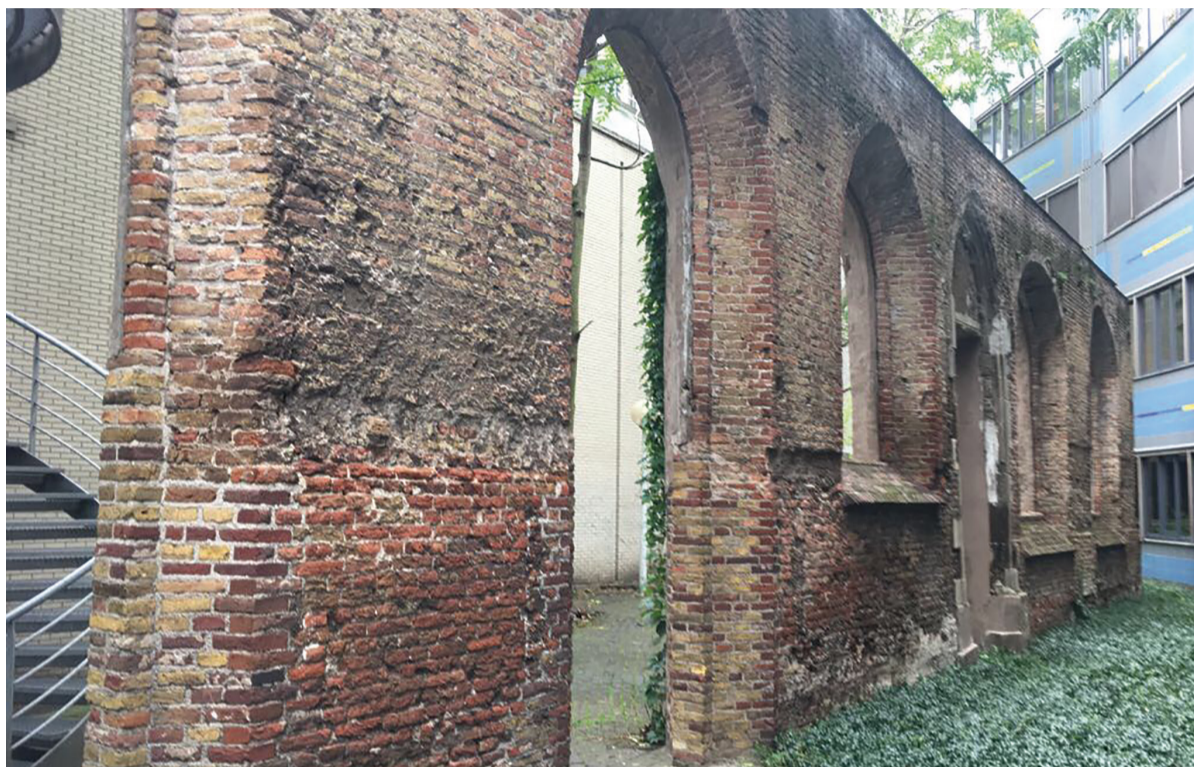
Deze ruïnewaand achter de Kloosterkerk herinnert aan het voormalige klooster, dat in de reformatietijd werd afgebroken.

Helden moeten inderdaad ver boven het maaiveld uitsteken. Op zijn tocht door Holland had Gabriël in juli 1566 op een stuk land in Overveen een hagepreek gehouden, 'vier uren lang in eene zeer hete middagzon'. Daarna ging de tocht naar Delft en Den Haag. Posthumus memoreert dat sedert 1517, toen de Reformatie in Duitsland ontvlamde, ook in Holland al snel de eerste tekenen van een nieuwe tijd zich aan-