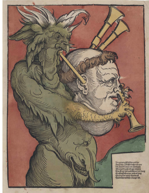
De rooms-katholieke kerk bespottte de Reformatie: satan speelt op Luther in de vorm van een doedelzak.

Aan de buitenkant raasde een ongekende mediarevolutie door Europa die voor de verspreiding van de Reformatie zorgde. Dat Luther op 31 oktober 1517 zijn 95 stellingen in Wittenberg aan een kerkdeur heeft gespijkerd, was niemand te weten gekomen, als die stellingen niet dezelfde