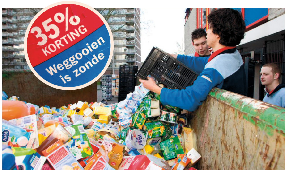
'Weggoien is zonde': toegepaste theologie bij Albert Heijn