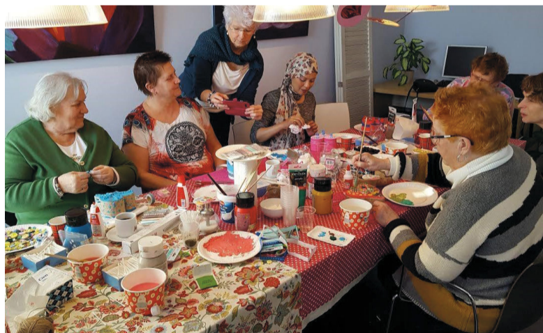
Een gezellige knutselmiddag in het Inloophuis.

geest is uit balans. Voor de één werkt het om er eindeloos over te praten, voor de ander om iets te dóen.' Ook 'een stukje verwennen' is mogelijk. Bijvoorbeeld door een voetreflexmassage, die meteen de stress in een ziek lichaam aanpakt. Van den Hoek: 'Liefdevolle aandacht voor een lijf dat geteisterd wordt en jezelf weer verzoenen met je lijf. Vaak is het lichaams-