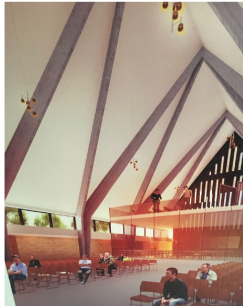
Interieur van de nieuwe Pax Christikerk.

Het heeft even geduurd, maar nu staan alle seinen voor de verbouwing op groen. Het kerkbestuur heeft het ontwerp goedgekeurd en de contracten met de ontwikkelaar zijn getekend. In december moet de kerk leeg worden opgeleverd. De diensten verkassen dan 350 meter verderop naar een aula/kantine van Middin, een activiteiten-centrum voor mensen met een handicap. Dominee Bakker had eerst wat bedenkingen, omdat het pand er van buiten grijs en gedateerd uitziet. 'Maar binnen oogde het licht. Een ruimte in leuke eigentijdse kleuren. Ik verwacht dat de diensten er anders worden: persoonlijker en informeler. Het wordt veel improviseren. Mooi dat we er