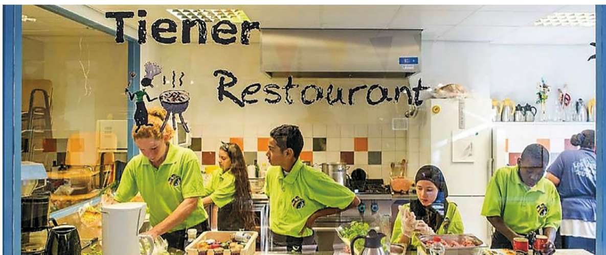
Het Tienersrestaurant in Moerwijk, een succesvol missionair-diaconaal project van Stek. Doel: tieners met een 'pittig leven' helpen.

neem de eindeloze debatten over de besteding van het vermogen (anno 2017 zo'n 56 miljoen euro), de altijd pikante verhouding tot de politiek (een diaken die eind achttiende eeuw van 'patriotse sympathieën' werd verdacht, moest opstappen) en de uiteen-