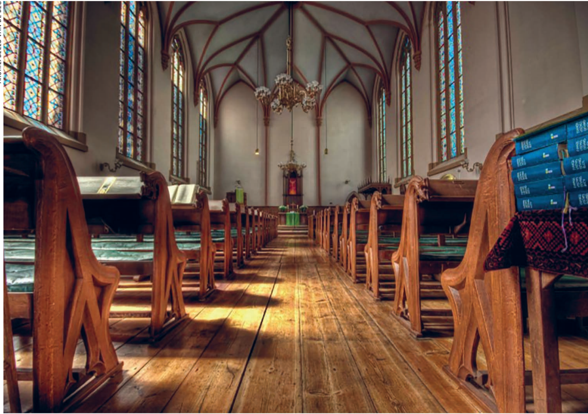
Interieur van de Deutsche Evangelische Kirche.

KERKENTEST Aan een smalle straat in het centrum staat de Deutsche Evangelische Kirche. Het gebouw is verrassend. De schoonheid van de kerk is voor een van de bezoekers een reden om er vaker te komen.