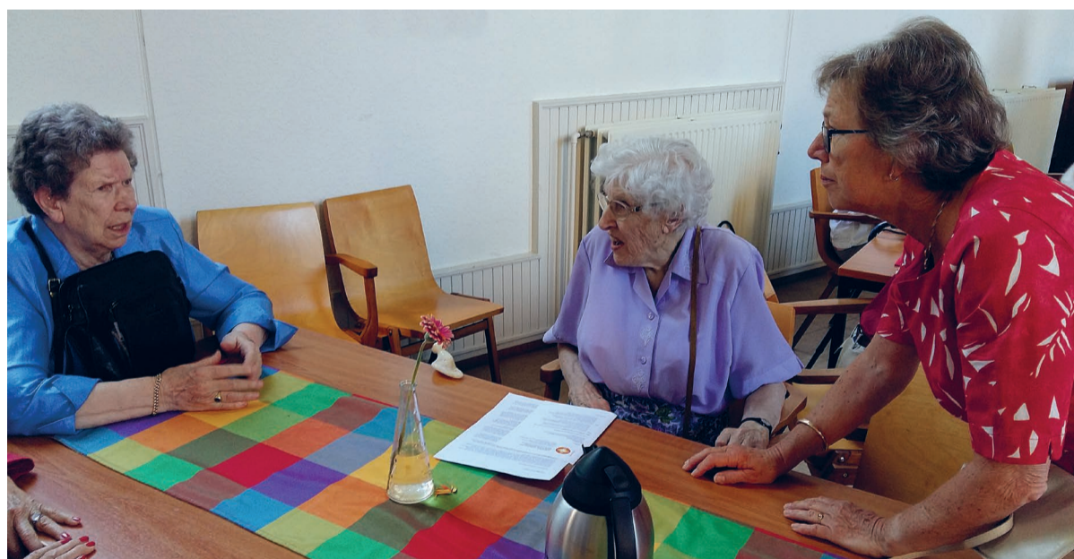
Na de dienst wisselen kerkgangers de laatste nieuwtjes uit.