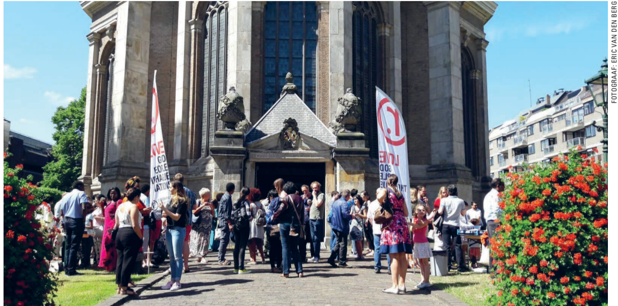
Gezellige drukte, op naar de kerk!

dienst afgelopen, zonder echte afronding en zending.