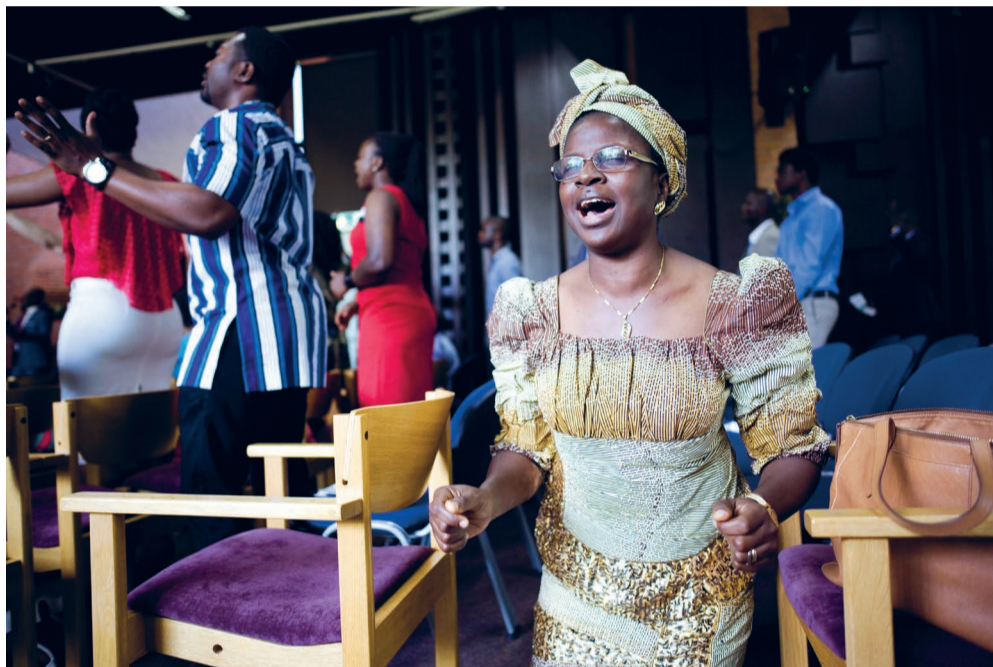
Vol overgave op je knieën voor je stoel.

George is een grote kerel, enthousiast en zwetend