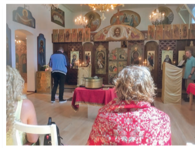
Viering in de Bulgaars-orthodoxe kerk.

De priester blijft ook in de voorbeden aan het woord. Hij noemt de Bulgaars-orthodoxe gelovigen, noodlijdende mensen, zelfs het leger en de