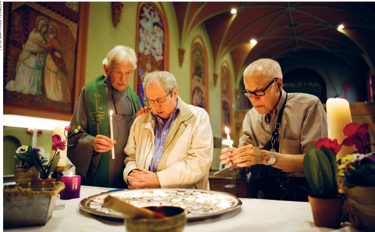
Een kaarsje branden is populair.