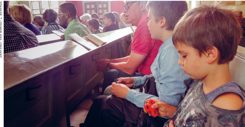
Lekker met je Fidget spinner spelen voordat je naar de kindernevendienst gaat.

KERKENTEST De gereformeerde Noorderkerk in Duinoord hoort bij de landelijke Protestantse Kerk, maar is in Den Haag zelfstandig gebleven. Is deze gemeente net zo saai als het grauwe linoleum dat op de vloer ligt? Niets is minder waar.