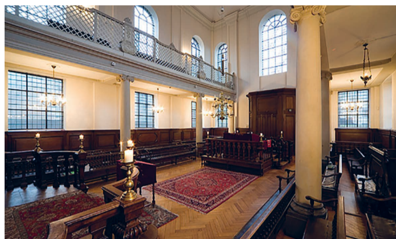
Interieur van de synagoge.