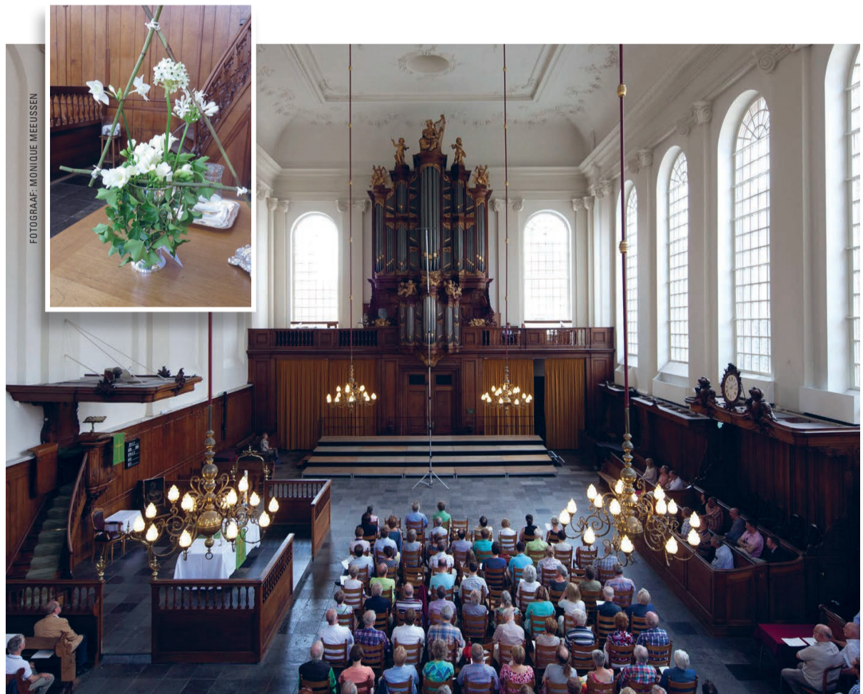
Interieur van de Evangelisch-Lutherse kerk.

KERKENTEST In de Evangelisch-Lutherse gemeente (centrum) staat vandaag een bloemstuk in de vorm van een driehoek. Het is de zondag van de Heilige Drie-eenheid.