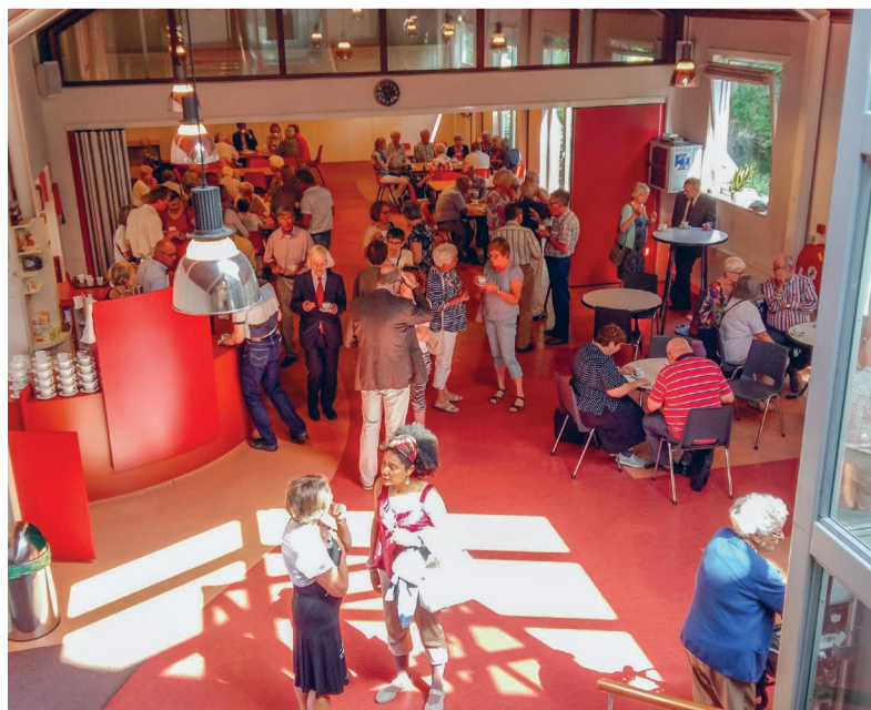
Een blik op de koffiedrinkers vanaf de hooggelegen kerkzaal van de Bosbeskapel

Als ik buiten kom, hoor ik dat een aantal mensen meteen doorgaat naar de crematie – op zondagmiddag! – van een van de overleden vrouwen.