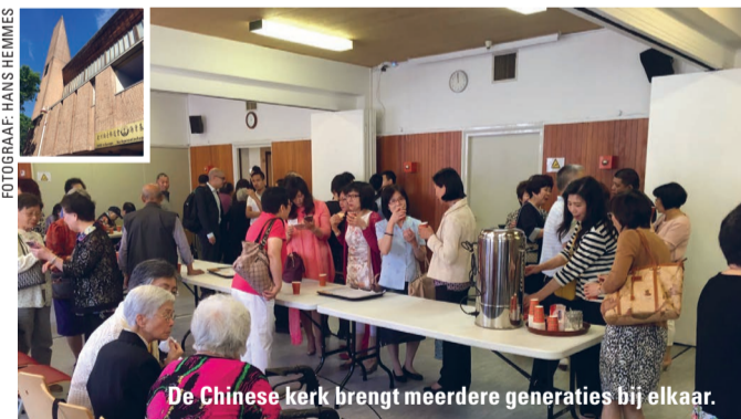
De Chinese kerk brengt meerdere generaties bij elkaar.

KERKENTEST Waar krijg je als nieuweling in een kerk een applaus als welkom en een eigen tafeltje in de koffiekamer? In de Chinese kerk in het Laakkwartier is dat gewoon.