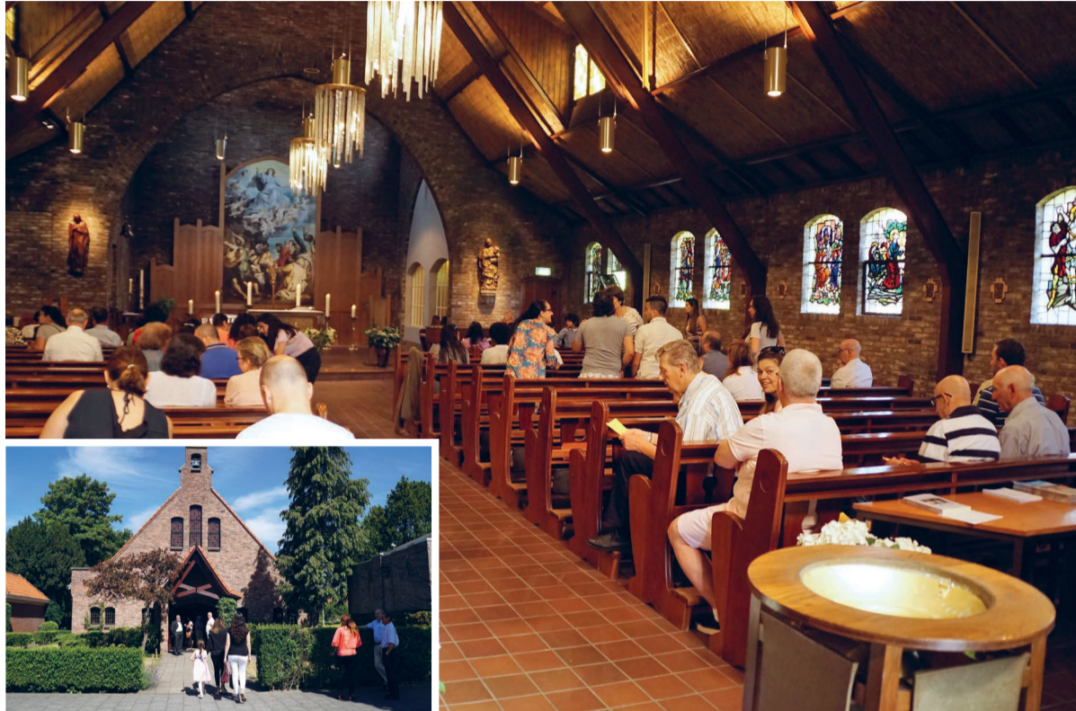
Portugeestalige viering in de Marlotkerk.

KERKENTEST In de wijk Marlot staat een landelijk aandoend, katholiek kerkje. Daar is regelmatig een Portugeestalige viering.