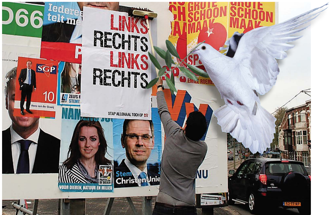
Verkiezingsbord voor de Kamerverkiezingen.