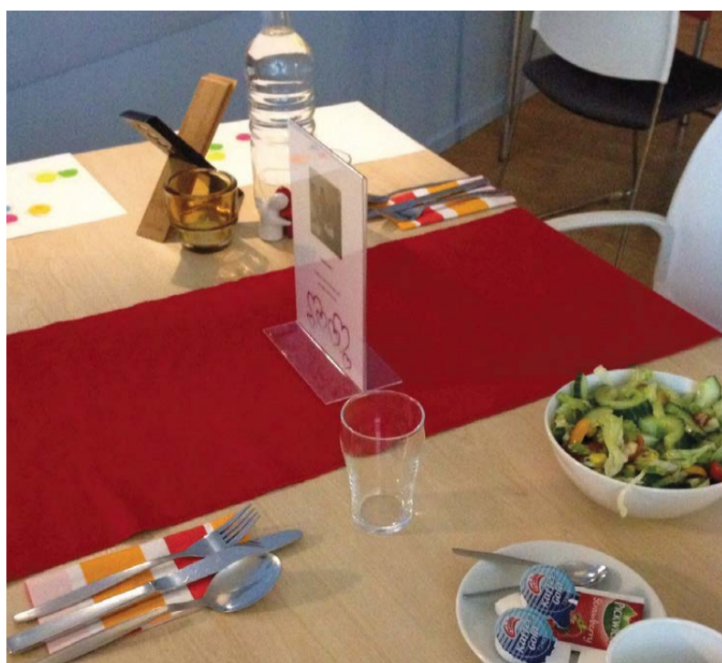
Romantisch tafelen tijdens de huwelijkskursus.