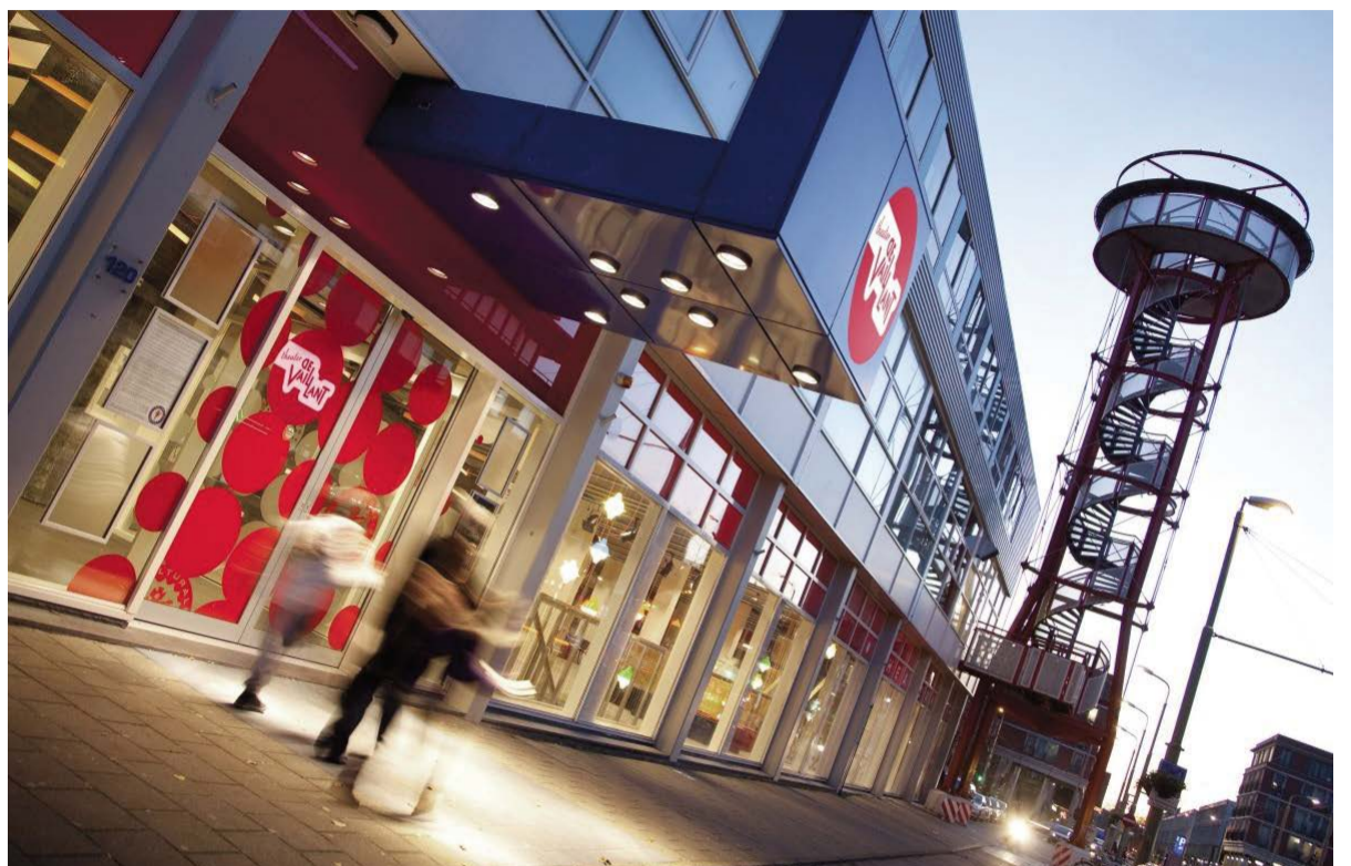
Theater de Vaillant, plek voor creatieve geesten.

DINSDAG 14 FEBRUARI, 9-17 UUR, THEATER DE VAILLANT, HOBBE- MASTRAAT 120. STEKDENHAAG.NL