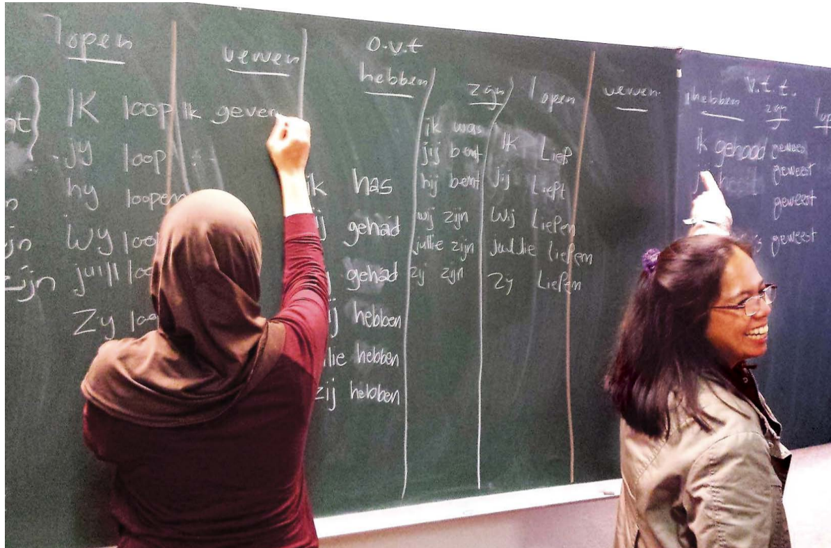
Een lesje in werkwoorden bij het MOC.

INTERVIEW Integratie staat hoog op de politieke agenda. Waar praten we eigenlijk over? En over wie? Twee leidinggevendenden van kerkelijke ontmoetingscentra in Transvaal en Schilderswijk: ‘We zijn blij met kleine successen.’