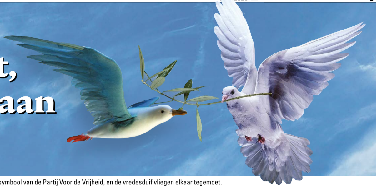
De vrijheidsmeeuw, symbool van de Partij Voor de Vrijheid, en de vredesduif vliegen elkaar tegemoet.

OPINIE De grens sluiten voor moslims en niet méér 'islam' in ons land. Daar zijn christenen uit heel Nederland en van verscheidene kerken het globaal over eens in discussies op Facebook. Kerk in Den Haag verspreidde een vraag: in hoeverre is het PVV-verkiezingsprogramma verenigbaar met het christelijke gedachtegoed? Een analyse van de reacties.