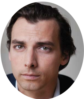
dr. Thierry Baudet

EIND DEZE MAAND HOUDT DE Maranathakerk een publieke debatavond over grote, onderliggende thema's van deze verkiezingen. Speciale gast is Thierry Baudet.