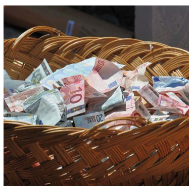
Kerkbalans-opbrengsten lopen terug.

pende herstructurering waarin kerken werden gesloten en het aantal predikanten werd verminderd, ‘een zeer grote zorg’, aldus de penningmeester half december in de algemene kerkeraad. Bij ongewijzigd beleid dreigt in 2025 een aanzienlijk tekort. Probleem is dat praktisch alle uitgaven tot de kerntaken behoren: zorg voor gebouwen en personeelslasten. ‘Heeft u ideeën om te bezuinigen? Ik hoor het graag’, aldus de penningmeester. In de afgelopen jaren werden de tekorten grotendeels gecompenseerd door