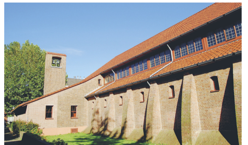
Een markant gebouw midden in een Haagse wijk.