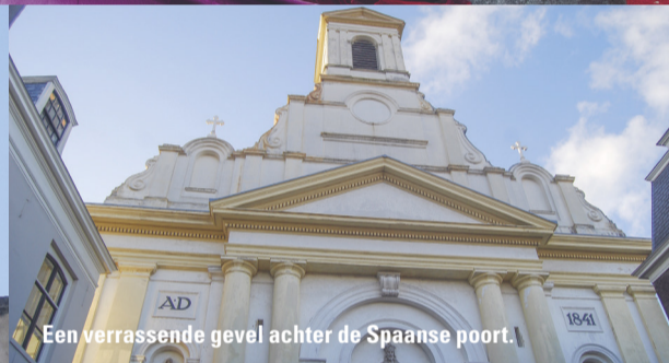
Een verrassende gevel achter de Spaanse poort.

Er kwam een rooms-katholieke kapel, zoals dat in ambassades van rooms-katholieke landen gebruikelijk was. Haagse katholieken konden nu ter kerke gaan in het Westeinde, hoewel de Staten hadden verboden niet-huisgenoten van ambassadebewoners toe te laten in hun kapel. In 1677 verhuisde de ambassade naar een groot pand aan de overkant van het Westeinde, het oude