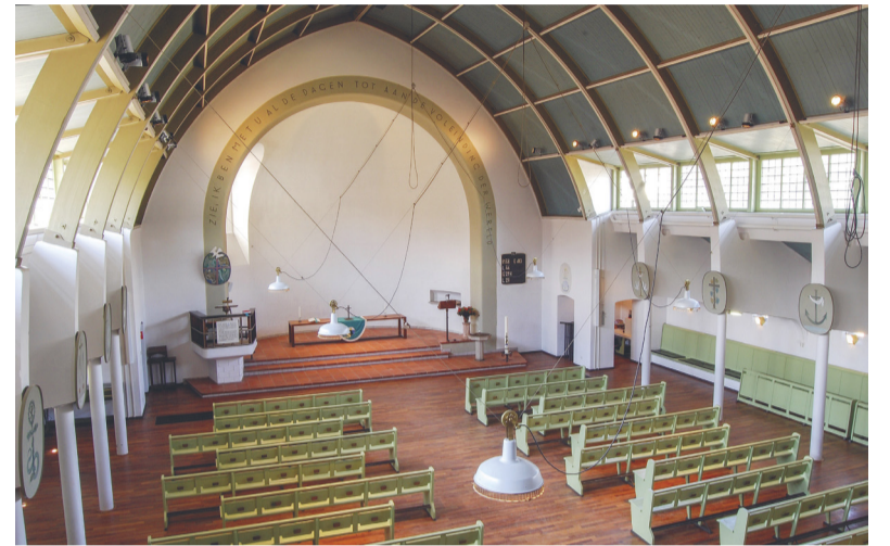
Het dak lijkt te zweven, een vondst van Otto Bartning.