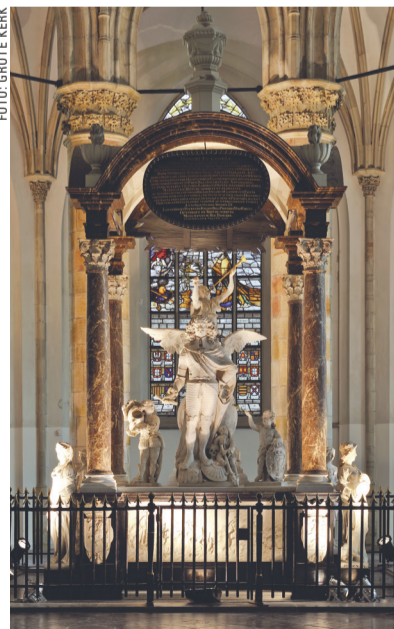
Monument voor Van Wassenaer Obdam.