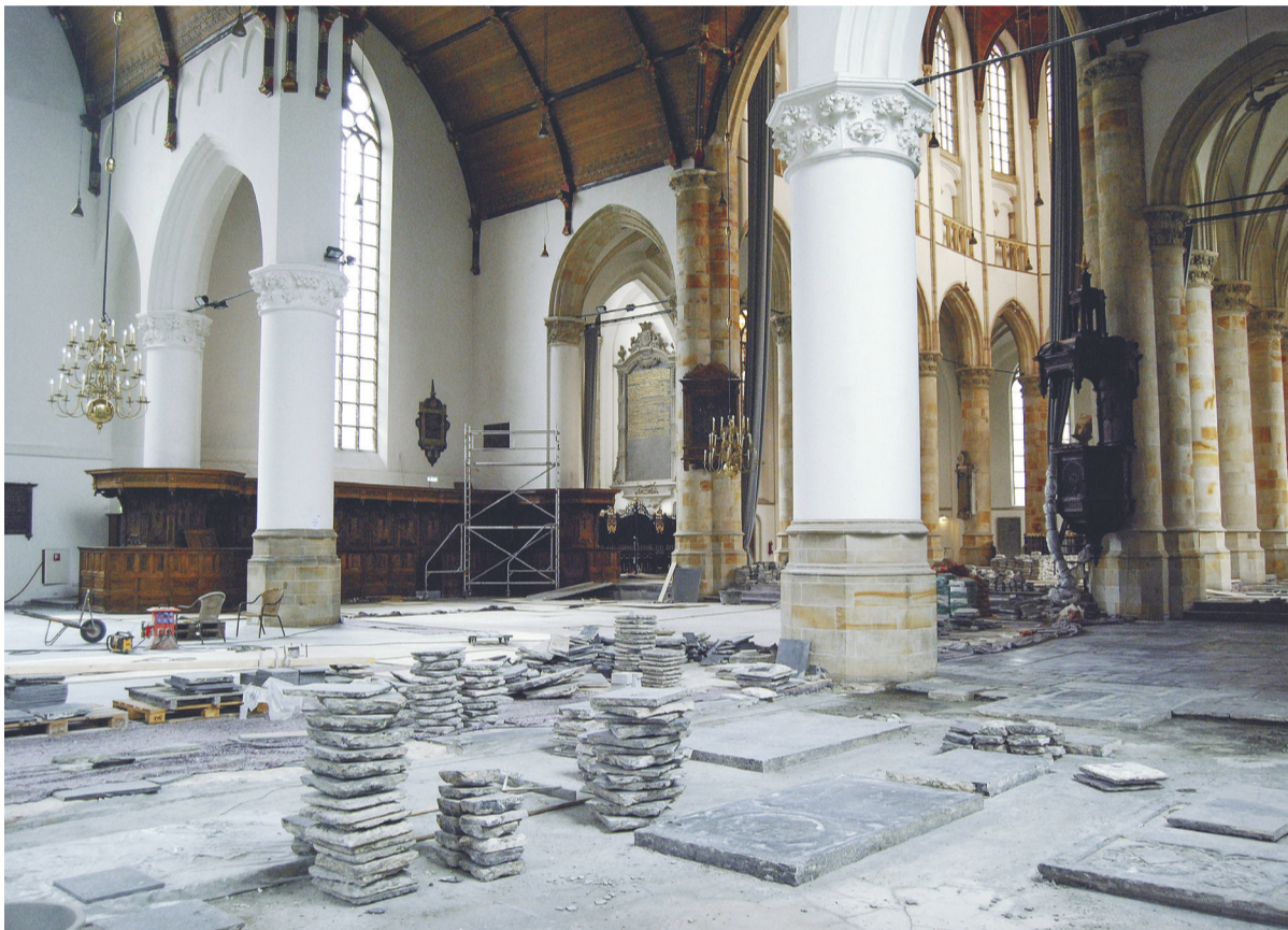
De geschiedenis van de Grote Kerk gaat door; de restauratie van 2007.

Ontstaan als houten kapelletje in de dertiende eeuw is de Grote Kerk in de loop van de tijd uitgegroeid tot een imposante ruimte, boordevol herinneringen.