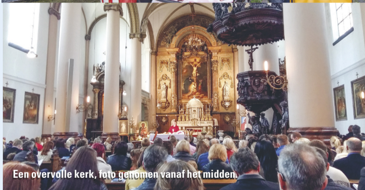
Een overvolle kerk, foto genomen vanaf het midden.