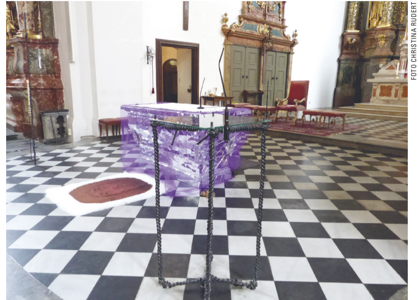
Een kleurige altaartafel in de St. Andräkirche in Graz.

Alle partners hebben van 4 tot 7 mei 2017 Den Haag bezocht. Kerk in Den Haag heeft toen haar 'leermodule' gepresenteerd in de vorm van deze bijlage van het maandblad. Ook zijn de drie betrokken kerken bezocht. (pg)