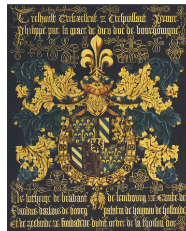
Een van de ridderborden uit 1456.