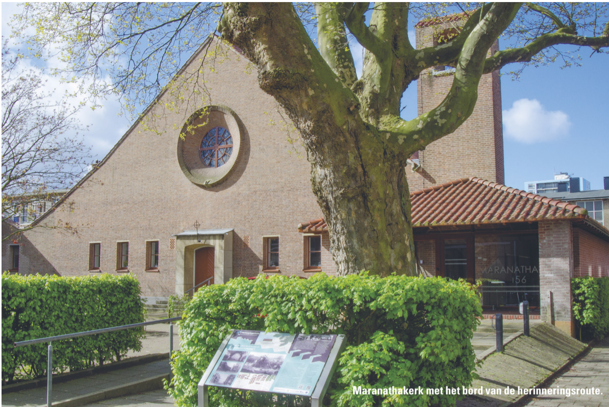
Maranathakerk met het bord van de herinneringsroute.