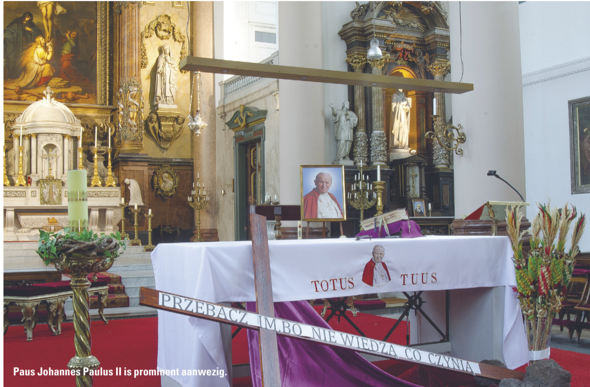
Paus Johannes Paulus II is prominent aanwezig.

Wat is nu de link met de Teresiakerk? Nog even een stukje geschiedenis. In 1648 werd de Vrede van Munster gesloten, waarbij de opstandige Nederlanden een zelfstandige staat werden. Daaruit vloeide voort dat er ambassades naar Den Haag kwamen, waaronder de Spaanse. De Spaanse gezant vestigde zich aan het Westeinde. In zijn kielzog kwam een aalmoezenier mee, een jezuitet; de orde van de jezuiteten heeft zijn oorsprong in Spanje.