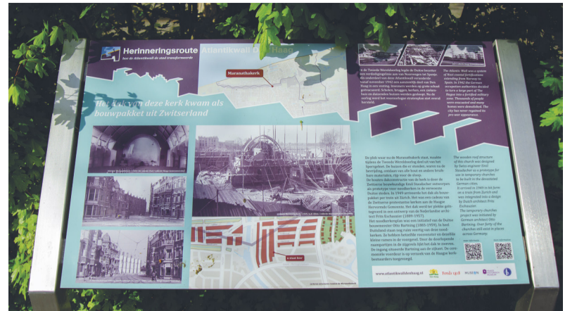
De kerk ligt op de fietsroute die herinnert aan de Atlantikwall.

Drie Haagse kerken: de Grote Kerk, de Teresiakerk en deze noodkerk: wat een verhalen vertellen ze over de geschiedenis van Den Haag, stad van vrede en recht. En over de historie van Europa. Wie langs deze drie kerken wandelt, voelt de geschiedenis. (mcb)