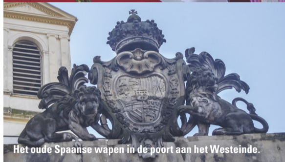
Het oude Spaanse wapen in de poort aan het Westeinde.