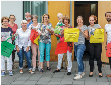
'De Samenlopers' verrassen asielzoekers.

In de rooms-katholieke Bonifatiusparochie van Rijswijk ontstond vorig jaar het idee welkomstpakketten aan vluchtelingen uit te reiken in het azz. Probleempje: Kerkelijke hulp wordt niet zomaar toegestaan door de opvangcentra, die hun religieuze en politieke neutraliteit willen behouden. Slimme koppen bedachten het plan om de krachten te bundelen met vrijwilligers van de evangelische, protestantse, christelijke gereformeerde,