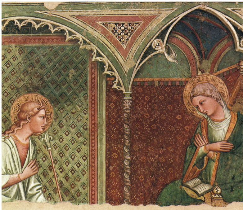
‘De Annunciatie’. Fresco van Spinello Aretino (14de eeuw). Bisschopsmuseum in Arezzo.

Er is ook schrik, de hemel raakt immers de aarde. Wat mag het betekenen, een begenadigd mens zijn? ‘De kracht van de Allerhoogste die je overschaduwet’? Hoe oud zal ze geweest zijn, onze Maria. Zestien zeggen sommigen, laat het een paar jaar schelen, dan nog. Ze is nog bezig zichzelf te ontdekken en probeert eraan te wennen dat ze is uitgehuwelijkt. Maar Lucas vertelt dat de hemel niet ver is waar mensen eten en drinken, huwen en ten huwelijk worden gegeven. ‘Begenadigd’ ben je, Maria. Door haar oogleden kijkt Maria naar de engel – of kijkt ze naar