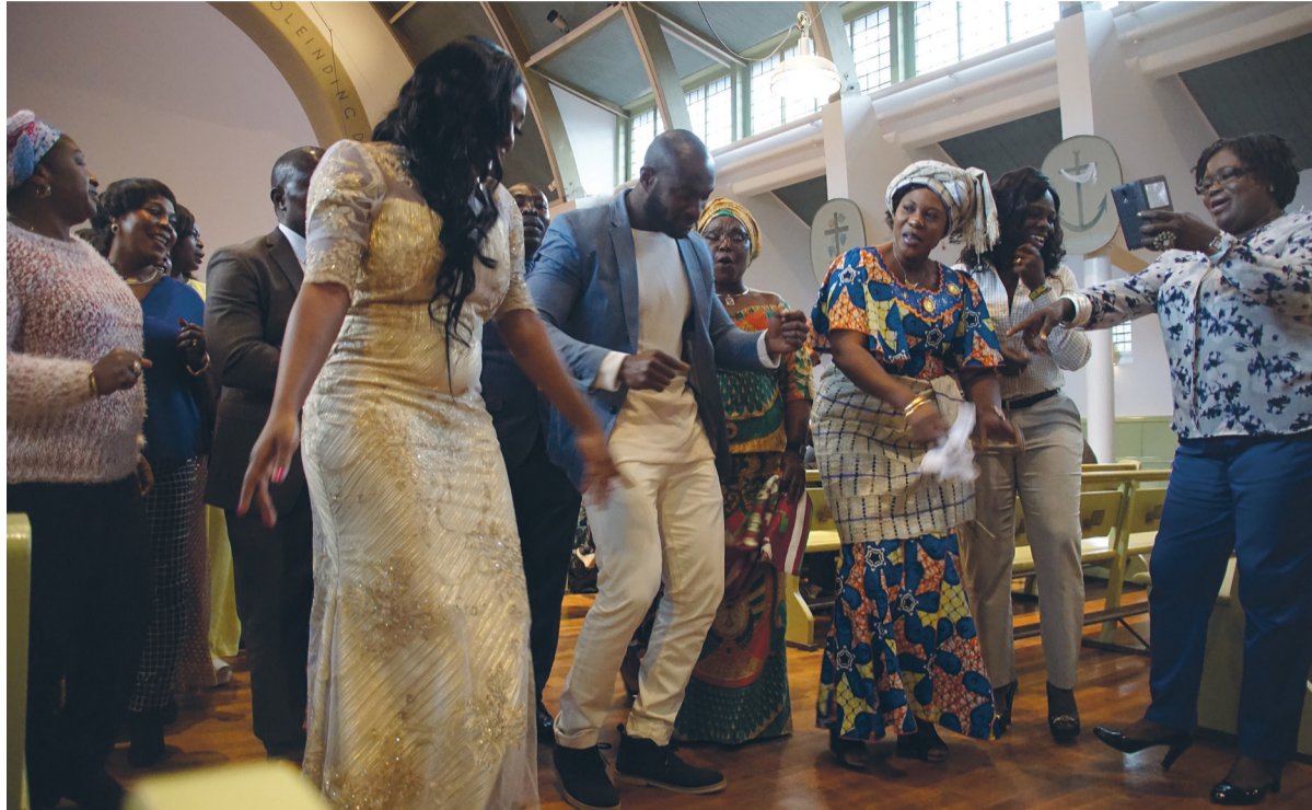
Rhema Gospel Church: de stilte komt hier onverwacht.