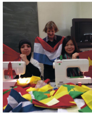
MOC, wereld in de Schilderswijk.