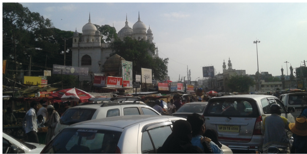
India, een 'klankenpotpourrie', oorverdovend kabaal.

God en stilte, het lijkt bij ons een hype geworden. Zo niet in India. Met ons drieën liepen we een hindoeïetempeltje binnen. Een priester vroeg onze namen en deed voorbeden voor ons ten overstaan van zijn hindoeïgodheid. Hij offerde er wat bloemen en rijstkorrels bij en wij kregen een stip op ons voorhoofd. Daarna stelde de priester een automatische trommel in werking. Het ding maakte een enorme herrie. Blijkbaar moest zo de aandacht van de godheid worden getrokken. Ja, als het maar hard is en veel geluid produceert. Is dat nou iets van moslims of hindoes? We hebben op zondagmorgen een kerkdienst bijge-