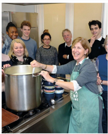
Goede koks, lekkers voor velen.

Al vijftien jaar komen dak- en thuislozen wekelijks naar het Stadsklooster (Westeinde) voor een oecumenische viering en maaltijd. Twee groepen vrijwilligers, van het Straatpastoraat en van de internationale Church of Our Saviour, koken om beurten op vrijdagmiddag voor tientallen stadgenoten. Wie benieuwd is hoe je met weinig geld een gezonde maaltijd voor grote groepen maakt, kan uitzien naar Nederlands eerste kookboek hierover, 'Cooking for Crowds'. De vrijwilligers bedachten de bundel met recepten, boodschappenlijstjes en tips zelf. Om de uitgave mogelijk te maken