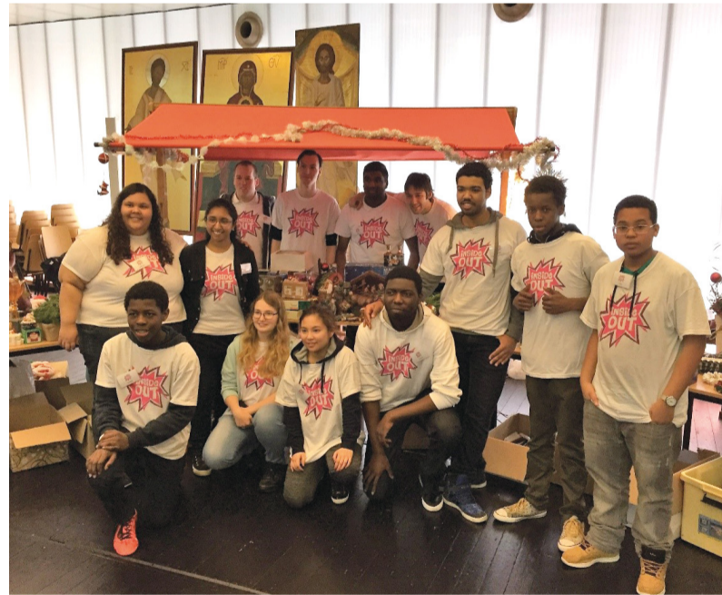
Jongeren van Inside Out laten het beste van zichzelf zien.

REPORTAGE De meeste vrijwilligers komen vanuit de kerk, beschrijft het nieuwste rapport 'Burgerperspectieven' van het Sociaal en Cultureel Planbureau. Wat doen kerk-gerelateerde vrijwilligers zoal in de regio Haaglanden? Een kleine rondgang.