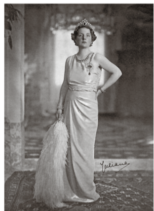
De jonge koningin Juliana.

Enthousiasme over die kant van Juliana is echter opvallend schaars. Goed, de schrijfster geeft haar eerherstel vanwege haar doortastendheid in de oorlogsjaren. Ze beschrijft ook keurig haar spirituele zoektochten. Maar omdat Withuis, zoals ze zegt, geen antenne heeft voor geloofsonderwerpen, blijft die kant een beetje vlak. Het gevolg is dat het beeld van de gelovige vorstin als ijveraar voor de wereldvrede nog steeds wordt opgehangen aan haar omstreden omgang met zweriger hielenlikkers. Dat is jammer, omdat Juliana beter verdient. Ik heb een zwak voor haar. Niet alleen omdat ik