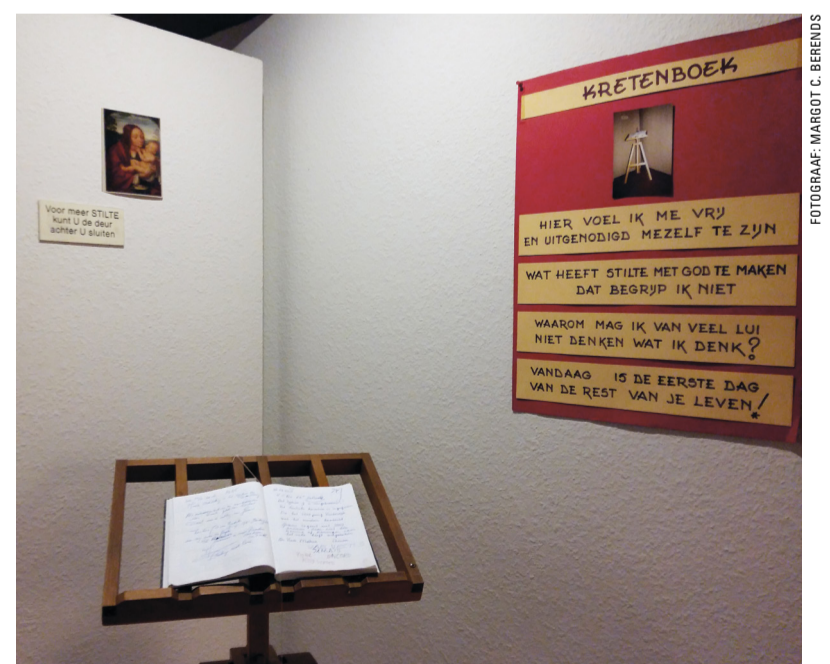
'Kretenboek' in het Aandachtscentrum.