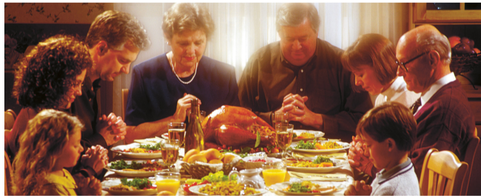
Vrome gezelligheid bij het traditionele Thanksgiving-diner.