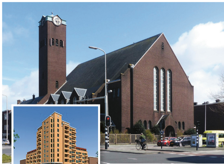
Van Valkenboskerk naar woontoren.