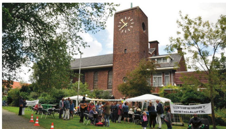
Buurtprotest voor behoud van de Bethelkerk.

kerkvoogden van de PGG. ‘Als we het ons konden permitteren, zouden we het kunnen overwegen. Maar we hebben het geld hard nodig. En stel dat zo’n buurtstichting na een paar jaar de handdoek in de ring gooit en het gebouw alsnog doorverkoopt aan een bouwondernemer, waar blijft dan de winst? Wordt die dan alsnog spontaan aan de PGG overgemaakt?’