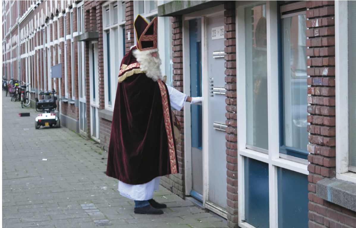
Hoor, wie klopt daar kinderen?

INTERVIEW Sinterklaas houdt in november weer overal zijn intocht. Voor het vierde jaar tuigt ook de Kloosterkerk weer een Sinterklaas op. Hij deelt bij arme huishoudens in de Schilderswijk en omgeving presentjes uit.