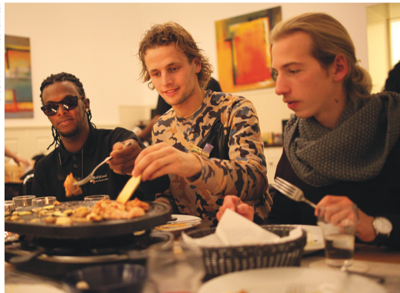
Daklozen smikkelen samen met scholieren van een gourmetmaaltijd.

REP ORTAGE Zwerfjongeren en leerlingen van Gymnasium Haganum genoten samen van een maaltijd. Opzet van de 'Tafel van Hoop': laat uitersten in de grote stad eens met elkaar kennis maken. Het werd een succes. 'Iedereen heeft problemen, ook als je niet dakloos bent.'