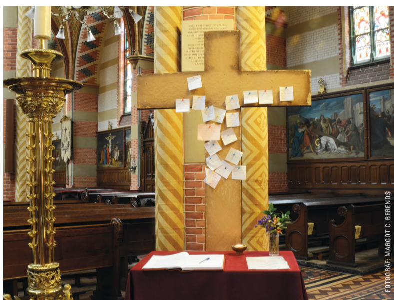
Het gebedenboek en het 'intentiekruis' voorin de Parkstraatkerk.

Toch wil ik een paar dingen delen. Zo viel me op dat het boek in het Aandachtscentrum geen 'voorbedeboek'