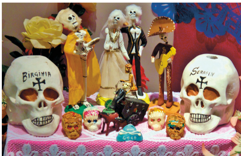
Een Mexicaanse gedachtenistafel voor zielen.