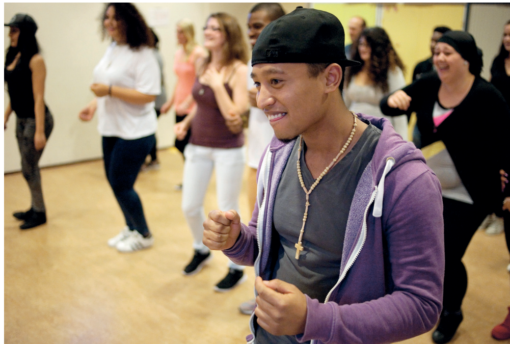
Let's dance, even niet aan drama's denken.