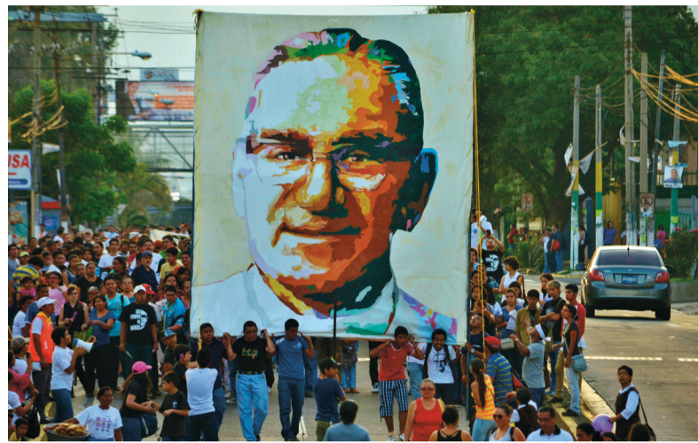
Sal Salvadorianen dragen Oscar Romero op handen, zijn zaligverklaring toejuichend.

Hoewel Oscar Romero in Latijns-Amerika werd geëerd, heeft zijn zaligverklaring drieënhalve eeuw op zich laten wachten. Reden is dat hij werd verdacht van marxistische sympathieën en dat zijn dood als een politieke moord werd gezien. Paus Franciscus nam deze barrière weg door onlangs te verklaren dat Romero 'niet is vermoord