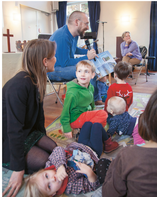
Een vrolijke bedoening in de Anglicaanse Gateway-dienst.

Voor we openen met een thank you-song , mag je inbrengen waar je dankbaar voor bent. Een vader met een baby-meisje vertelt dat het beter gaat met zijn moeder. Een ander zegt dat haar zoontje zichzelf kan aankleden en dat hij daarom een mooie auto gekregen heeft. Terwijl wij zingen, danst een meisje cirkels voor in de zaal. Na de sorry-song mogen de kinderen naar voren komen en uit een mandje een instrument kiezen.