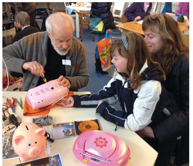
In het 'repair café' krijgen kapotte spullen een nieuw leven.

Met de uitvoering van de top drie is al begonnen. In samenwerking met de Loosduinse stichting 'Voor Welzijn' zijn bij voedselbanken 'markten van