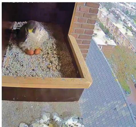
De vrouwtjesvalk broedt op nieuw leven.

Twee webcams volgden de ontwikkelingen. De beelden zijn rechtstreeks te