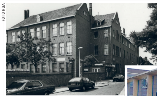
De tragische geschiedenis van het vroegere Joodsch Lyceum wordt herdacht met een plaquette, tevens een waarschuwingsteken.