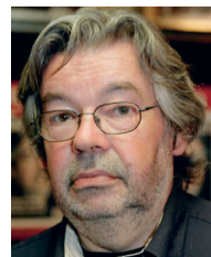
VRIJDAG 27 JUNI, 20 UUR, € 10. MARANATHAKERK.

DE MARANATHAKERK, GEBOUWD in 1949, bestaat dit jaar 65 jaar. Ter gelegenheid daarvan houdt de historicus en tv-persoonlijkheid Maarten van Rossem een voordracht over grotere en kleinere gebeurtenissen die de wereld sinds de