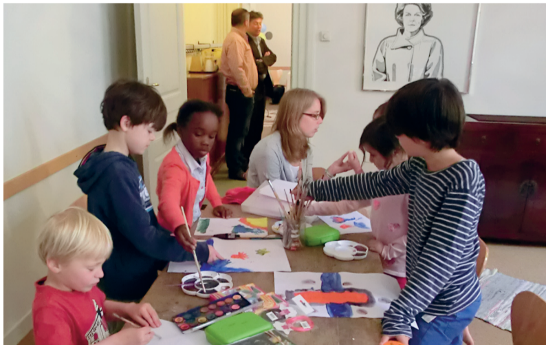
Spelenderwijs leren kinderen de betekenis van bijbelverhalen in de Kloosterkerk.

REPORTAGE Godly Play is een bijzondere methode om bijbelverhalen te vertellen aan de hand van materialen. Ook in Den Haag wordt ermee gewerkt. Niet alleen kinderen, ook volwassenen zijn enthousiast: 'Voor ik het wist zat ik er helemaal in.'