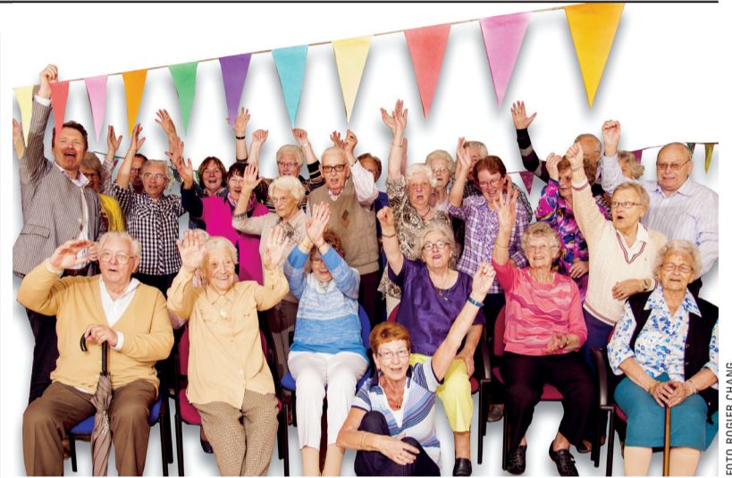
Een uitzinnig 'hoera!' van Marcuskerkgangers op een groot feest voor een 75-jarige.

Tweede Wereldoorlog ingrijpend hebben veranderd. Na zijn inleiding is er gesprek met het publiek.