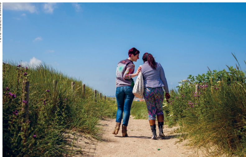
Een slachtoffer van mensenhandel trekt op met z'n maatje, op weg naar een beter leven.