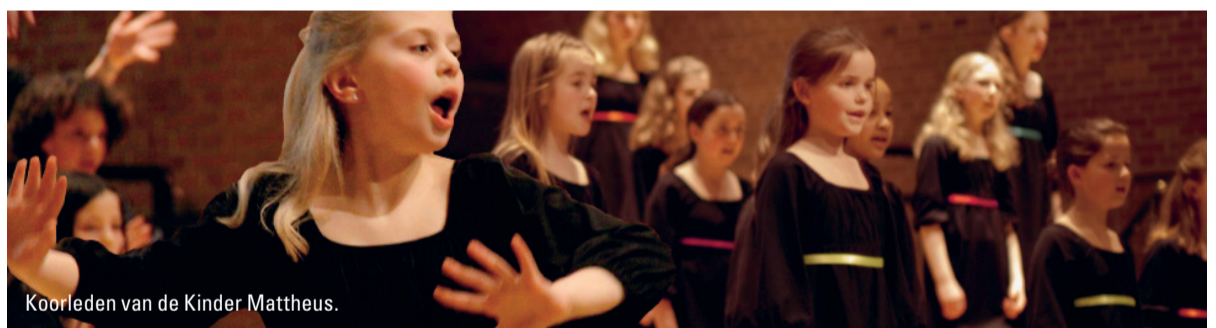
Koorleden van de Kinder Matteüs.

Behalve deze uitvoering verzorgt het gezelschap in elke stad concerten voor basisscholen. De leerlingen hebben van tevoren in de klas flink kunnen oefenen met twee koralen – die ze tijdens het concert meezingen – en zijn via een