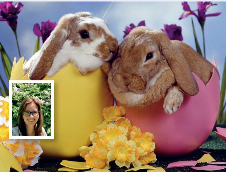
Haasjes uit eieren: wekt dat de verwondering passend bij Pasen?

Toen de Israëlieten door de woestijn trokken, werden ze beproefd en dachten ze door God verlaten te zijn. Ze verloren het vertrouwen in de leiding en overwinning van het goede. Jezus drukte die twijfel uit aan het kruis: 'God, waarom hebt u mij verlaten?' De verhalen leren ons dat de Eeuwige God de mens niet in de steek laat. Met Pasen vieren we dat Jezus het lijden overwint. Leven wint het van de dood, hoop van wanhoop, de traan wordt een lach.