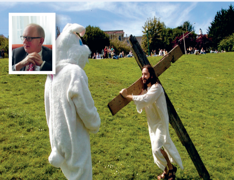
Jezus legt het steeds vaker af tegen de paashaas, vindt Olivier Elseman.

Met Jezus' opstanding uit de dood bewijst God dat het zin heeft om voor menswaardigheid op te komen, hoeveel nederlagen we ook te verduren krijgen. Toch is die blijde boodschap van de triomferende Christus in de schaduw van de volksdevotie gebleven. Pasen is een moeilijk te verkopen verhaal. We begrijpen wat het is om te (laten) lijden. Het lijdensverhaal is ons op het lijf geschre-