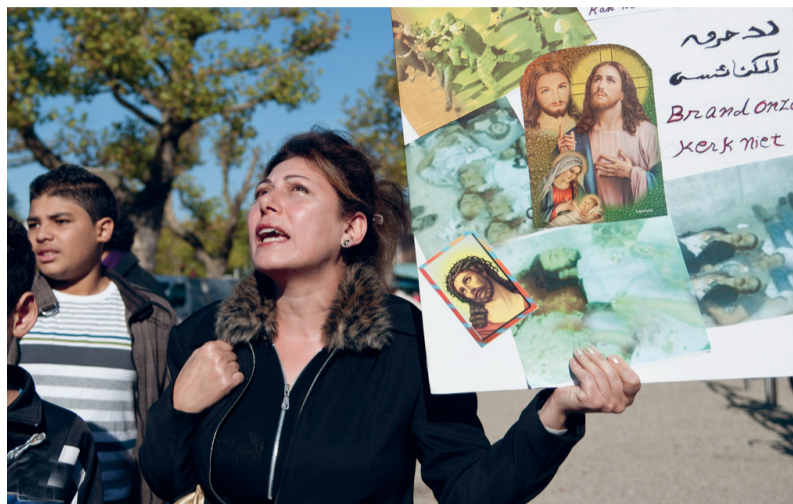
Egyptische koptische migranten laten in Den Haag hun stem horen tegen de geloofsvervolgung in hun land.

INTERVIEW Asielzoekers die zich hebben bekeerd tot het christelijk geloof maken meer kans op een verblijfsvergunning. Maar hoe kunnen ambtenaren beoordelen of iemand oprecht gelooft? Volgens de Haagse advocaat Erwin Weegenaar, die veel vreemdelingen bijstaat, gaat het weleens mis.