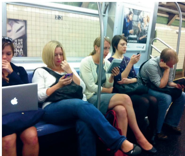
Tussen de bedrijven door, in de metro: we lezen en schrijven constant.

den op schrift te stellen? Naar mijn idee wordt er meer geschreven en gelezen dan ooit.