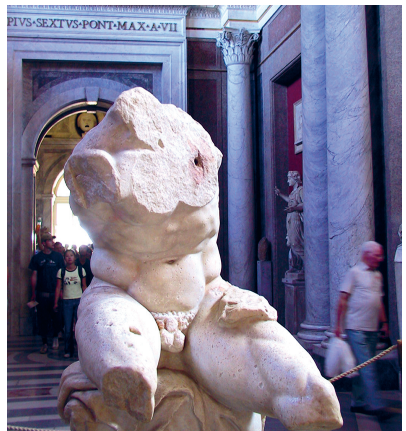
Torso van Apollo. Vaticaanse museum.

Reinoud Schoemaker, LETSELSCHADE ADVOCaat Uw letsel mijn zorg 070 - 40 43 34 6 ADVOCaat@REINBOUDSCHOEMAKER.NL WWW.REINBOUDSCHOEMAKER.NL