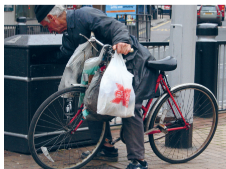
Armoede in Den Haag: de zekerheid brokkelt af.

stadswijken heen, die ernstiger is. De zekerheid brokkelt ook af in de middele groepen, waar politiek lokaal Den Haag op stabiliteit rekent, en waar de politiek zich het meest van aantrekt. Velen verliezen hun werk. Jongeren komen moeilijk aan een vaste baan. Ze moeten tevreden zijn met vele baantjes voor steeds kortere perioden, als gevolg van flexibilisering van de arbeids-