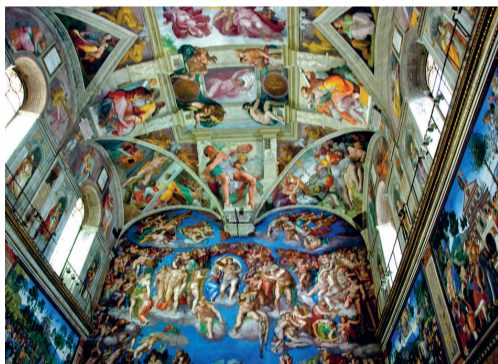
De Philipszaal wordt omgetoverd tot de Sixtijnse kapel.

ACTIE Wilt u naar een bijzonder concert van The Tallis Scholars? Kerk in Den Haag geeft u korting op eerste-rangkaartjes.