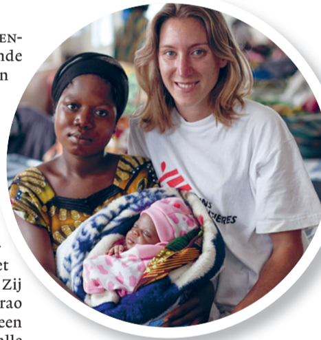
De moedige Pua en Sifra van tegenwoordig.

wel, uit angst. Pua en Sifra zeiden: sorry, die joodse vrouwen zijn zo sterk, die kinderen zijn allang geboren en weg voordat wij aankomen. Werkten zij sa-