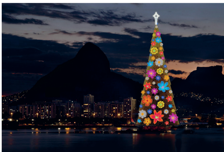
In Rio de Janeiro staat 's werelds grootste drijvende kerstboom.