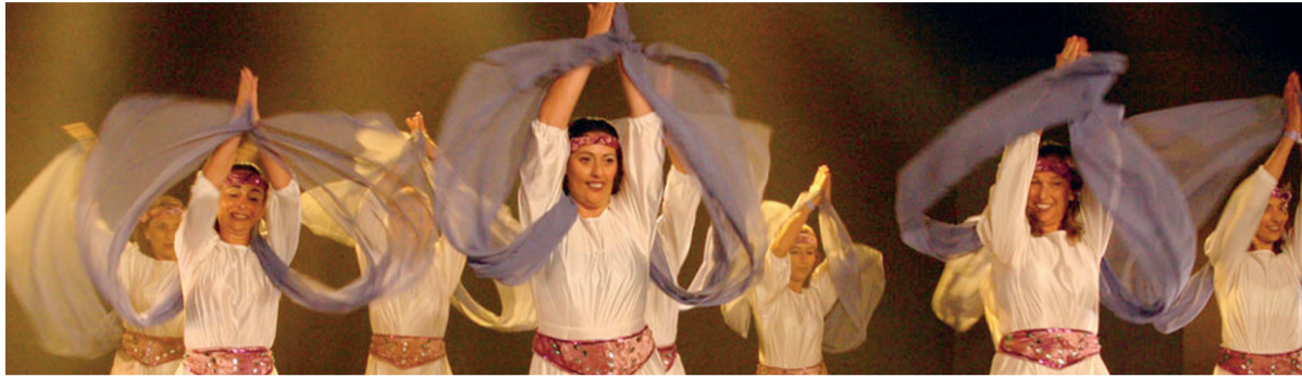
Een Israëlsche groep danst in klederdracht. Je weet maar nooit op welk podium de Haagse cursisten terechtkomen!

REPORTAGE Israëlsch dansen, hoe doe je dat? Kerk in Den Haag probeerde een avond de fijne kneepjes onder de knie te krijgen. 'Ja, sommigen hebben hem al goed te pakken!'