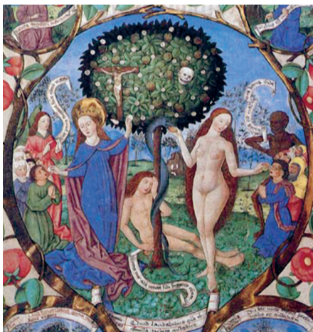
Berthold Furtmayr, 'boom des doods en des levens' (voor 1481). Bayerische Staatsbibliothek in München.

I K KEN EEN GEMEENTE WAAR DECENNIA geleden een populaire kerstavonddienst per kerkeeraadsbesluit afgeschaft werd 'omdat er te veel mensen komen die wij niet kennen.' Nog steeds blijft in veel kerken de kerngemeente tijdens al te populaire kerstvieringen liever thuis. Elders wordt op kerstavond expres een hoogkerkelijke – en dus ook hoogdrempelige – dienst van Schrift en Tafel gevierd. Of er is elke herfst weer dezelfde discussie of er een kerstboom de kerk in mag komen. Mij bevreemdt dat. En ik vind het jammer. Zo mis je namelijk de met afstand grootste missionaire kans van het jaar om mensen met het goede nieuws te raken. Maar ik ben bevoor-