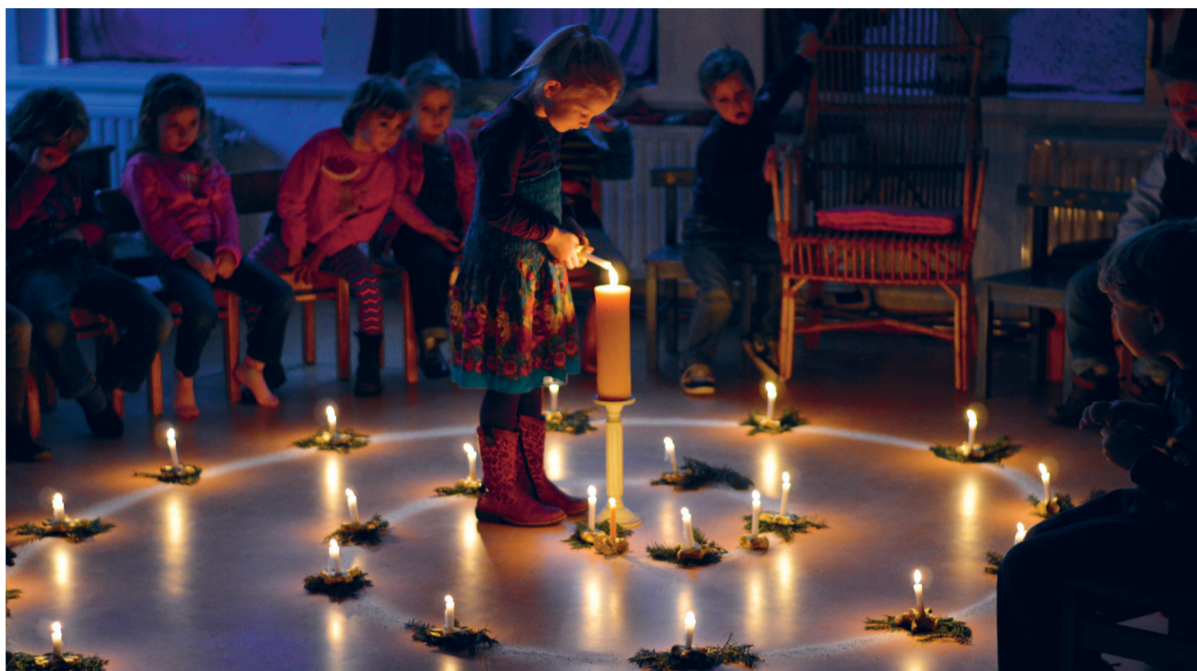
Verstild en verwonderd kijken leerlingen toe, hoe een meisje haar kaarsje aansteekt en in een spiraal plaatst, het levenspad.

KERST: KDH-lezers met korting naar Anton Philipszaal ■ Uitgebreide agenda met kerstactiviteiten ■ Bijzondere avond in Grote Kerk