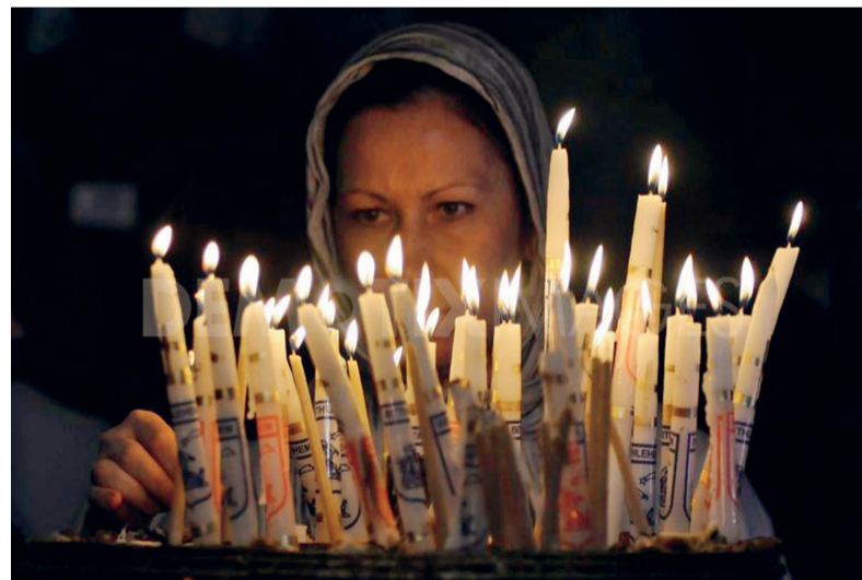
Een Arabische vrouw brandt een kerstkaars.