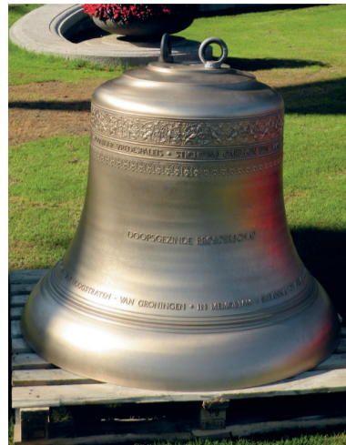
De nieuwe klok, klaar om omhooggetakeld te worden. Behalve 'Doopsgezinde Broederschap' zijn enkele namen van andere gevers zichtbaar.