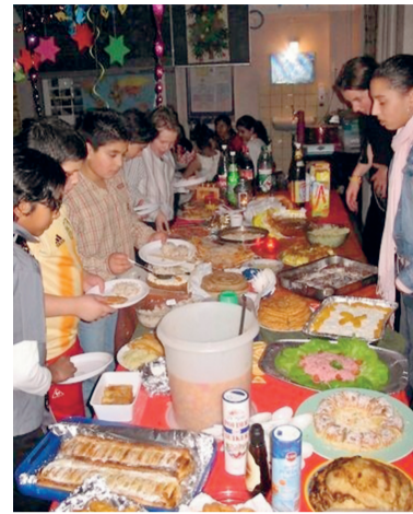
Falafel, roti en kroket: kinderen van alle culturen en geloven smullen aan de kersttafel.

Een religieuze betekenis heeft het feest niet voor hen. I'ir: 'Ik sta niet extra stil bij het verhaal van Jezus. Het is een mooi verhaal en ik geloof wel dat Jezus