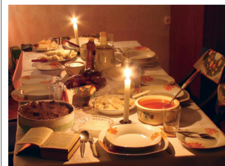
Een traditioneel Poolse kersttafel.

Reinoud Schoemaker, LETSELSCHADE ADVOCaat Uw letsel mijn zorg 070 - 40 43 34 6 ADVOCaat@REINOUDESCHOEMAKER.NL WWW.REINOUDESCHOEMAKER.NL