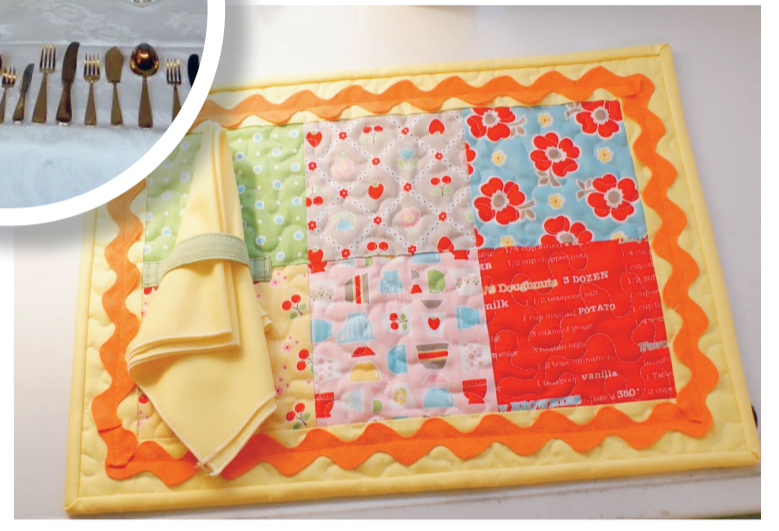
Tastend proeven is een mooier compliment dan applaus