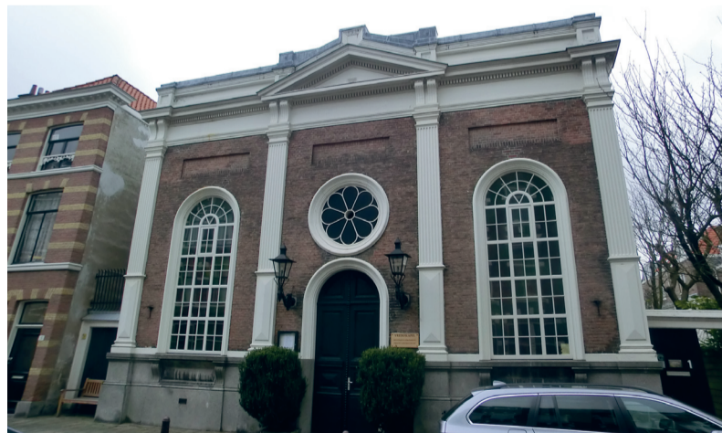
De Vredeskapel aan de Malakkastraat in de Archipelbuurt.

In de Vredeskapel (Archipel) wordt met ingang van Pinksteren nog slechts een dienst per maand gehouden. Met Pinksteren 2014 wordt de kapel gesloten. Alle diensten worden dan in de Duinzichtkerk gehouden. Een werkgroep van buurtbewoners en kerkleden werkt momenteel aan een plan om voor de Vredeskapel een passende be-