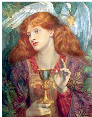
Maria Magdalena houdt de heilige graal vast. De duif stelt de Heilige Geest voor.