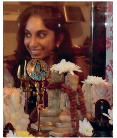
Zij brengt offers aan één of meerdere goddelijke gedaanten achter de vitrine.

'Moeilijk te zeggen. Het hindoeïsme betekent alles en nog meer voor mij. Maar ik zou kiezen voor het boeddhis-