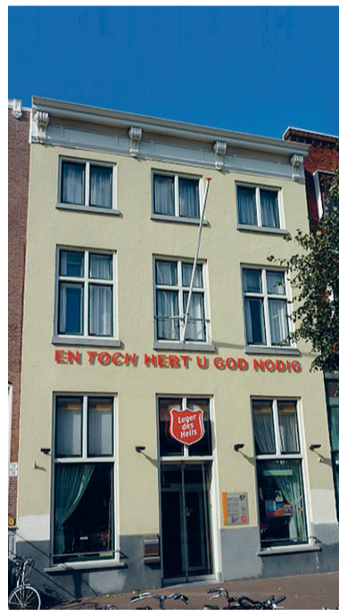
Te koop in Den Haag: gebouw van het Leger des Heils, op Reliplan.nl aangeprezen als 'prachtige kerk' in het centrum.

Een blik op de website van Reliplan leert, dat tegelijkertijd een niet bij name genoemd kerkgenootschap op zoek is naar een gebouw in Den Haag of omgeving dat plaats kan bieden aan vijfhonderd bezoekers. De koper heeft een half miljoen euro te besteden. 'Zo zijn er nog veel meer op zoek', aldus directeur Bosschert. Ze noemt een paar kandidaten op: enkele Volle Evan-