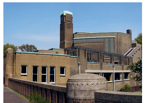
Het gebouw First Church of Christ, Scientist, een ontwerp van H.P. Berlage.

Stomps vertelt dat hun eigen gebouw is verkocht aan een kunstverzamelaar. 'Hij wil er een museum in vestigen, en kunstenaars ruimte bieden. Het zaaltje in Hotel Petit waar we nu zitten, huren we voor de zondagochtend en eenmaal per maand op woensdagavond. Of we hier altijd blijven? Geen idee. Voorlopig is het goed.' Aan de Laan van Meerdervoort heeft de ge-