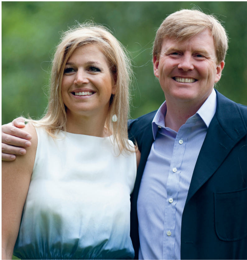
'Met je invloed kun je veel ten goede of ten kwade doen voor je onderdanen.'