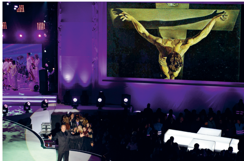
Deze maand bij de Hofvijver: bijbels lijdensverhaal als kijkplezier.

af, omdat de kerk te politiek eenzijdig werd. Maar in Naarden en in talloze concertzalen bleiden de uitvoeringen van de Mattheüs Passion op. Onder het 'Ruhe sanfte, sanfte Ruh' mocht je een traantje wegpinken. Inmiddels heeft de 'emotiecultuur' bezit genomen van de omroepen, die daar nu de straat mee opgaan. De Jezus waar het om gaat in het verhaal, wordt een kleine jongen bij het reusachtig opgepompte kruis. Wat huiveringwekkend was, wordt 'paaspektakel' met veel kijkplezier. In de