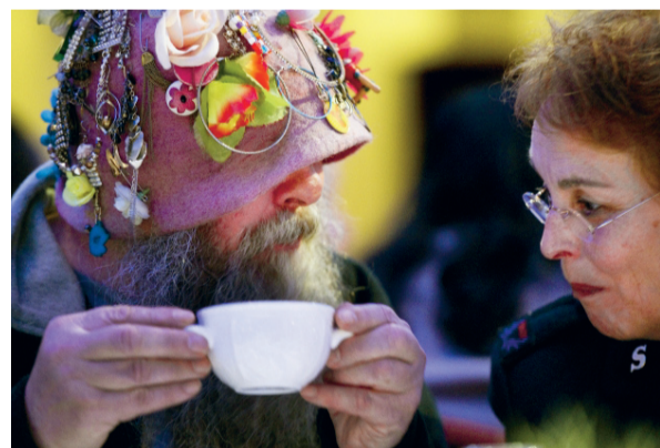
‘Feestelijk’ gesprek met een vrijwilligster.

lenen. Ook voeren ze persoonlijke gesprekken; een vorm van contact die nergens anders geboden wordt. Iedere vrijdag is er in het Stads klooster aan het Westeinde een kerkdienst, gevolgd door een maaltijd. Daaraan nemen zo'n tachtig tot honderd bezoekers deel.