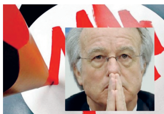
Burgemeester Jozias van Aartsen

Het onderzoek laat verrassende resultaten zien. Een flink aantal stembureaus in kerken scoort beduidend beter dan andere stembureaus in dezelfde buurt. Dat zijn de stembureaus in de kerk van de Zevende Dags Adventisten, de Bosbeskapel, Bethelkerk Loosduinen, Agneskerk, Maranathakerk, Lutherse kerk en Christelijke Gereformeerde kerk. Toppers blijken de Bethelkerk en de Maranathakerk, die respectievelijk 26 en 22 procentpunt hoger scoorden dan niet-kerkelijke stembureaus.