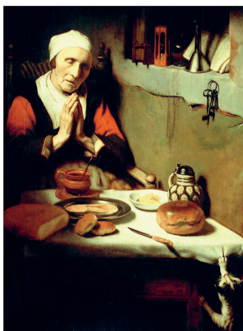
Een christelijke (groot)moeder dankt God voor zijn zegeningen. Schilderij Nicolaes Maes (1634-1694).