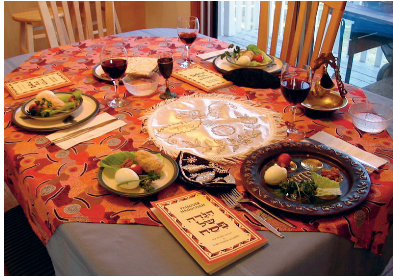
De Seidermaaltijd herinnert joden aan de onderdrukking in Egypte en hun bevrijding.