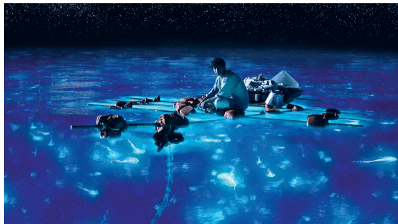
Pi vangt een glimp op van Gods majesteit.

dingsboot delen met een viertal dieren, waaronder een vervaarlijke Bengaalse tijger. Samen moeten ze zien te overleven op de Grote Oceaan. Een schijnbaar onmogelijke taak. Regisseur Ang Lee is er niet voor teruggedreind om alle registers open te trekken. De scheepsramp is verbluffend geloofwaardig in beeld gebracht en geeft de kijker het gevoel plotseling heel klein te worden tegenover het onmetelijke natuurgeweld. Ook de verschrikkingen die Pi meemaakt nadat hij alleen met de tijger is overgebleven, zijn bij vlagen huiveringwekkend.