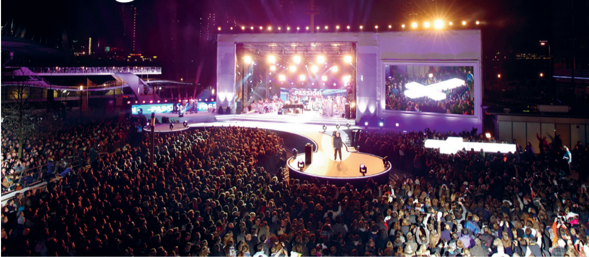
The Passion, vorig jaar in Rotterdam: muziekfeest of sober medelijden?