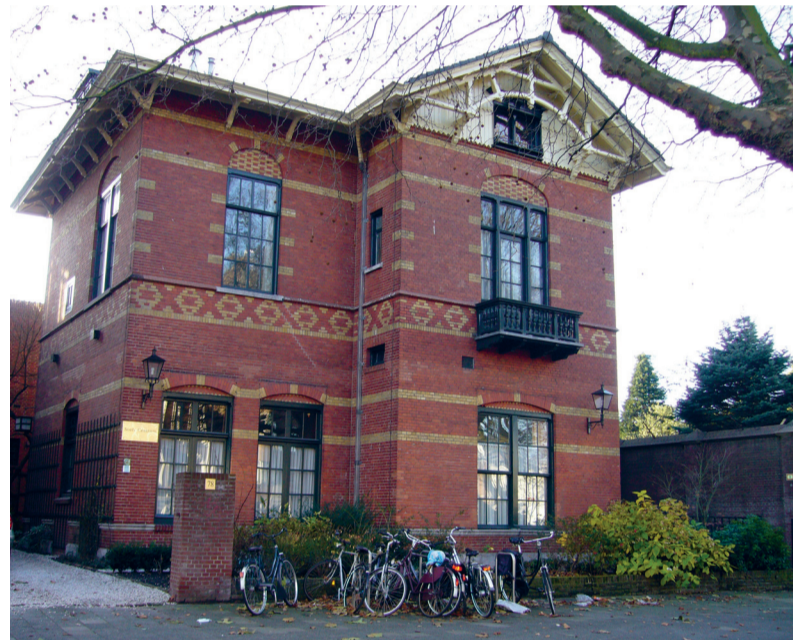
Het gebouw van de soefibeweging, voorheen een oud tramstation.

Een eeuw later is niets meer zichtbaar van het spoor waarlangs de tram tuftte tussen 1886 en 1916, in tegenstelling tot de sporen die de geschiedenis in het voormalige stationsgebouw achtergelaten heeft. Het pand, in 1916 ver-