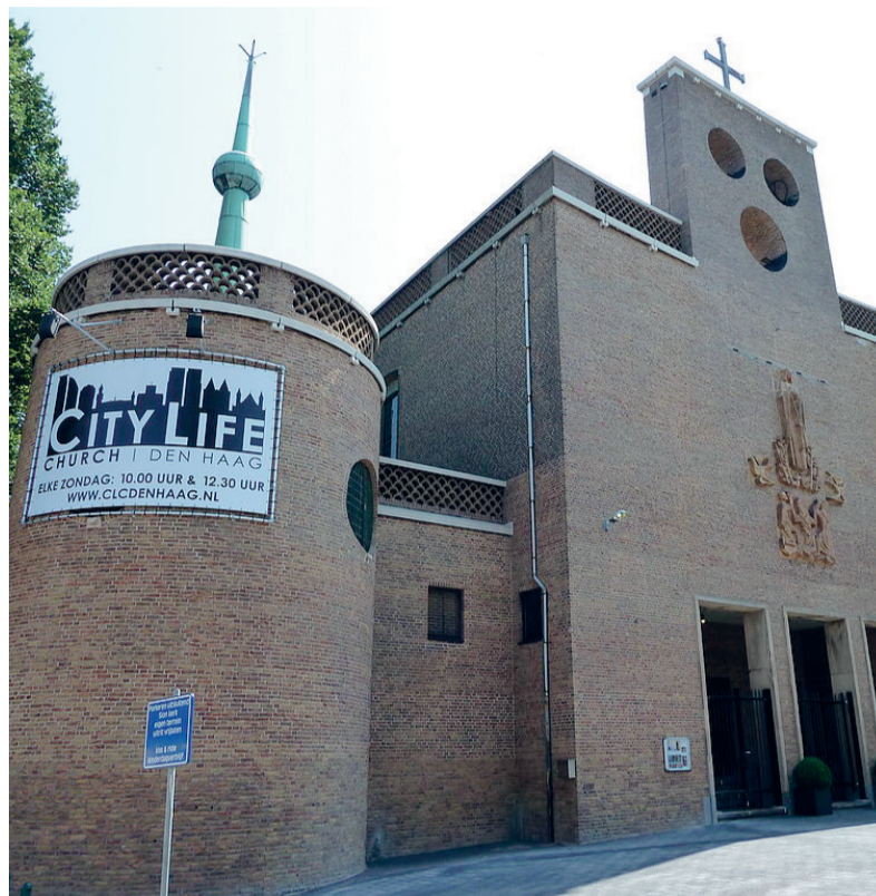
De City Life Church is gevestigd in de voormalige Fatimakker.

Het doel van de Healing Rooms is niet zozeer om mensen 'op te leiden' tot genezers, maar om ze toe te rusten, hun bijbelkennis te vergroten en tot discipelen te maken. Het is uitdrukkelijk niet de bedoeling zich tegen de medische stand te verzetten. 'We hebben elkaar nodig', zegt Van de Ridder na afloop. De pastor put onder meer inspi-