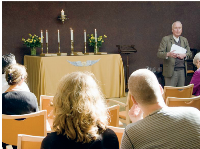
Gebedsruimte van de soefi's aan de Anna Paulownastraat 78.

Griekse filosofen, de islam en poëzie van Perzische dichters kwamen die tradities in het (overwegend) hindoeïstische India terecht. Hazrat Inayat Khan haalde er inspiratie uit voor zijn muziek en mystiek. In 1910 belandde hij in de Verenigde Staten en Europa, en verweefde het soefisme met wester-