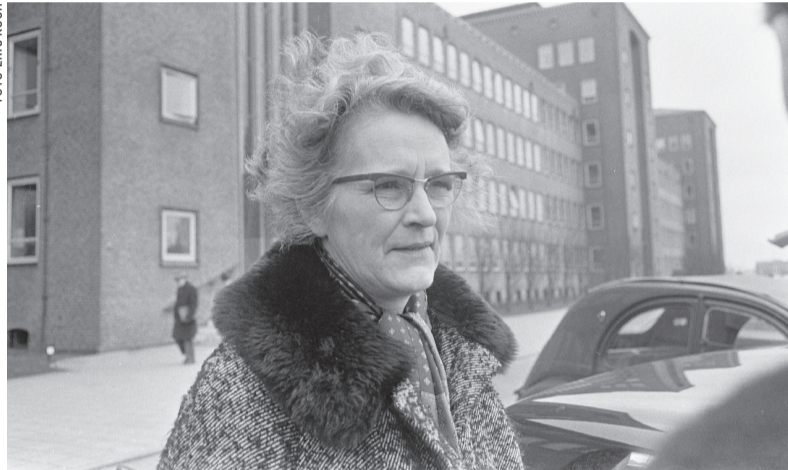
Marga Klompé tijdens de kabinetsformatie van 1967.