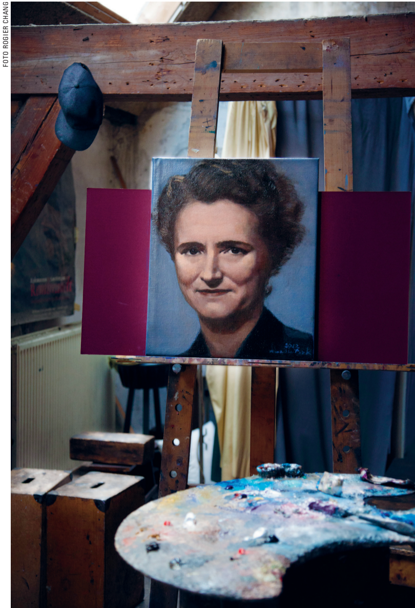
Geschilderd portret door Marike Bok.