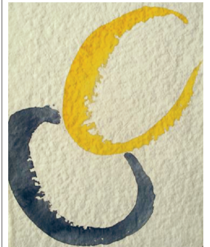
Aquarel door Roeli Willekes.