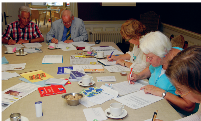
Het voelt bijna meditatief, dit ambachtelijke handwerk.

MEET Z'N TIENEN (VIER MANNEN, zes vrouwen) zitten ze rond een grote tafel, in stilte, schrijvend. Het is de tweede maandag van de maand; in de Paleiskerk worden brieven geschreven voor Amnesty International. Brieven aan regeringsleiders van allerlei landen, waarin men aandacht vraagt voor misstanden.