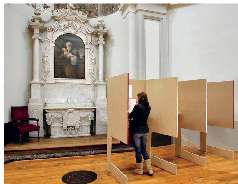
Stembureau in de Amsterdamse kerk 'De Duif'. Het Jezuskind heeft meer belangstelling voor de oude Simeon dan voor het democratische ritueel van de verkiezingen.