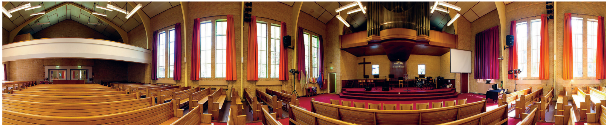
In de Vredekerk blijft het orgel waarschijnlijk onbespeeld.