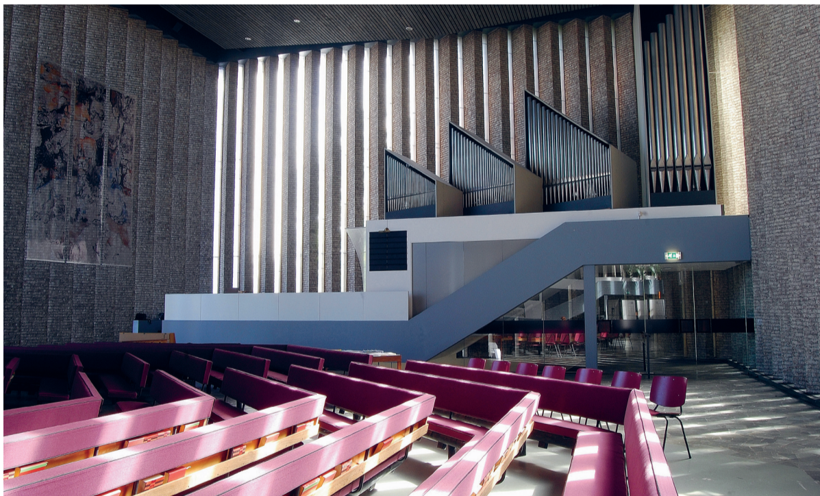
Het kleurige interieur staat in schril contrast tot de buitenkant.

KERKENTEST De tweeënveertig meter hoge toren van de Christus Triumfatorkerk bepaalt het straatbeeld van de Juliana van Stolberglaan. Om kwart voor tien luidt de enige klok, die als opschrift heeft: 'Deo sono populum voco', ik luid voor God en roep het volk.