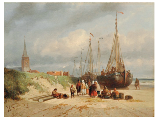
Bomschuit op het strand (H.W. Mesdag).

De keuze is gevallen op een miniaturbomschuit. De bomschuit is het platte scheepstypet dat in Scheveningen het langst in gebruik is geweest. Het is op tal van schilderijen, onder andere van Mesdag, afgebeeld. Het wordt een kerkscheepje van tachtig bij veertig centimeter, gemaakt naar originele tekeningen. Het wordt vervaardigd door modelbouwer Herman Visser uit Papendrecht.