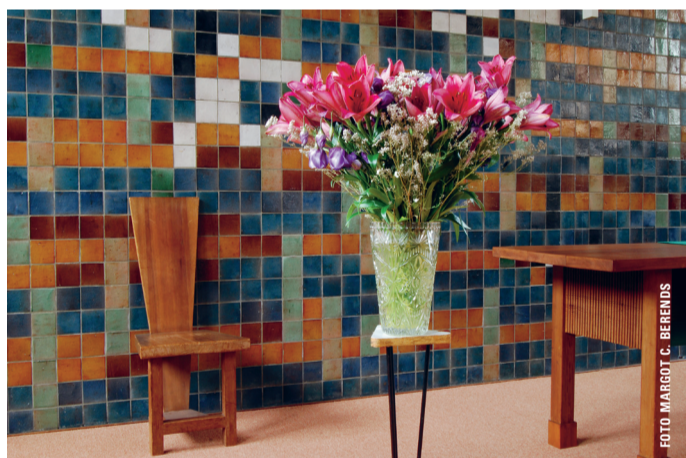
De Bethelkapel. Lelijk? Nee, intiem.

Naarmate de dienst vordert, besef ik dat Spaans een man is die je veel vergeeft. Hij is gewoon een beetje maf; en