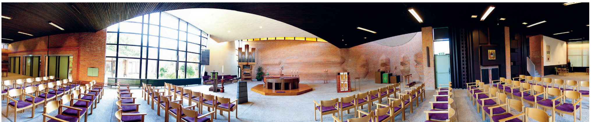
Het interieur van de Kruispuntkerk is een mengeling van sferen: kloosterachtig en modern protestants.