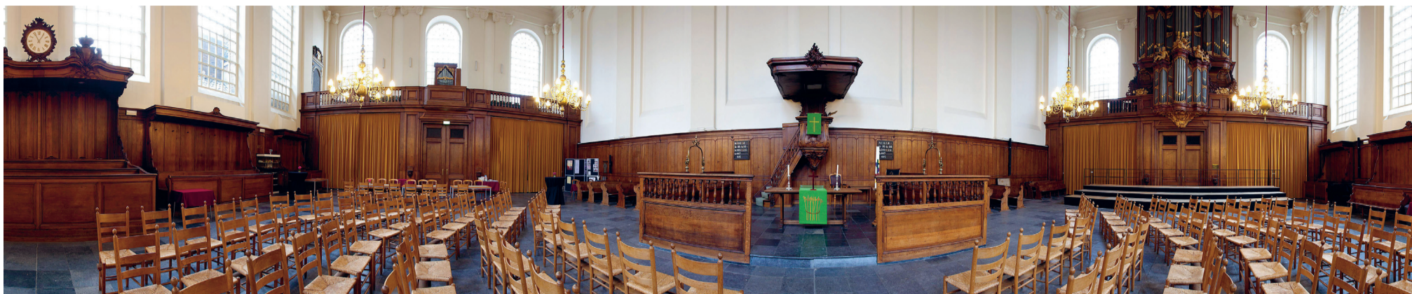
De koperen kroonluchters bovenop het achttiende-eeuwse Bätz-orgel verfraaien de ruimte. Dit 'schip van de kerk' oogt imposant.