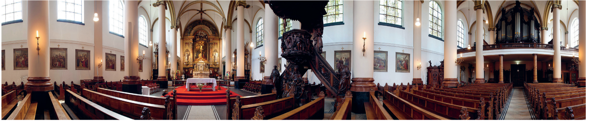
In de Theresia van Avilakerk gaat de bezoeker op in de sfeer van deze negentiende-eeuwse rooms-katholieke kerk.