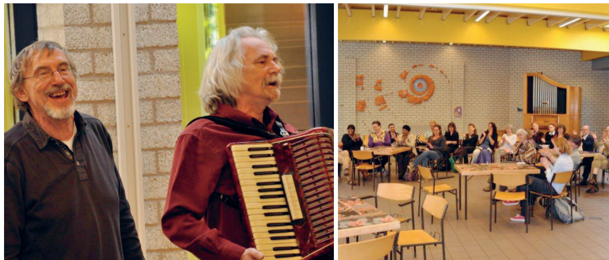
De stemming in de Lukaskerk is geanimeerd, maar de opheffing van de IKW raakt iedereen.

NIEUWS Sociaal zwakkeren, ex-gevangenen en anderen die op eigen kracht moeilijk een huis kunnen organiseren, kunnen geen beroep meer doen op bemiddeling van de Haagse Stichting IKW. Omdat de gemeente Den Haag de subsidiekraan dicht draait, heft de stichting zich op. Zo’n dertig medewerkers en sympathisanten kwamen nog één keer bij elkaar.