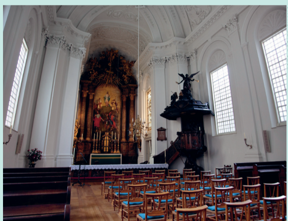
De kerkzaal van de oud-katholieke kerk.