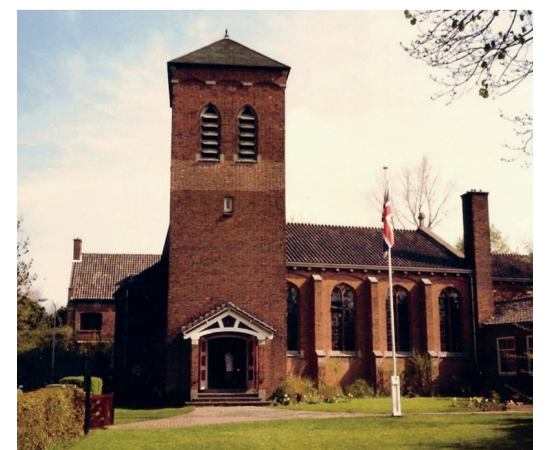
De Anglicaanse kerk.

De Anglicaanse gemeenschap in Den Haag telt tegenwoordig ongeveer 250 leden, afkomstig uit vijftientig landen. Hagenaars waren uitgenodigd om samen met hen van 22 tot en met 24 juni het jubileumfeest te vieren. Met rondleidingen, foto-exposities, informele zangvieringen en koorconcerten hebben de bezoekers zich in het heden en verleden van de Haags-Anglicaanse gemeenschap kunnen verdiepen. De kerk houdt iedere zondag vier vieringen: om 8:30, 9:30, 11:00 en 18:30 uur.