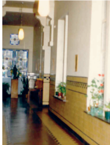
De gangen in het patershuis, in 1988 en anno 2012.

N OG EVEN EN ER WONEN GEEN jezuiten meer in Den Haag. De laatste zes vertrekken binnenkort. Een historisch moment, vooral als je bedenkt hoe groot de orde van de jezuiten ooit was en hoe promi-