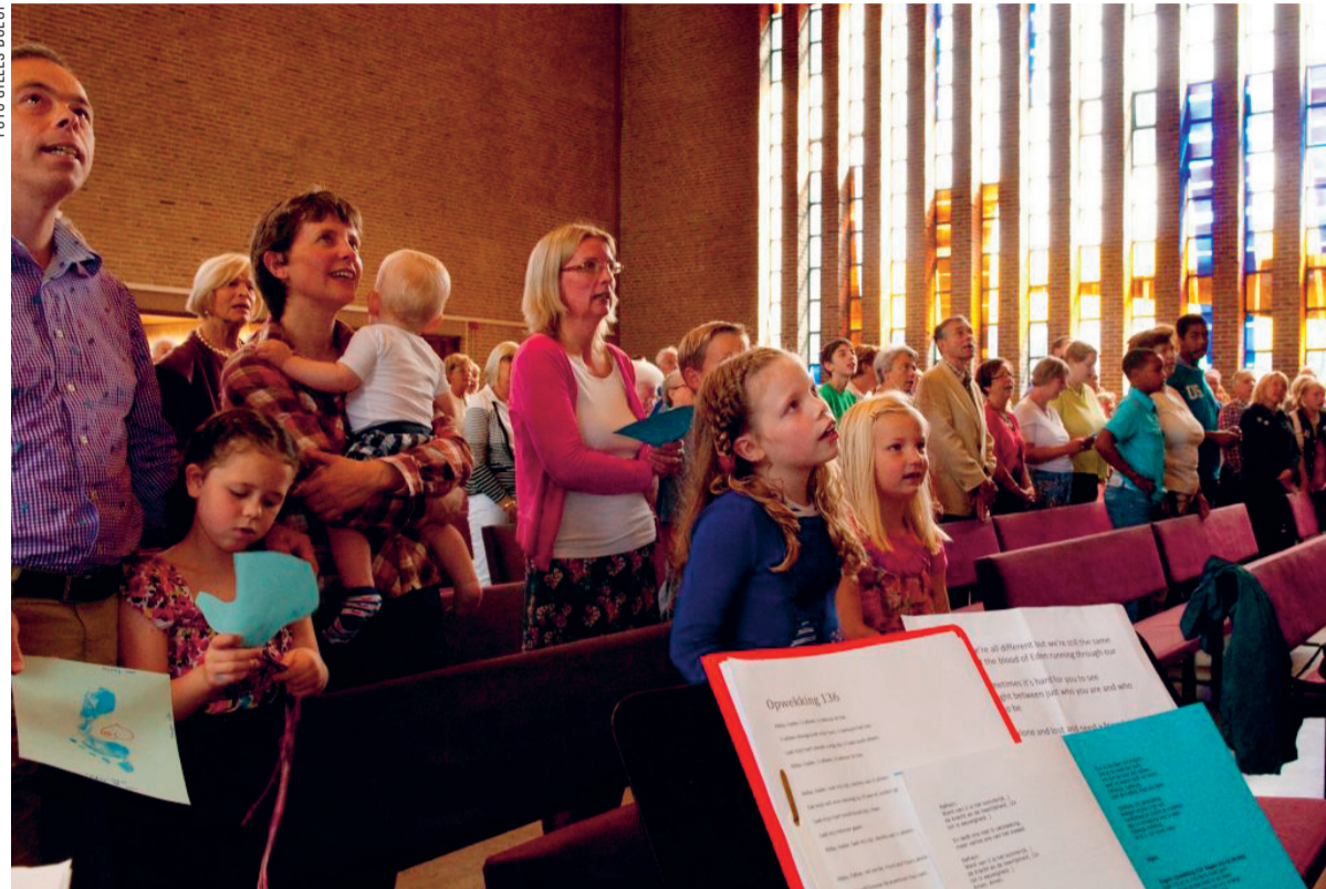
De liederen staan op een groot beeldscherm.

REPORTAGE In tegenstelling tot de vele kerken die het moeilijk hebben, trekt de Scheveningse Bethelkerk 'volle zalen'. Daar bestaat een lokrecept voor: de doelgroepdiensten.