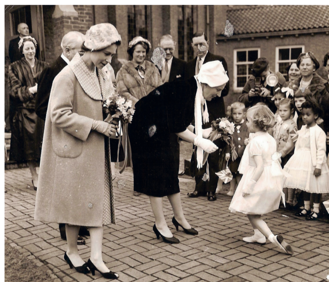
Bezoek van koningin Elizabeth in 1958.