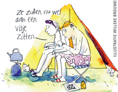
ILLUSTRATIE WILLEKE BROUWER

HET PROGRAMMA VAN ZOMERSTEK STAAT VANAF BEGIN JUNI OP WWW.STEKNET.NL, DE FOLDER IS VERKRIJGBAAR VIA TEL. 318 16 16.