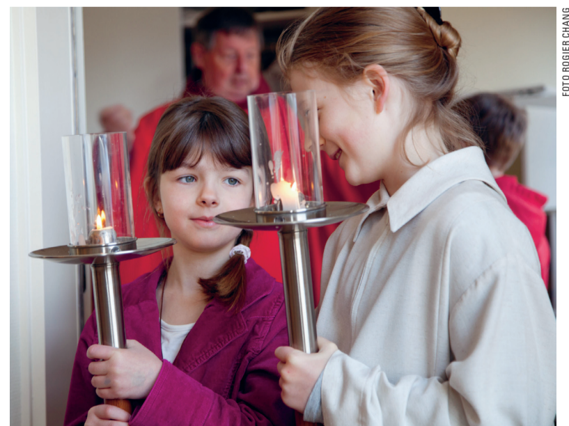
Kinderen lopen mee in de processie met Palmzondag.