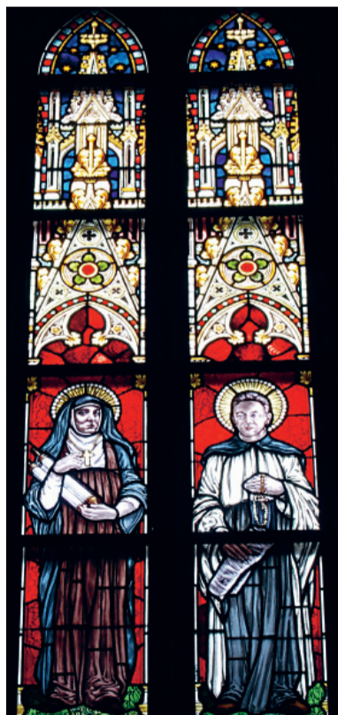
Het gebrandschilderde raam met Titus Brandsma, in de Parkstraatkerk. Links: Edith Stein.

In 1982 kreeg Brandsma postuum het Verzetshedenkingskruis. In 1985 is hij door de katholieke kerk zalig verklaard. De procedure om hem officieel heilig te verklaren, loopt nog.