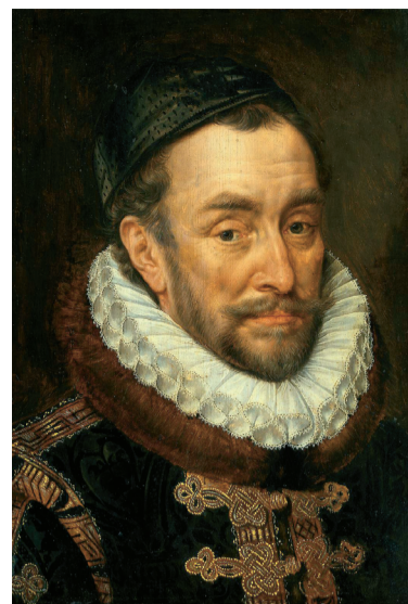
Willem van Oranje.

Zijn halfbroer Frederik Hendrik trouwde met Amalia van Solms. Het stel hield van dansen, dus er werd wel eens een bal gegeven op het Noordeinde. Ook werden er kaartavondjes gehouden: door- nomen in de ogen van hun eigen geloofsgenoten, de calvinisten.