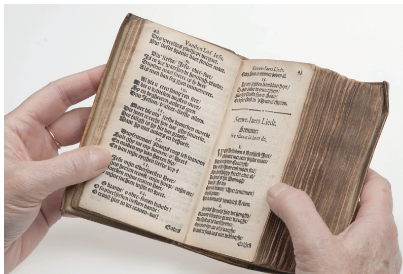
Het boekje 'De Wel-klingende Luyte'

NIEUWS Wie een half uurtje over heeft, moet even naar de Verdieping van Nederland. De bezoeker komt er neuriënd vandaan.