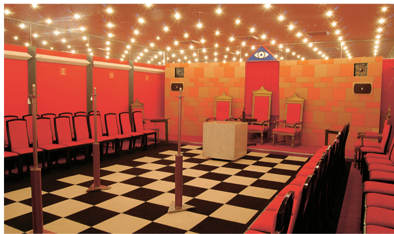
Het Haags Logegebouw heeft twee tempels, een rode en een blauwe.