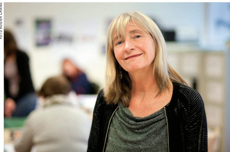
Basje de Liefde: ‘Gelukkig maken we bij VluchtelingenWerk ook veel moois mee.’