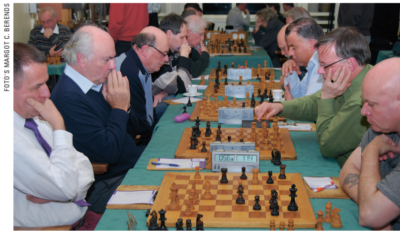
Geconcentreerde stilte in de schaaktempel aan de Van Speijkstraat.

Over nu naar een wat ludieker soort heiligdom. Wie zich volledig wil over-