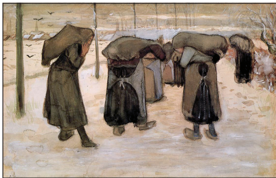
Mijnwerkersvrouwen, Vincent van Gogh, 1882