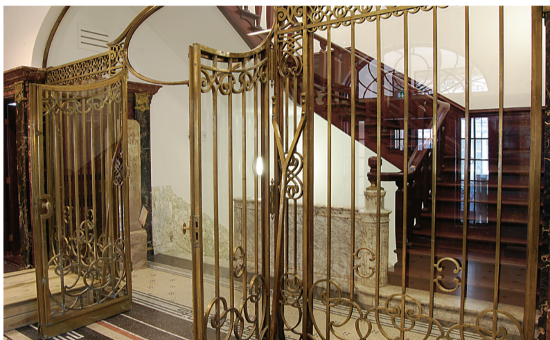
Portaal en trappenhuis van De Tempel.