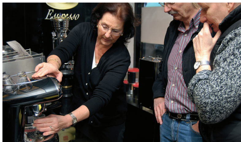
Inwijding in de handelingen voor perfect kopje koffie.