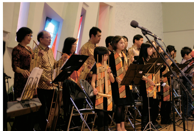
Een angloongorkest speelt tijdens het 25-jarig bestaan van de GKIN in de Bergkerk, 2010.