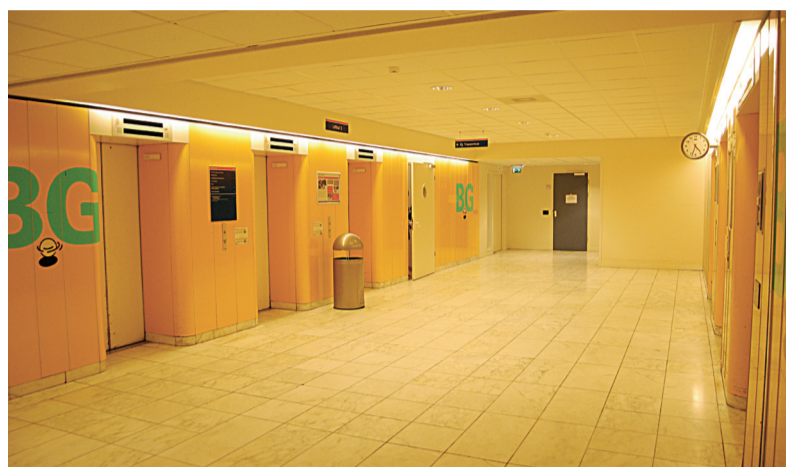
Liften in de gezondheidstempel Medisch Centrum Haaglanden Westeinde.