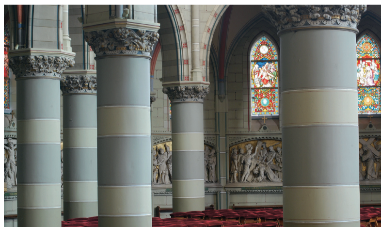
Uitnodigende knielbanken in de Elandstraatkerk.

geven aan de rituelen van hedendaagse koffieceremonies, kan her en der in de stad terecht bij koffietempels. Helemaal achter in het pand van de firma Nespresso op de Plaats bijvoorbeeld, bevindt zich een tafel, waaromheen koopgrage klanten aan kopjes espresso nippen. De koffieclerus draagt stemmig grijs en verkondigt glimlachend het Nespressogeloof. Je komt er niet zo maar binnen: wil je een apparaat of koffiecapsules kopen, dan moet je eerst lid worden van de Nespressoclub.