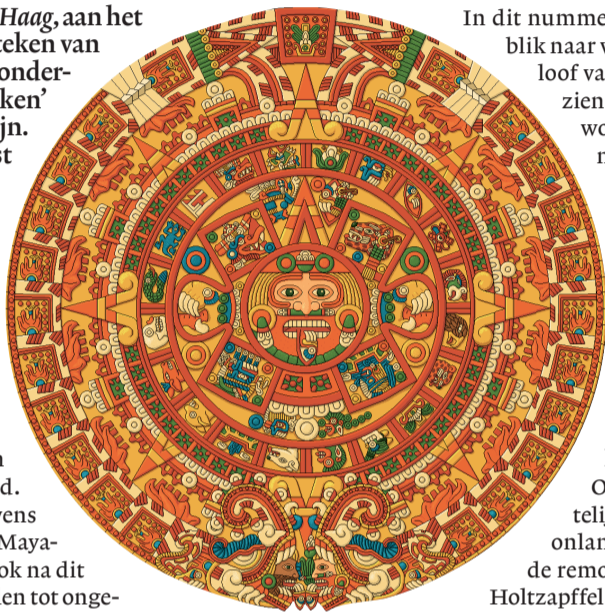
Reproductie van de Mayakalender.

H OE ZIET DE TOEKOMST er uit? Er is al een spectaculaire rampenfilm over 2012. En sommigen denken dat ook de oude Midden-Amerikaanse Mayavolken voor 2012 het einde van de wereld hebben voorspeld. Maar wie goed naar alle gegevens en theorieën kijkt, ziet dat de Mayakalender gewoon doorloopt, ook na dit jaar. Er lijkt voorlopig geen reden tot ongerustheid te zijn. Wat dit betreft, tenminste.