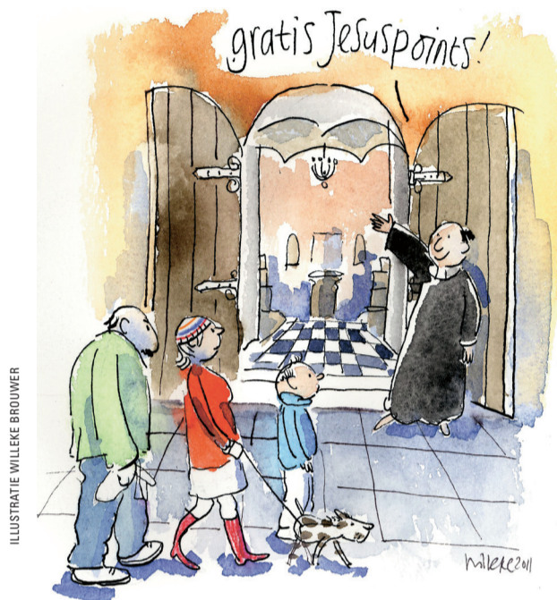
ILLUSTRATIE WILLEKE BROUWER

Aandachtspunt: organiseer je eigen weerstand. Zorg ervoor dat plannen ook door de uitersten in de kerk gedragen worden. Alleen dan krijg je iedereen mee.