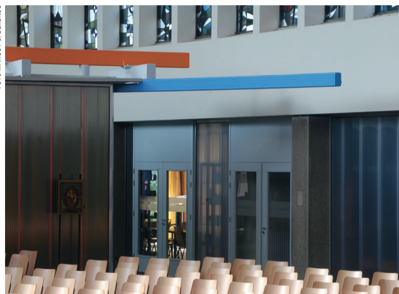
Emmauskerk. De Emmausparochie is een van de vier parochies die worden samengevoegd.

D IT NAJAAR IS NAMENS VIER parochies in Den Haag-Zuid een verzoek uitgegaan naar de bisschop van Rotterdam om te komen tot één nieuwe parochie. Het betreft de parochies Maria van Eik en Duinen, H. Pastoor van Ars, de Titus Brandsmaparochie en de Emmausparochie. Behalve de Pastoor van Arsparochie zijn deze parochies al ontstaan uit eerdere fusies van parochies. Met dit verzoek geven de parochiebesturen gehoor aan het verzoek van de bisschop, zoals dat is verwoord in de diocesane beleidsnota Samenwerking Geboden 2 uit 2007. In die nota zijn de aanleiding en de doelstellingen van het bisdom uitgelegd en deze worden onderschreven door de besturen. De aanleidingen zijn het steeds meer afnemen van het aantal gelovigen en het