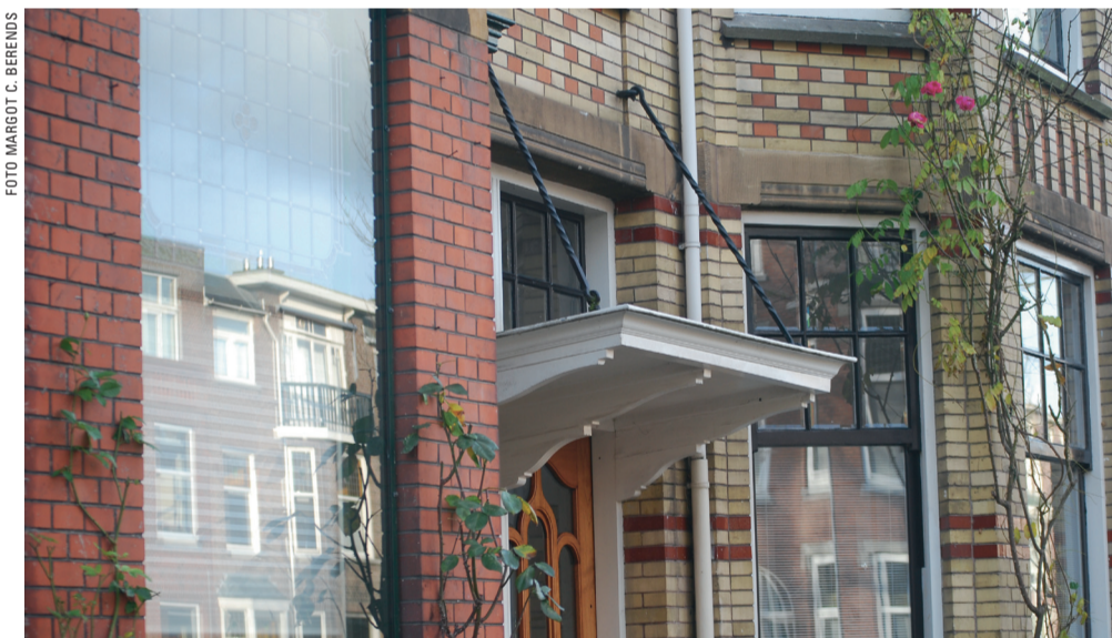
Huis op de Ieplaan.

Dyckmeester, 'al is de opzet inmiddels wat veranderd.' In het begin kookten zij en haar vriendin en was de maaltijd op een vast adres. Toen de vriendin