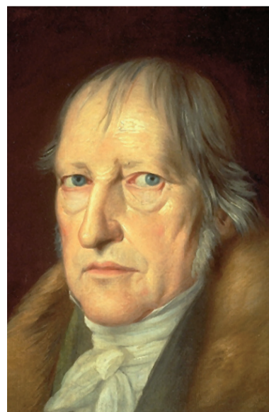
Georg Wilhelm Friedrich Hegel.