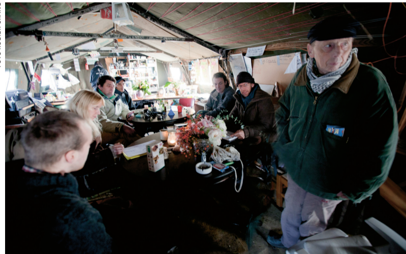
Middagvergadering in de grote tent op het Malieveld. Zijn de idealen bestand tegen vorst?

REPORTAGE De 'man van het jaar', uitgeroepen door het Amerikaanse weekblad Time , was in 2011 'de demonstrant'. De demonstrant woont ook in Den Haag. Hij – maar ook zij – neemt deel aan de Occupy-beweging en bivakkeert op het Malieveld.