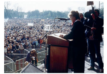
Tijdens de vredesdemonstratie in 1983 sprak prinses Irene bij de manifestatie in het Zuiderpark.

vende van kindertehuizen. Tegenwoordig is het vredeswerk voor haar bijna een full-time baan. Wat houdt haar gemotiveerd? 'Het geloof in gerechtigheid en vrede. De overtuiging dat het goed moet worden op aarde. Dat lukt niet altijd. Misschien wel nooit', voegt ze er schuchter aan toe.