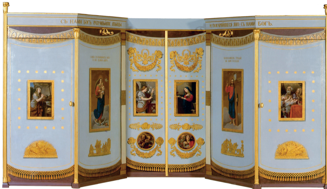
De verplaatsbare iconostase is nog meegetorst tijdens een slag tegen Napoleon.