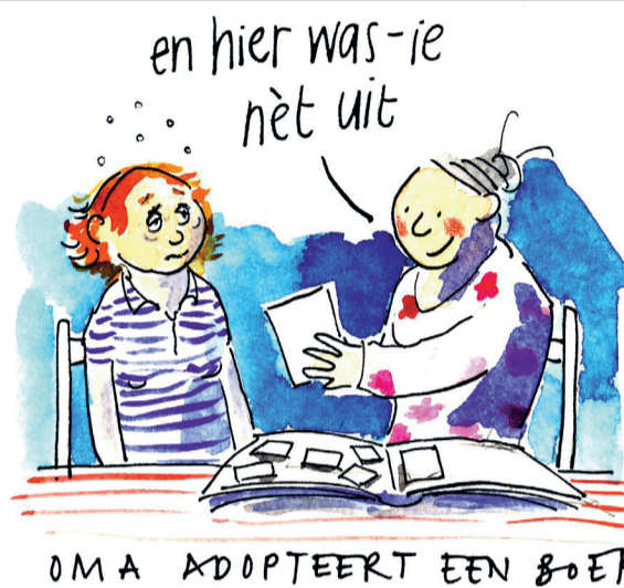
ILLUSTRATIE WILLEKE BROUWER

INFO OVER BEIDE ACTIES: WWW.MEERMANNONL.NL