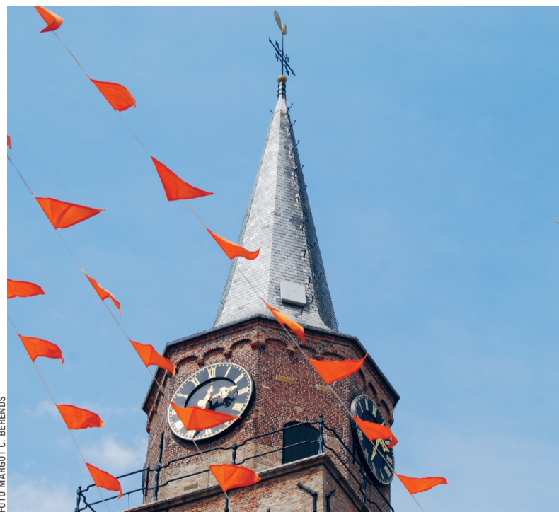
De Oude Kerk van Scheveningen.

ZATERDAG 10 SEPTEMBER 10 – 16.30 UUR. KEIZERSTRAAT 8.