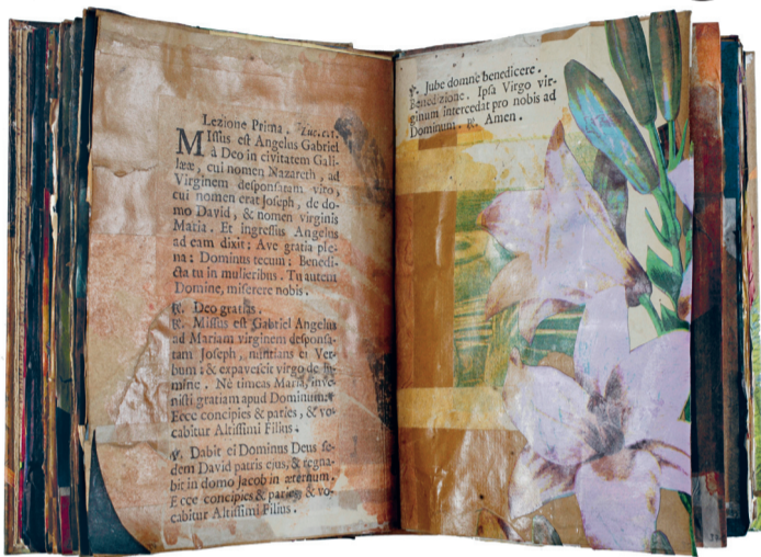
Getijdenboek van Robert Schwarz.

NIEUWS Museum Meermanno heeft extra geld nodig om open te kunnen blijven. Het museum financieel steunen kan door een boek te adopteren. Het oudste Haagse boek en een getijdenboek van Robert Schwarz zijn al vergeven: geadopteerd door KDH.