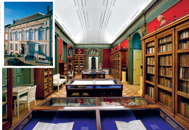
Pand (inzet) en zaal in Museum Meermanno.