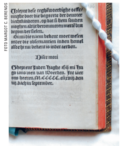
Die wandelinghe der bloemen, met onderaan plaats, jaar en datum van uitgave.

En dus zijn er allerlei acties op touw gezet: een benefietveiling en het adoptie-idee 'boek zoekt vrouw' (en man en bedrijf). Omdat Kerk in Den Haag geworteld is in een 'godsdienst van het boek' leek het de redactie aardig om ook een boek te adopteren.