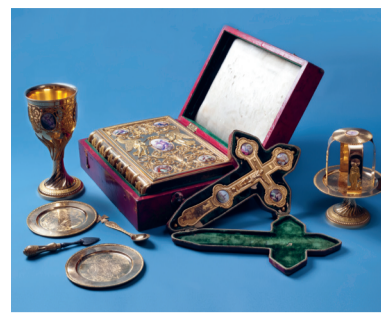
Bijbel en gouden gerei, St. Petersburg, ca. 1820.

De kapel bevindt zich in de Obrechtstraat sinds 1937. Daarvoor leidde de inventaris een zwervend bestaan, maar dankzij het testament van Anna Paulowna zijn alle voorwerpen altijd wel bij elkaar gebleven. Oorspronkelijk was de