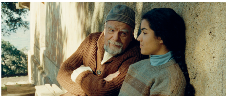
Een meisje uit het dorp spreekt vertrouwelijk met een van de monniken.

AGENDA Des hommes et des Dieux toont hoe in een Algerijns dorpje christenen en moslims samenleefden. Het verhaal is uitgangspunt voor een interreligieuze studiemiddag.