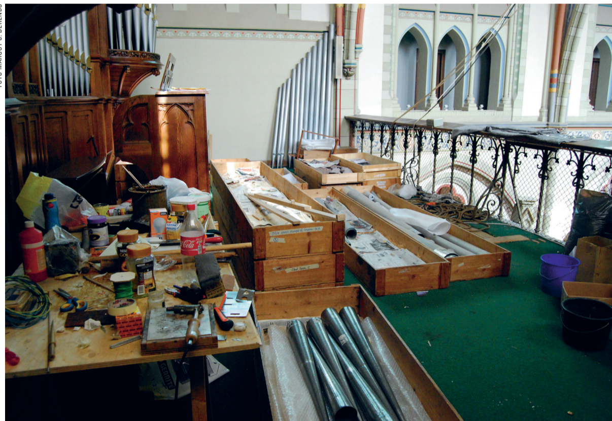
Werk in uitvoering aan het Elandstraatkerkorgel.