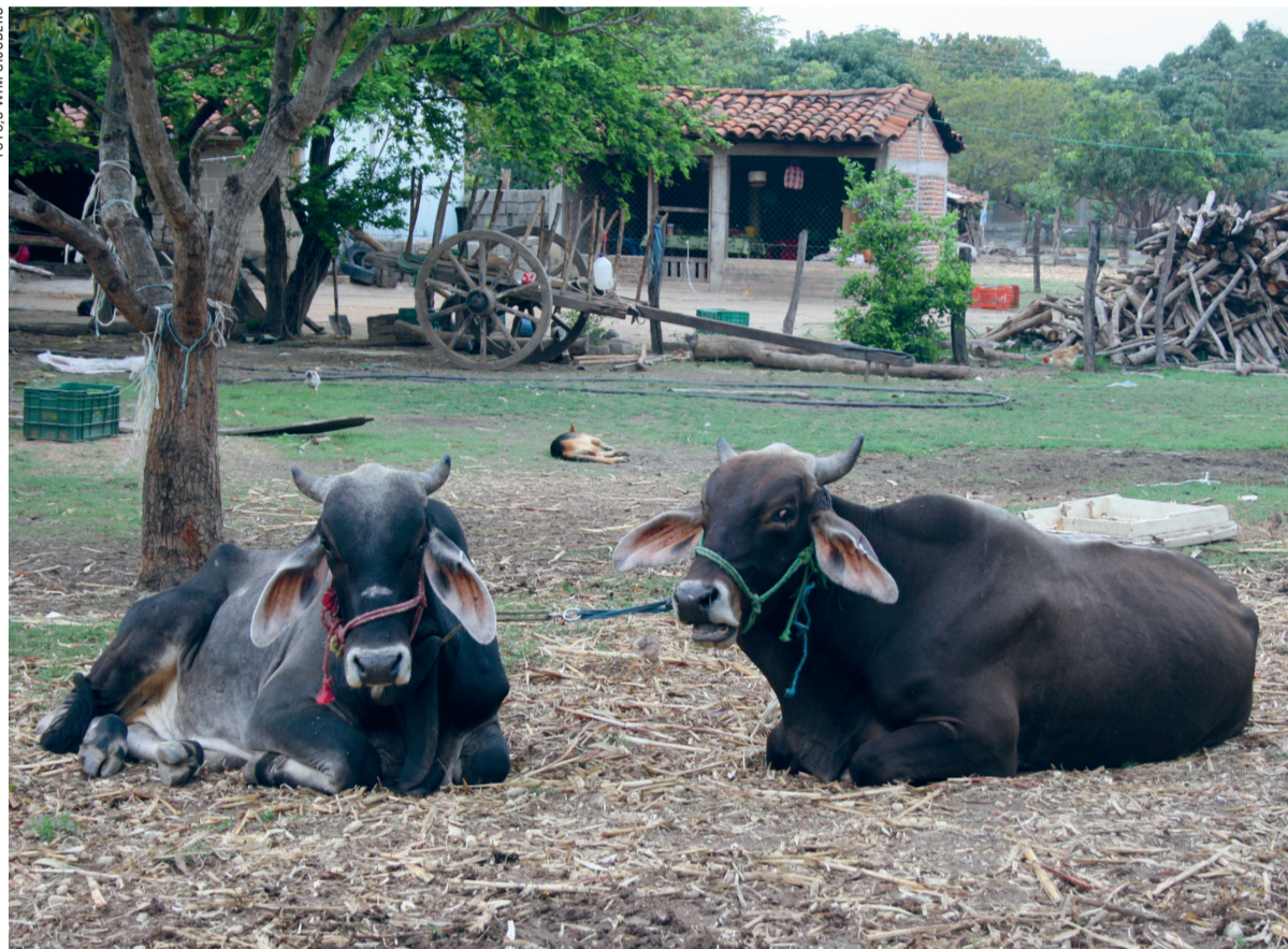
Het dorpje Zanatepec waar het centrum Cecaci is opgericht.