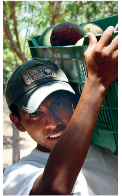
Een werknemer in de boomgaard.